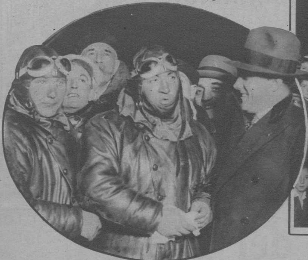
Paris.—Los aviadores Codos y Robida, han batido el «record» establecido por Costes, haciendo el vuelo Hanoi-Paris, en tres días, cinco horas y cuarenta minutos. En la fotografía, aparecen felicitados por Costes, momentos después de aterrizar en Le Bourget.