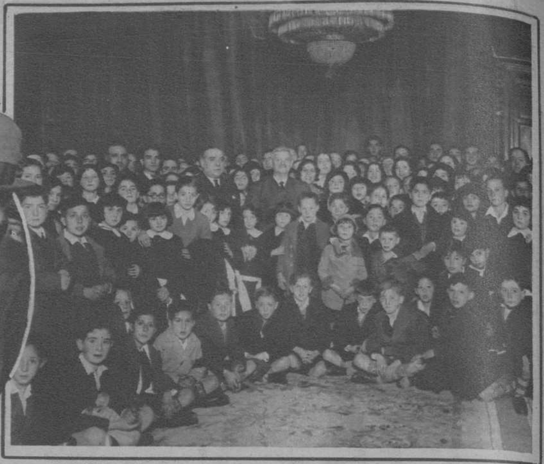
Madrid.—El ministro de Hacienda, señor Carner, rodeado de los alumnos del «Colegio de Huérfanos de Funcionarios de Hacienda», que han ido a visitarle.