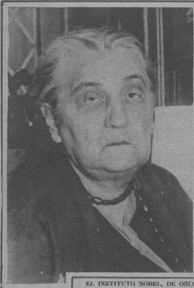
Juana Adams, fundadora de la Casa Hull, de Chicago