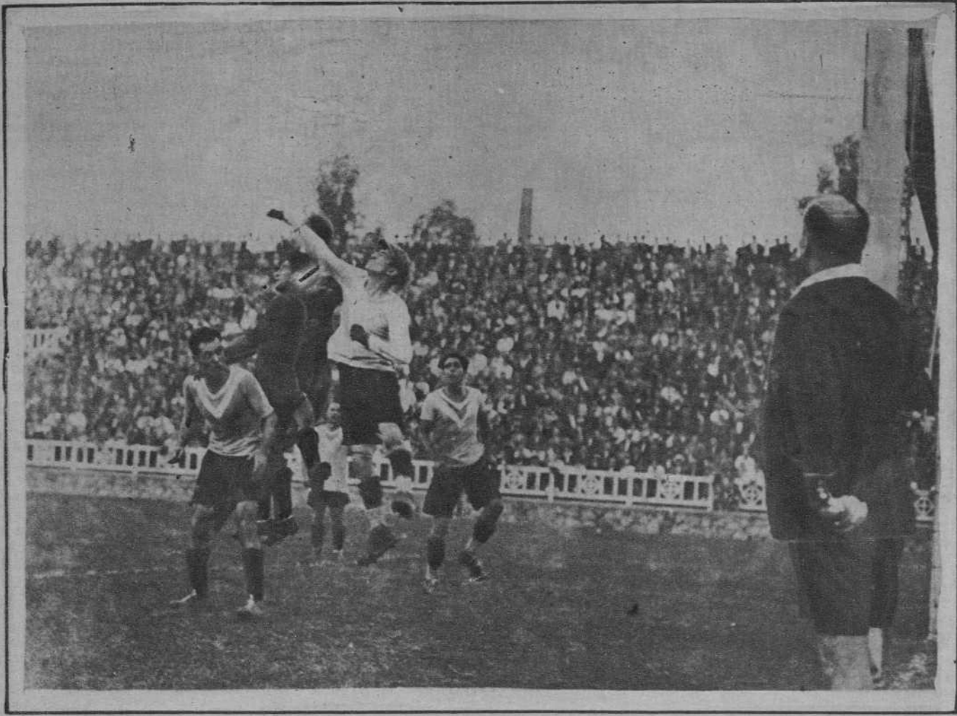
Partido «Barcelona-Badalona». Un despeje de Casanovas.