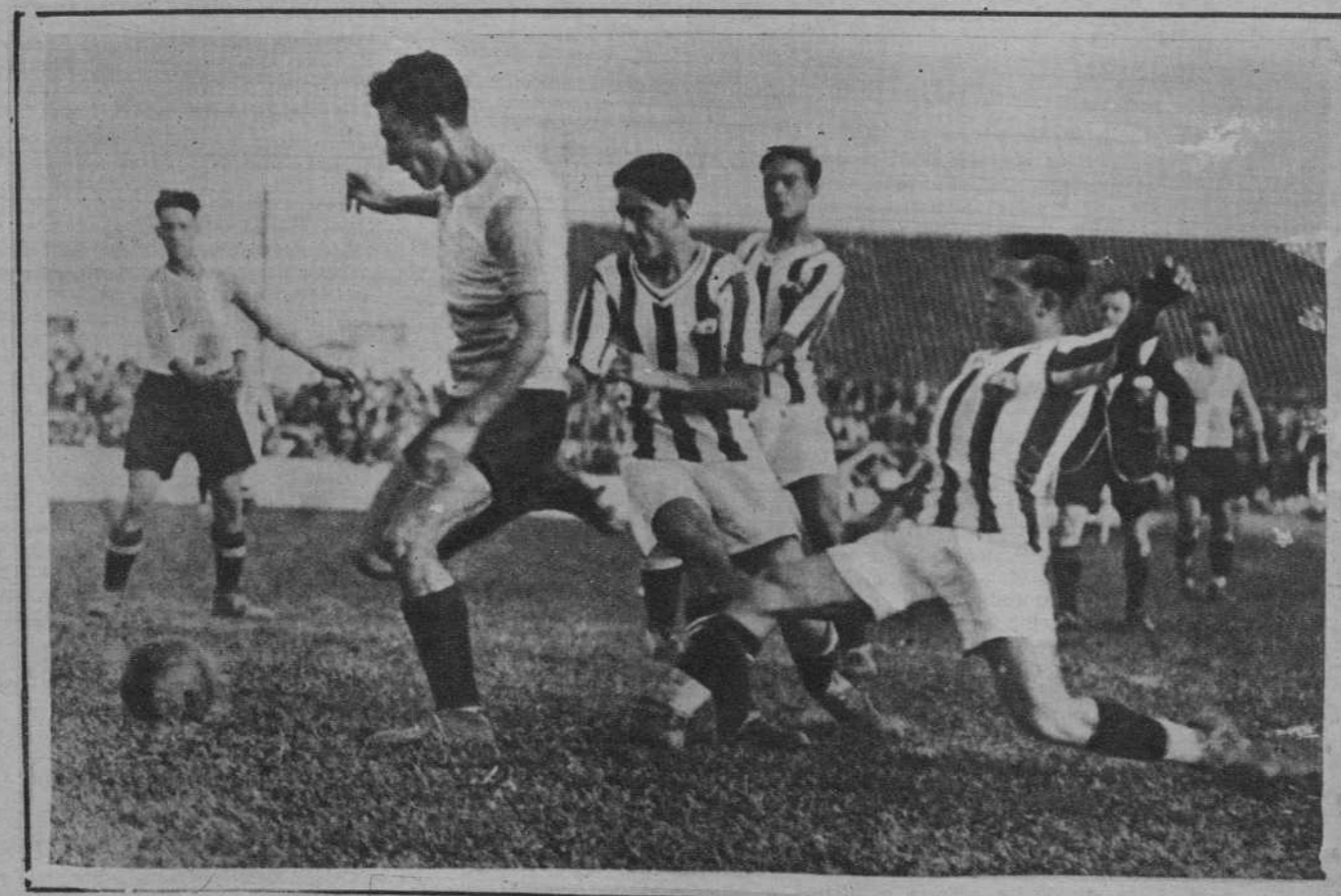
Un chut sabadellense.