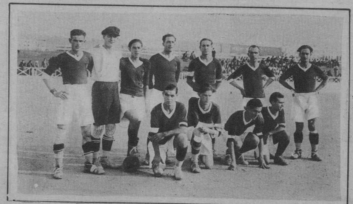
Tarragona. - Partido «Gimnástico-Villafraanca». - El equipo tarracónense