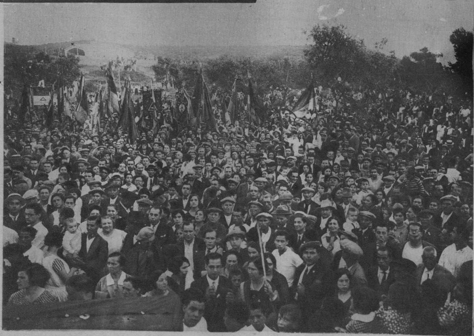
Un aspecto de la jira, en la «Font dels Tres Pins»