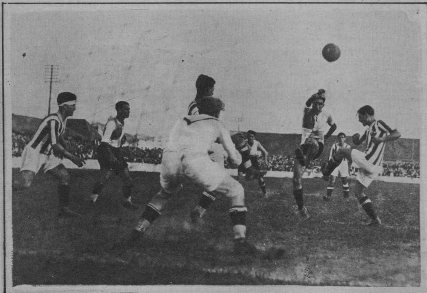
Partido «Sabadell-Júpiter». Ataque a la meta jupiteriana