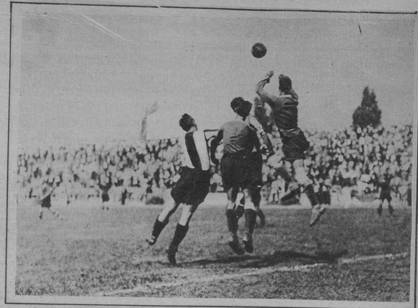
Partido «Español-Martínenc». Un despeje del meta suplente martinense.