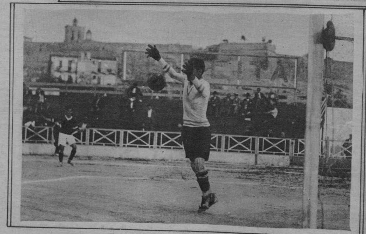
Blocaje de la meta tarracónense.