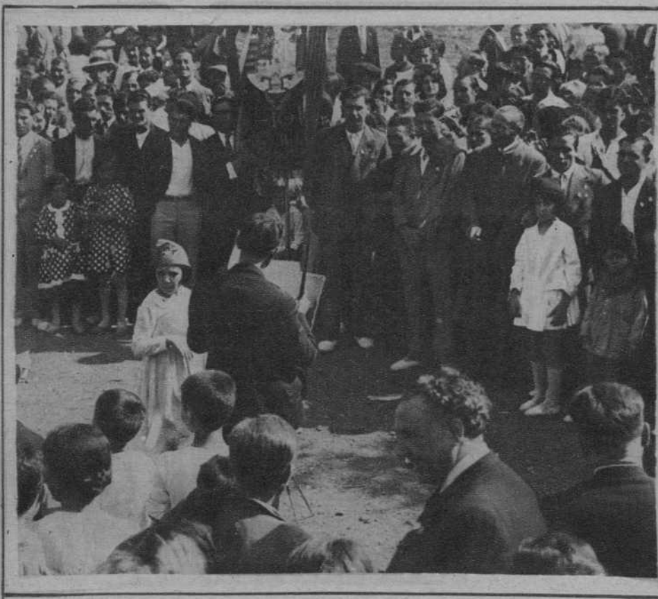
Un coro, cantando durante la fiesta.