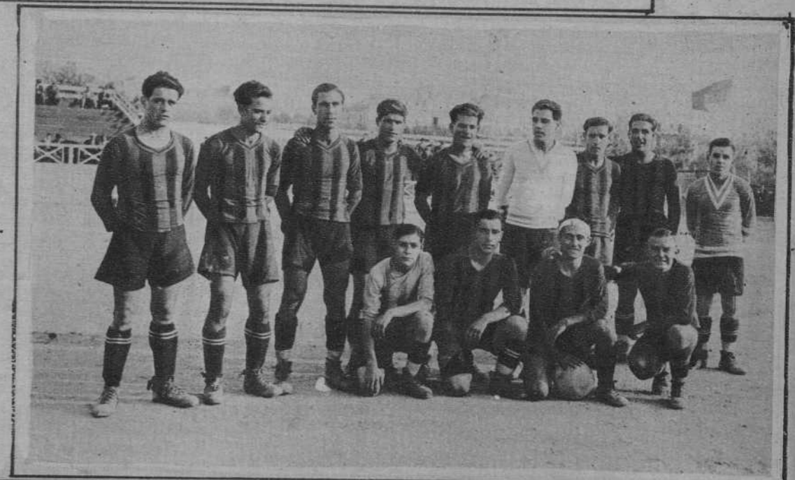
El equipo villafraquinense