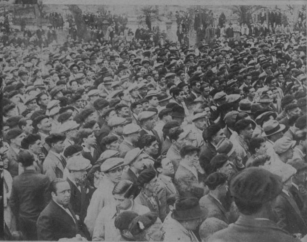
Oviedo.—El público escuchando los discursos en el mitin pro amnistía, celebrado al aire libre. — (Fot. Mena)