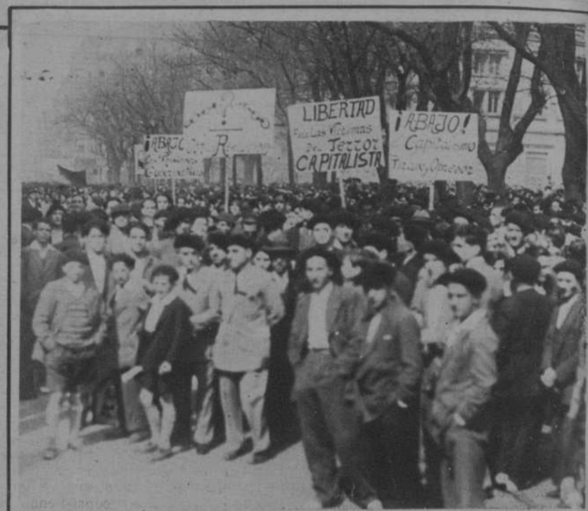
San Sebastián.—La manifestación pro amnistía (en la que, por cierto, no figuraba ningún cartelón alusivo al objeto del acto que tenía lugar), al llegar al Gobierno civil.