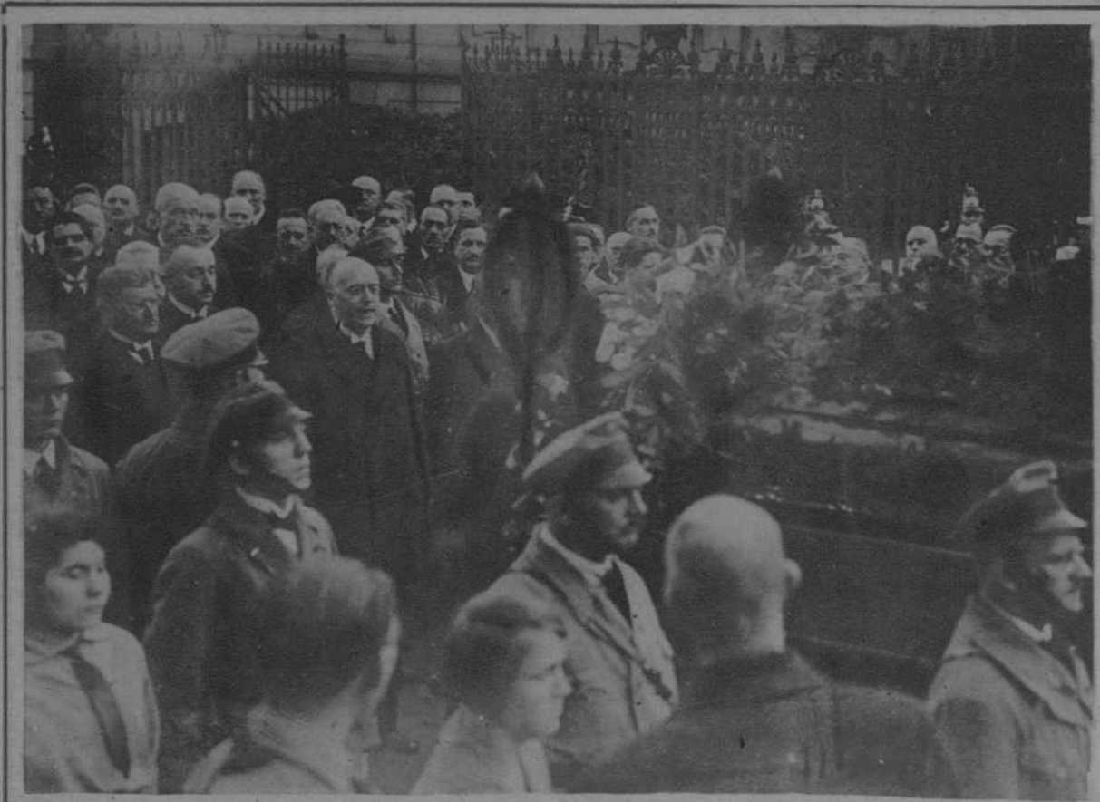
Berlín.—Un detalle del entierro del canciller Müller.