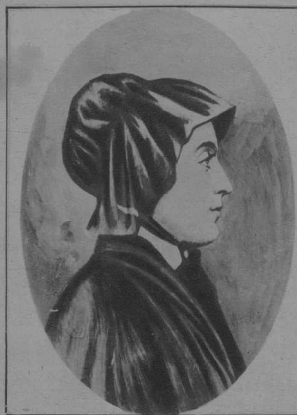
Nueva York.—La madre Elisabeth Leton, fundadora de la congregación de las Hermanas de la Caridad en los Estados Unidos, y cuya canonización se ha pedido a Roma.