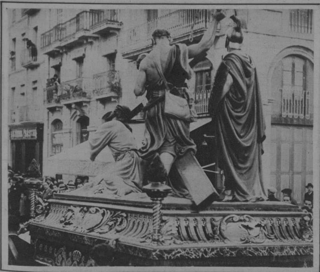
«La Caída de Jesús», de Perera, «paso» perteneciente a la R. H. de Jesús Nazareno, que figura en la procesión de Viernes Santo.