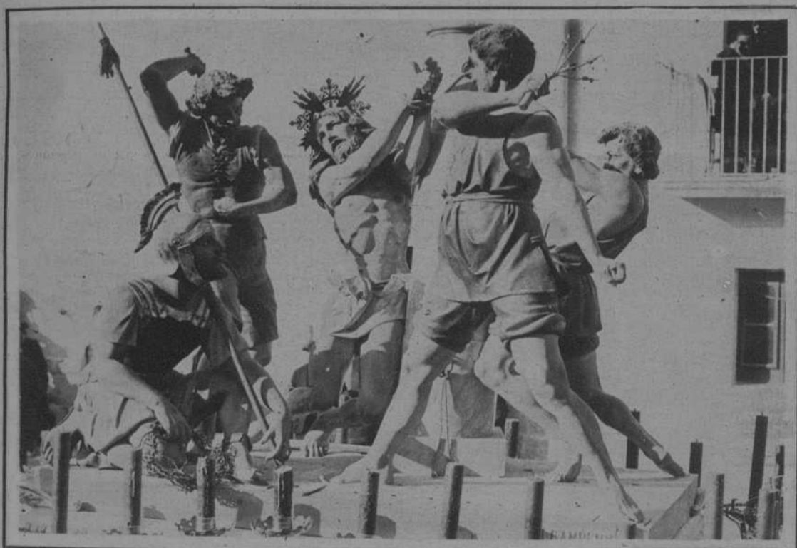
LA SEMANA SANTA EN TARRAGONA. — «La flagelación», del escultor Campeny, «paso» de los Aspirantes de la R. y V. C. de la Purísima Sangre