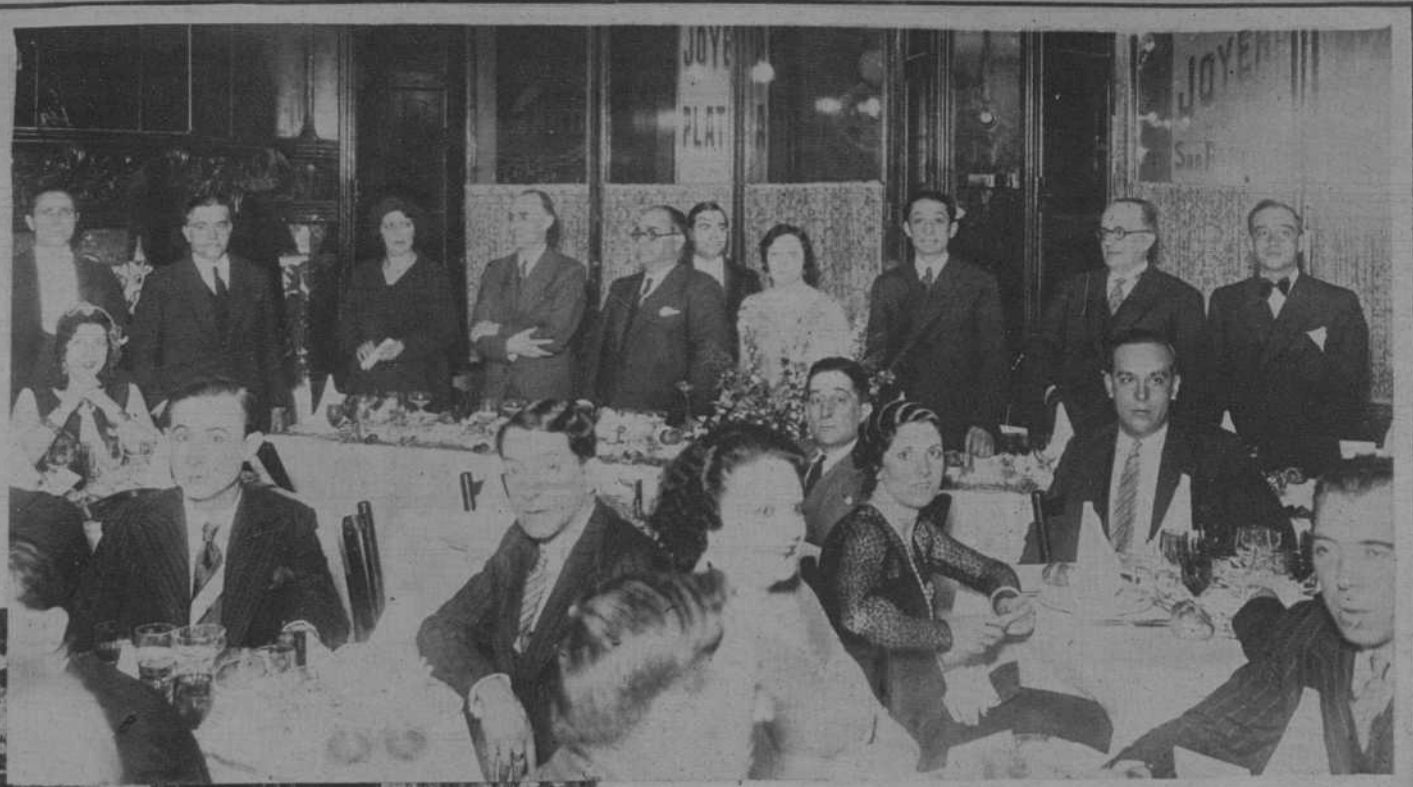
Banquete de homenaje dedicado al eminente barítono Marcos Redondo, por sus admiradores.