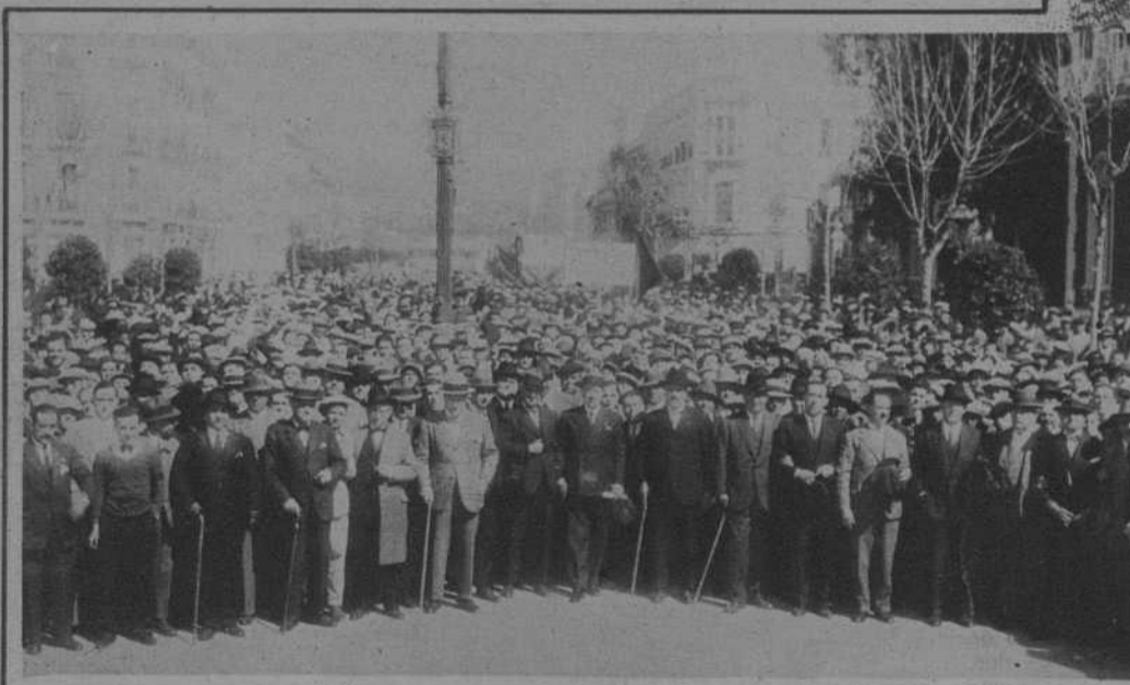
Córdoba.—La presidencia, formada por los presidentes de todas las Agrupaciones obreras, de la manifestación pro-amnistía.