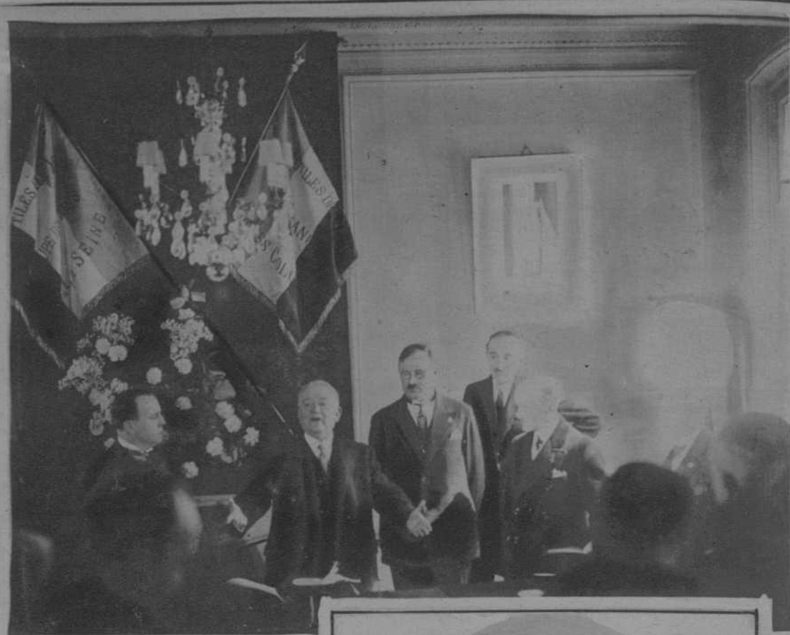
París. — Mr. Doumerge, pronunciando un discurso en el acto inaugural de la «Casa de los mutilados de los ojos».