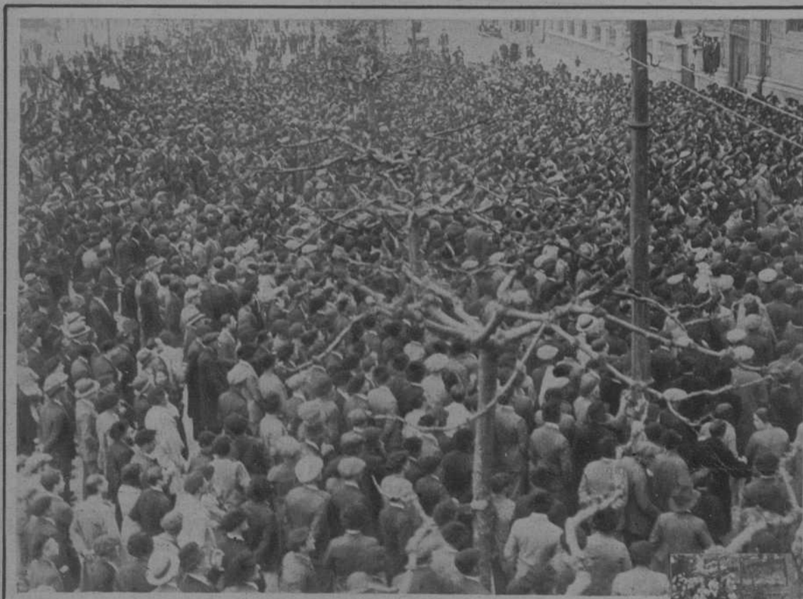
Santander.—La manifestación pro amnistía, frente al Gobierno Civil.