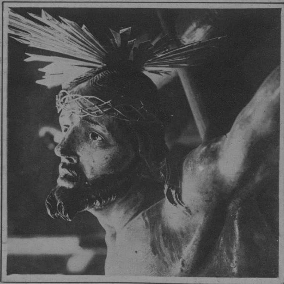
El Santo Cristo de la Agonía