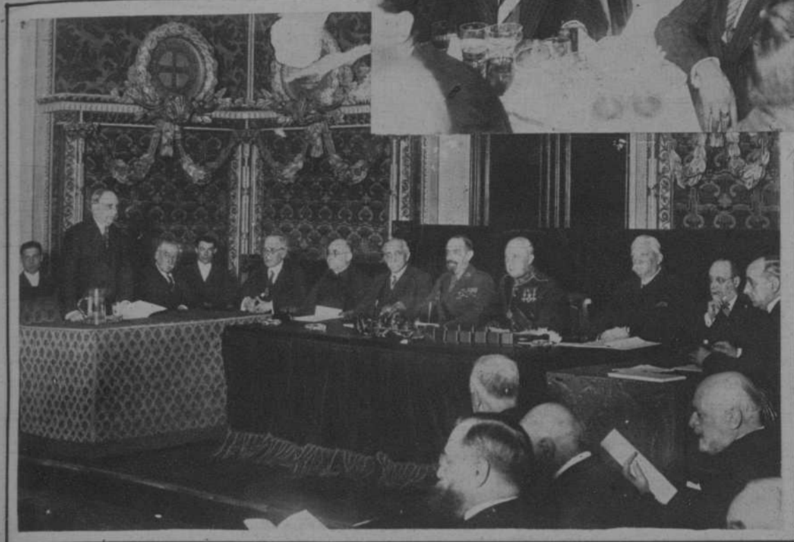
Sesión inaugural de la Real Academia Catalana de Bellas Artes.