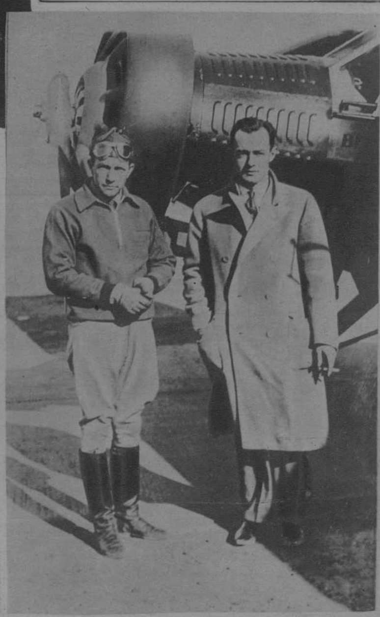
Roosevelt Field.—Los aviadores Clyde E. Pangborn y Hugh Herndon, que se proponen realizar un vuelo alrededor del mundo.