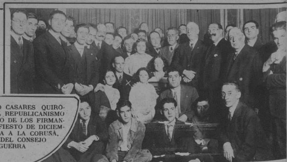
El señor Casares Quiroga (X), al llegar a su domicilio, rodeado de sus familiares y amigos y representaciones del republicanismo gallego, que le visitaron para darle la bienvenida

DON SANTIAGO CASARES QUIROGA, LIDER DEL REPUBLICANISMO CORUÑÉS Y UNO DE LOS FIRMAN- TES DEL MANIFIESTO DE DICIEM- BRE, REGRESA A LA CORUÑA, DESPUES DEL CONSEJO DE GUERRA