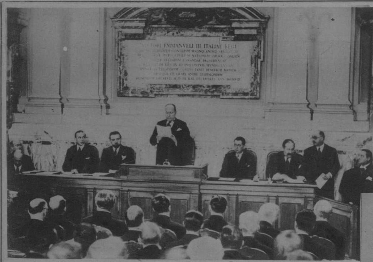
Roma.—El señor Mussolini, leyendo el discurso de apertura de la Conferencia del Trigo.