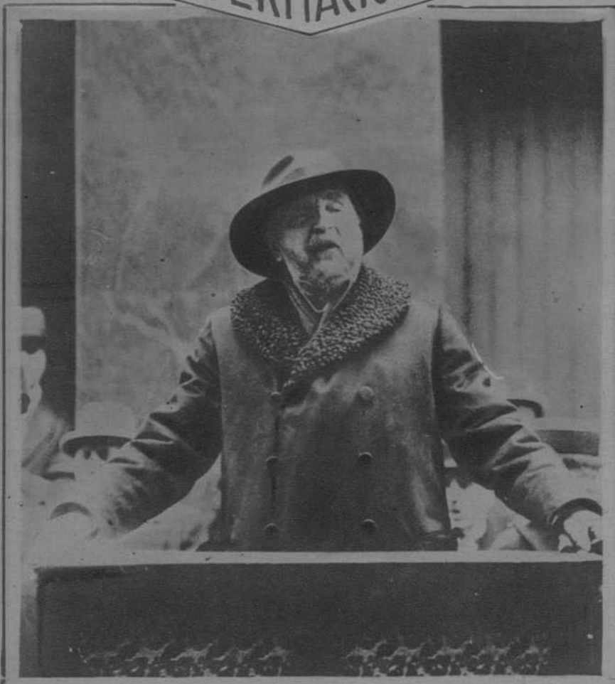
París.—Descubrimiento de una placa conmemorativa en la casa de la Rue Clauzel, donde vivió Guy de Maupassant. — Mr. J. H. Bosny, pronunciando un discurso.