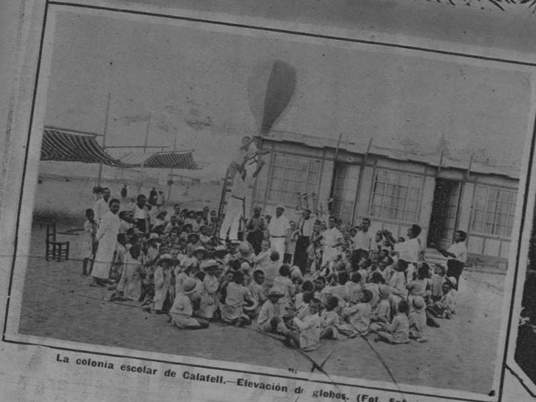
La colonia escolar de Calafell.—Elevación de globos.