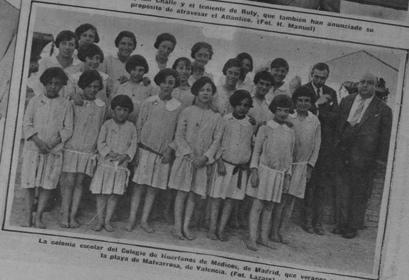
La colonia escolar del Colegio de Huérfanos de Médicos, de Madrid, que veranea en la playa de Malvarrosa, de Valencia.