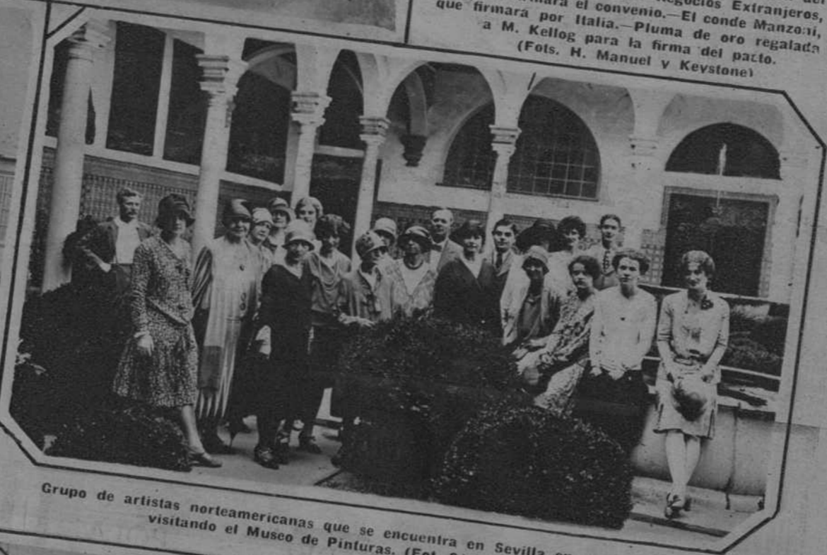
Grupo de artistas norteamericanas que se encuentra en Sevilla en viaje de estudio, visitando el Museo de Pinturas.