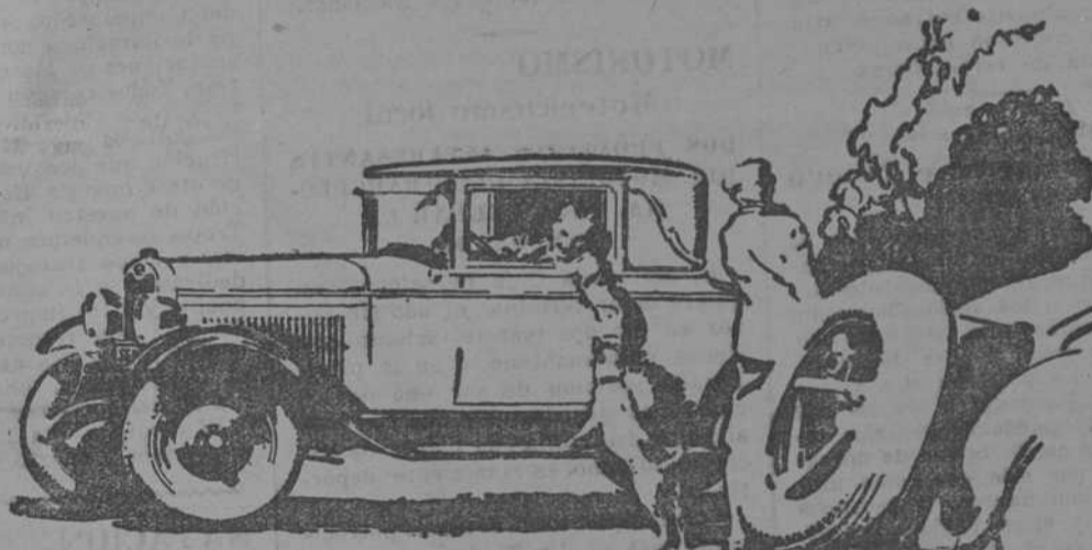
Las amplias carreterías del Chevrolet superan a cuanto pueda soñarse encontrar en un coche de este precio

Anunciarse en EL DIA GRAFICO es prosperar