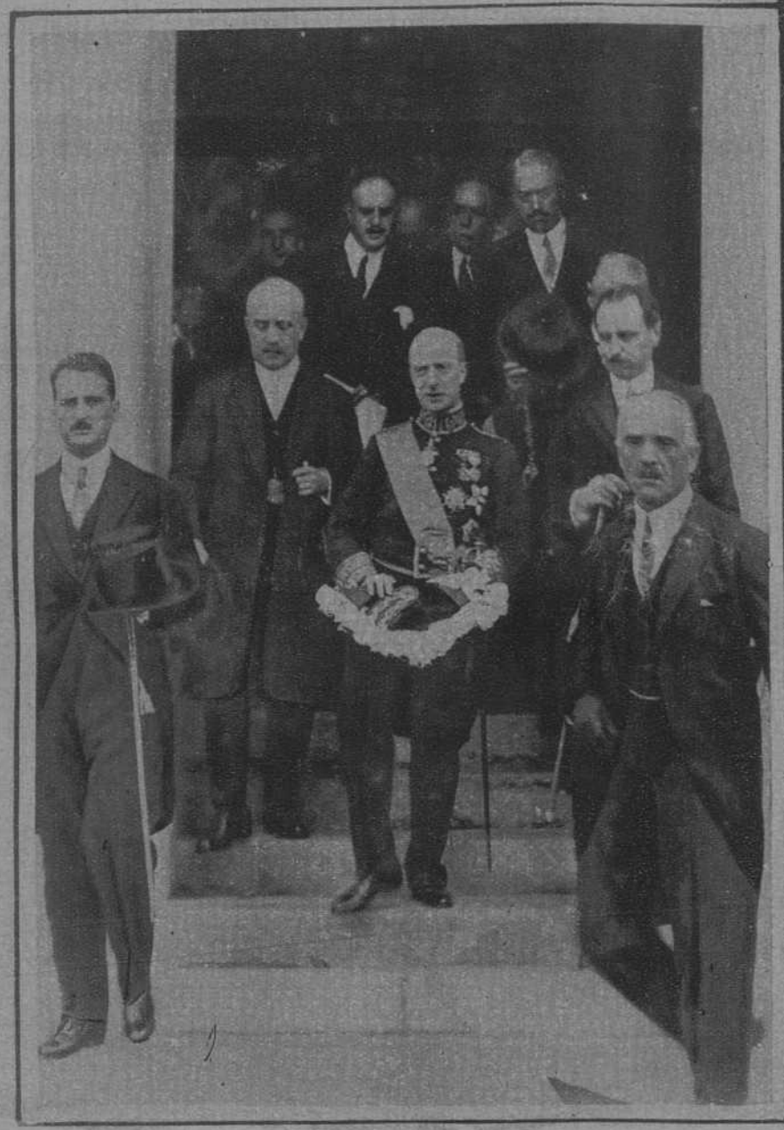
El ministro de Instrucción pública al salir del acto inaugural del nuevo edificio docente.