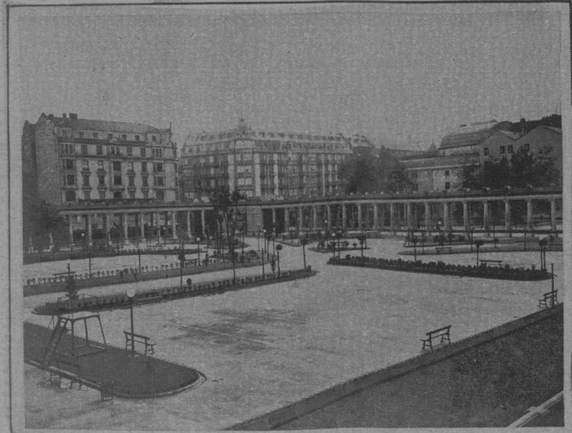
Vista del gran patio del Instituto.