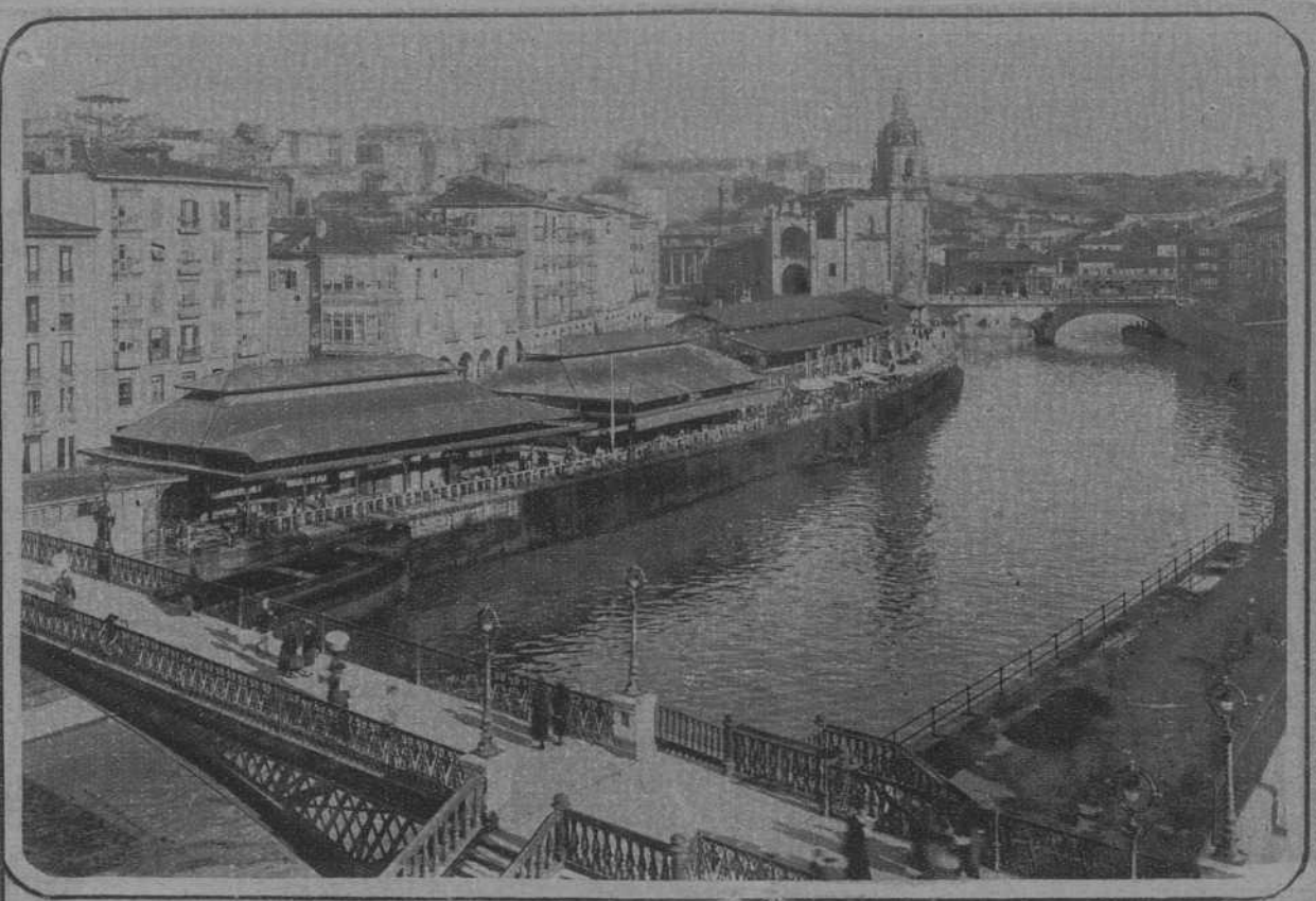
La plaza Vieja de Bilbao, que en breve será objeto de grandes reformas.