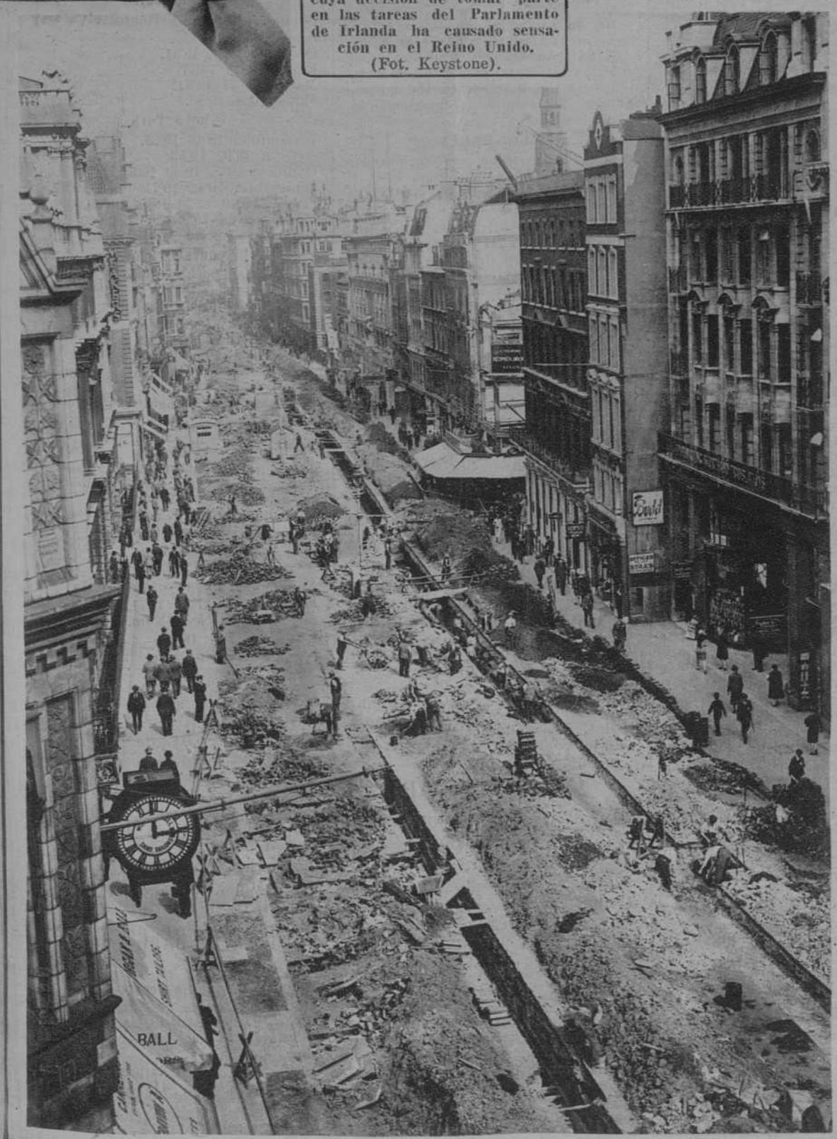
LONDRES.—Picadilly, la calle más famosa de Londres, cerrada al tránsito durante las obras de pavimentación.