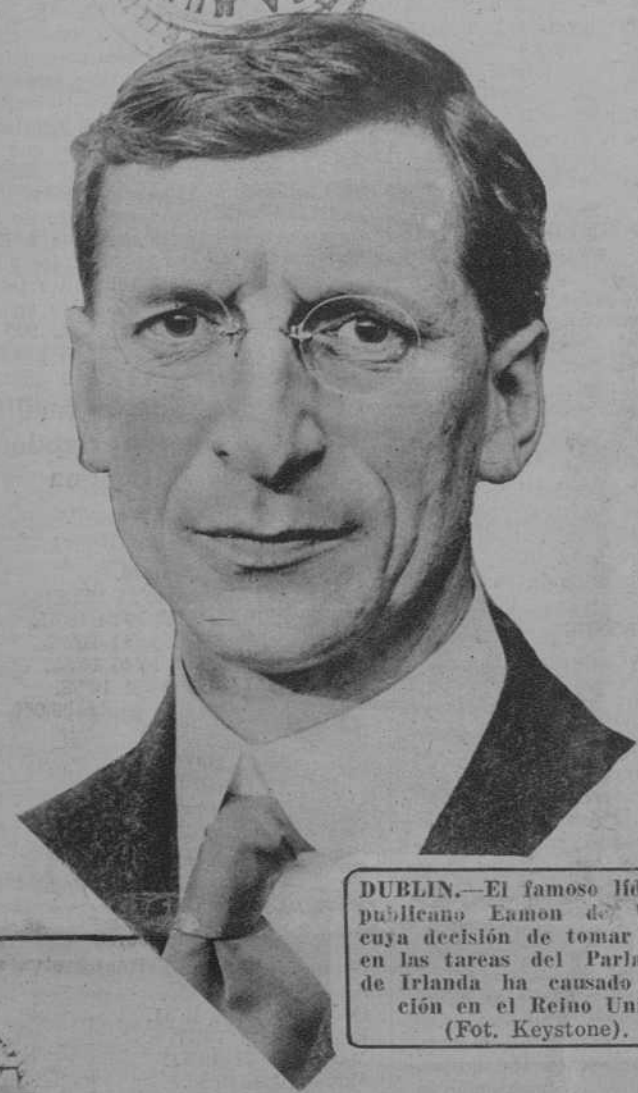
DUBLIN.—El famoso líder republicano Eamon de Valera, cuya decisión de tomar parte en las tareas del Parlamento de Irlanda ha causado sensación en el Reino Unido. (Fot. Keystone).

Barcelona, miércoles 17 de Agosto de 1927