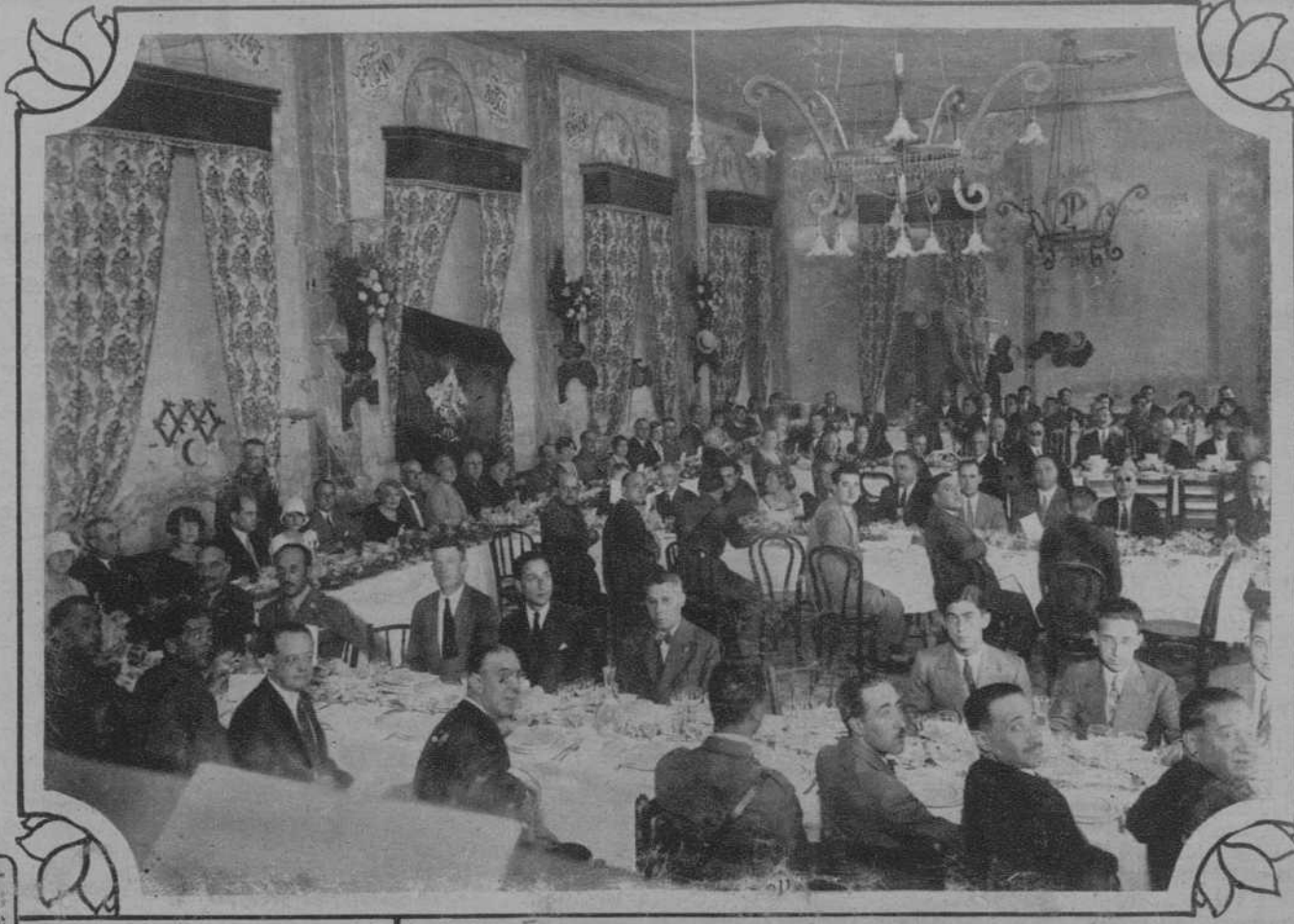
CASTELLERSOL.—Banquete en obsequio a las autoridades que asistieron a la bendición de la bandera del Somatén.