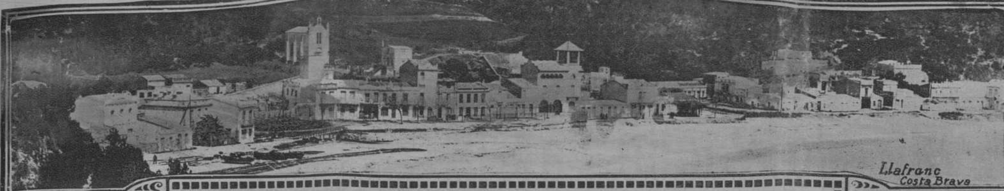
Llafranc Costa Brava

REDACCIÓN Y ADMINISTRACIÓN PLAZA DE CATALUÑA, 9 TELEFS. 2599-A Y 5051-A TALLERES E IMPRENTA MUNTANER, 49 TELÉF. 2322-A