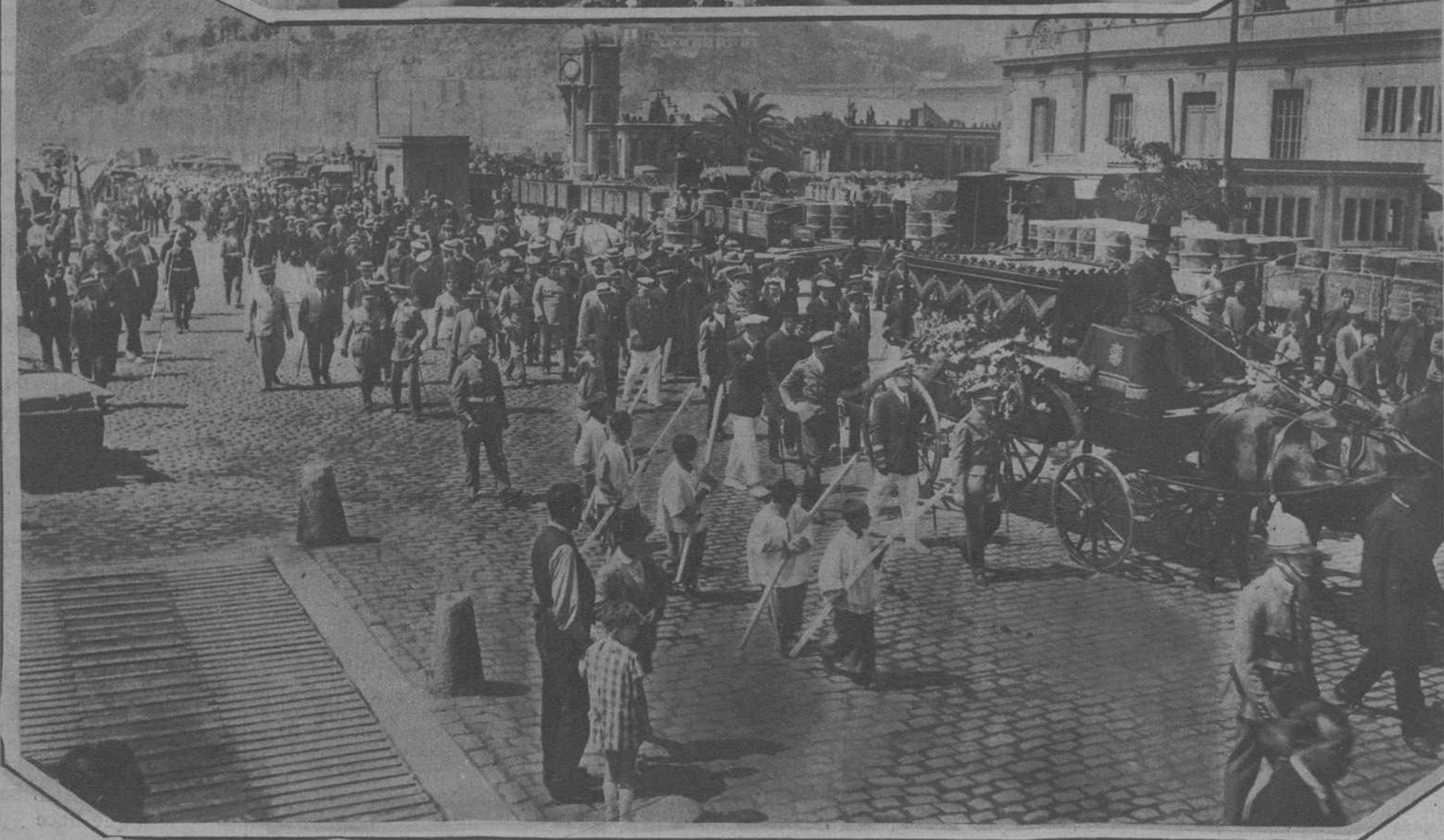
El féretro que contiene los restos del infortunado alférez que murió ante nuestro puerto a consecuencia de un accidente del avión que pilotaba, sobre el bote que lo transportó a tierra.—Un aspecto del entierro, al paso por el muelle..