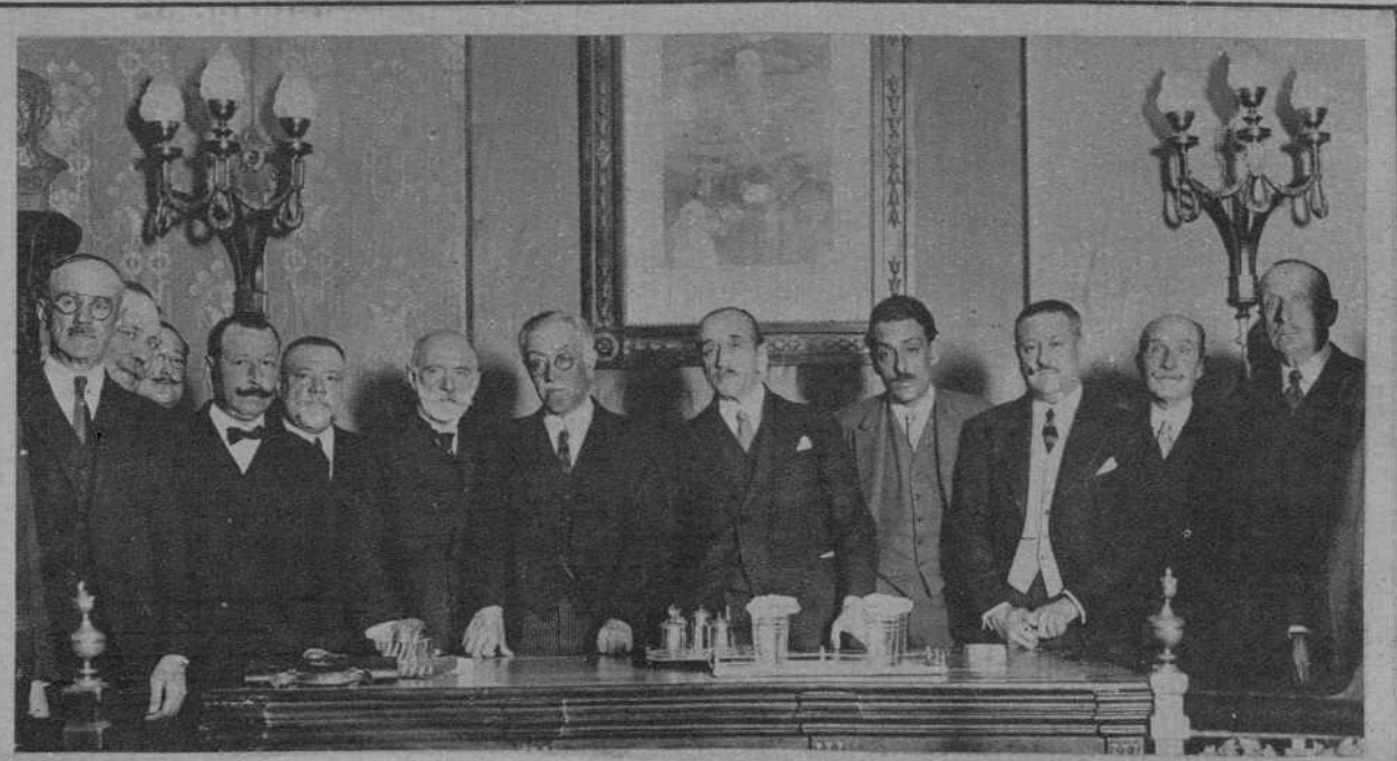
MADRID.—Inauguración de la Asamblea de subdelegados de Farmacia, bajo la presidencia del gobernador civil.