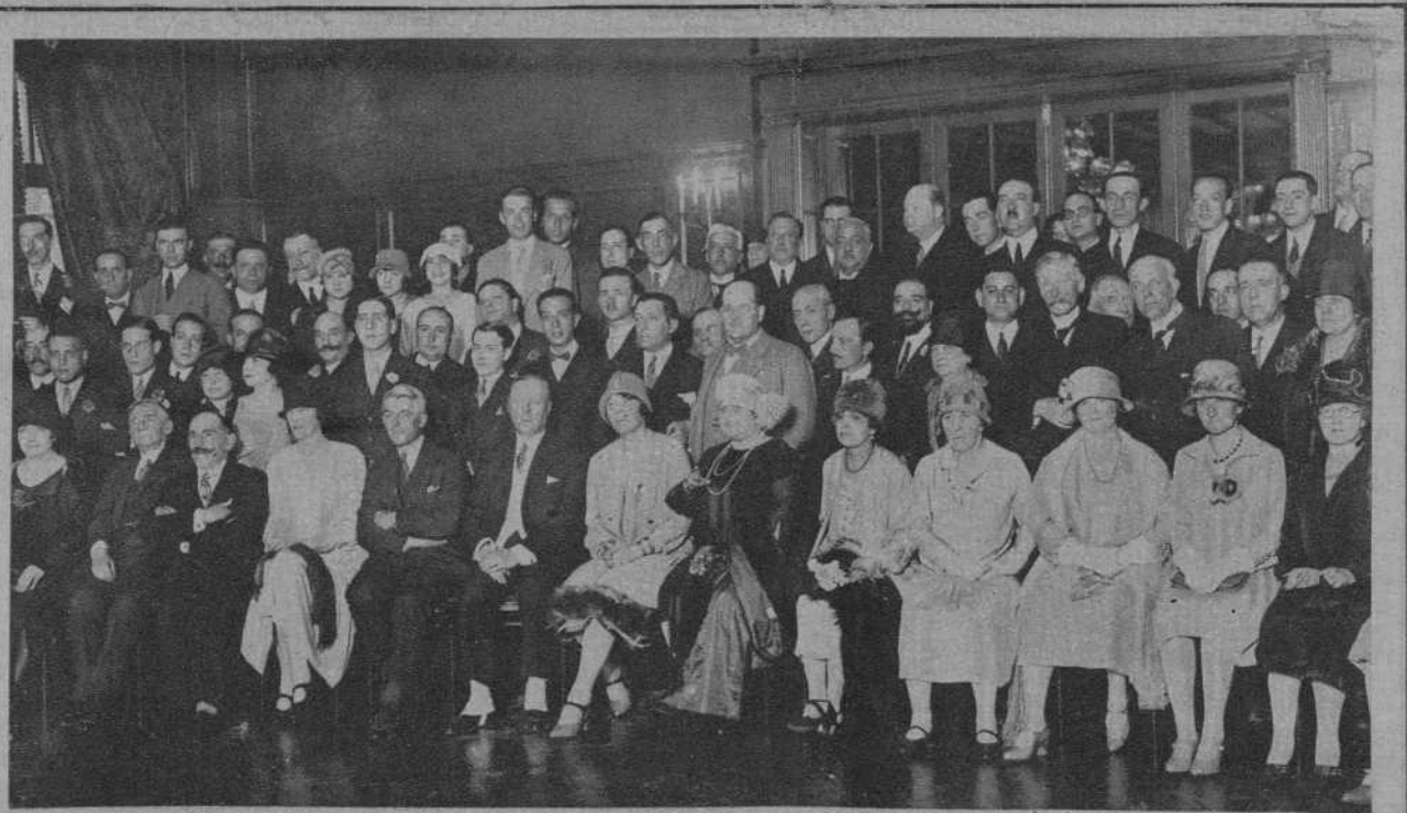
MADRID.—El Embajador de Inglaterra, Sir Horace Rumbold, rodeado de los concurrentes al te ofrecido a los médicos ingleses que se hallan en la corte.