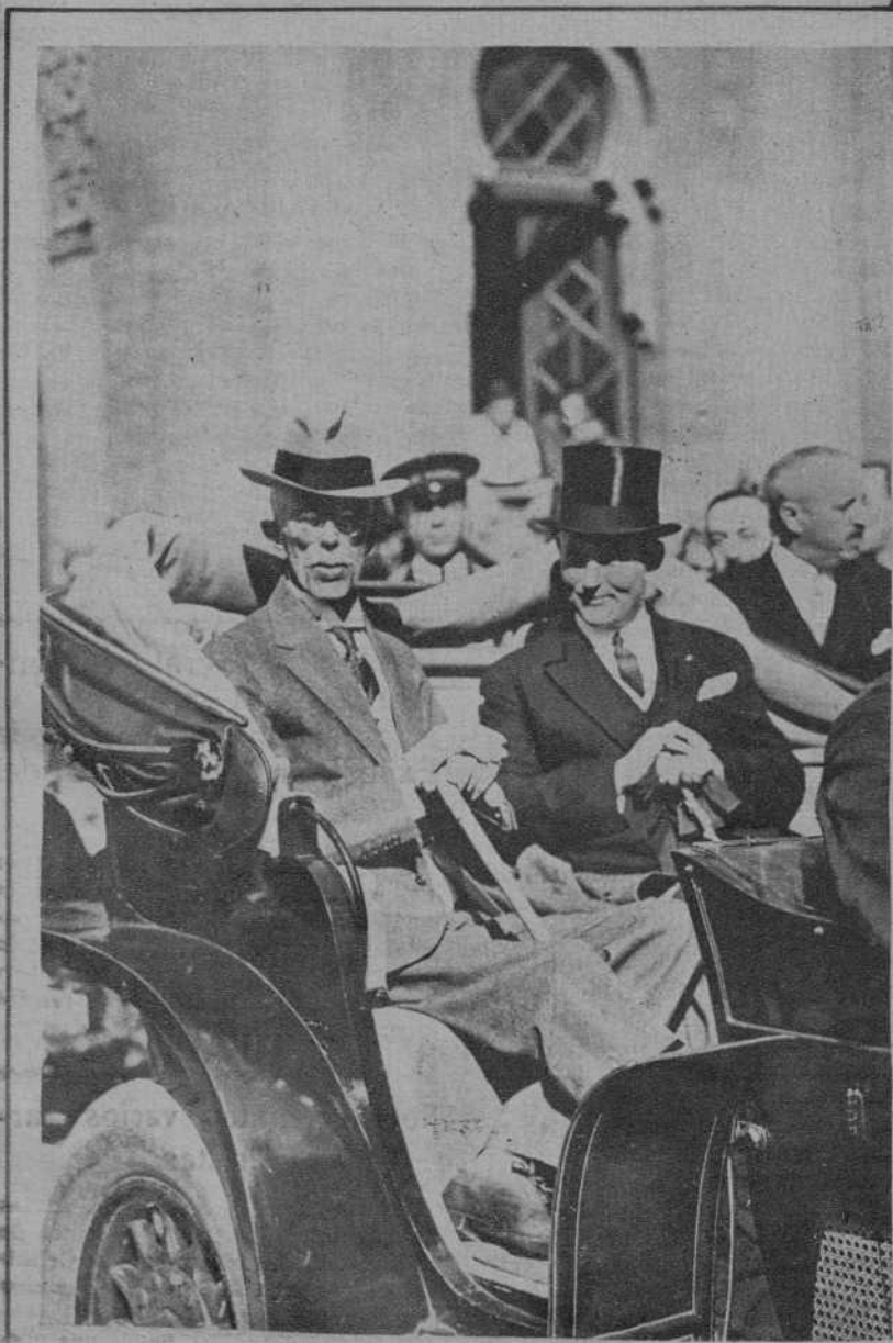
SEVILLA.—El Rey Gustavo de Suecia saliendo de la estación acompañado del alcalde. (F. Sánchez Pando).