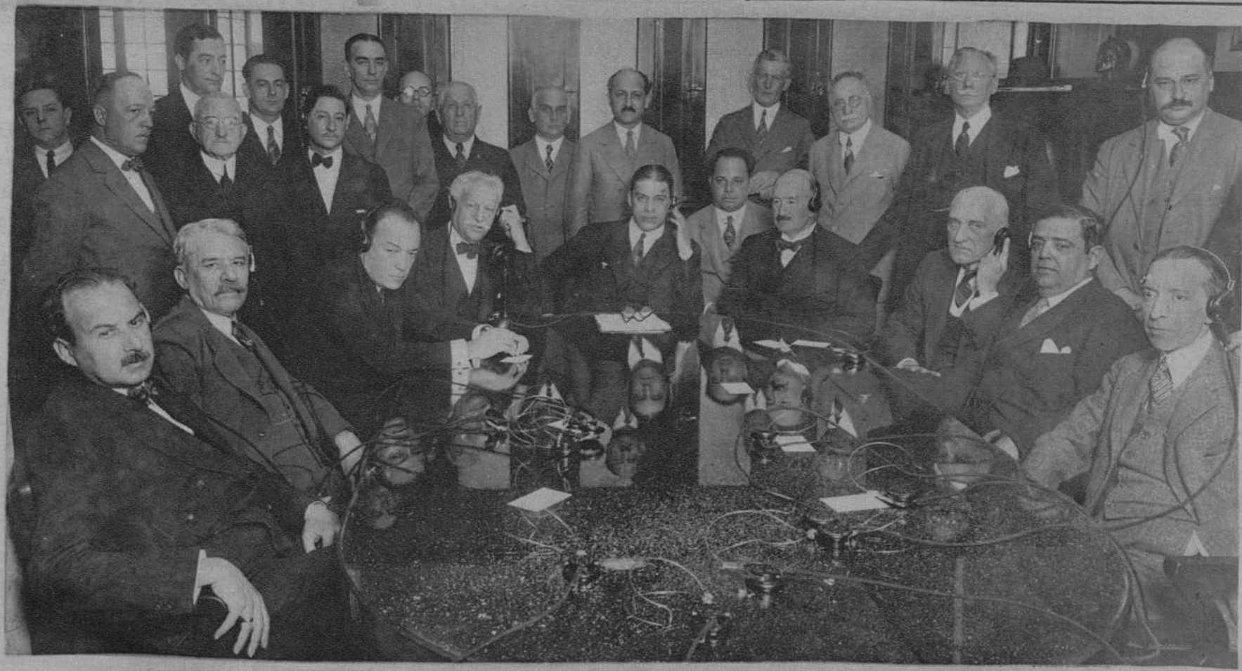
Recientemente se ha logrado sostener una conversación entre la brumosa isla británica y la soleada perla de las Antillas. La fotografía representa el momento en que el secretario de Estado de Cuba, en presencia del vicepresidente de la Cuban Telephone Company, el ministro de Inglaterra en Cuba y otras personalidades, cambia impresiones desde la Habana con su interlocutor en Londres.

La Cuban Telephone es una de las Compañías afiliadas a la International Telephone and Telegraph Corp., propietaria, con la American Telephone, de los cables submarinos que unen Cuba y los Estados Unidos, los cuales figuraron en el establecimiento de este nuevo record mundial.