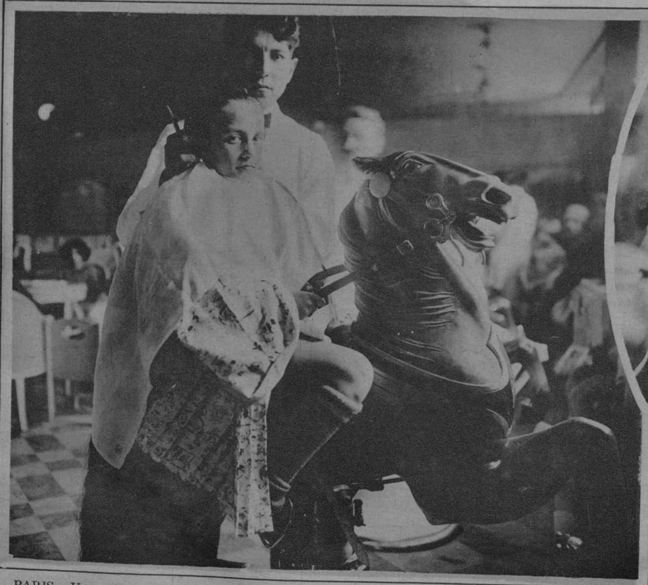
PARIS.—Un salón de peluquería, aprovechando sugerencias norteamericanas, ha instalado unos magníficos caballos que permiten a los pequeños dedicarse a la equitación y prestarse de mejor gana al trabajo del oficial barbero.