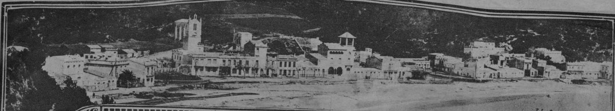
Llafranc Costa Brava

REDACCIÓN Y ADMINISTRACIÓN PLAZA DE CATALUÑA, 9 TELEFS. 2599-A Y 5051-A TALLERES E IMPRENTA MUNTANER, 49 - TELEF. 2322-A