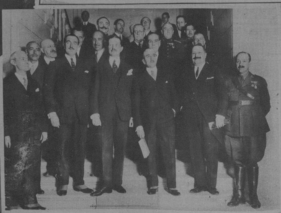
MADRID. — S. A. el Infante don Fernando, con los miembros del Comité del Palacio de América en Madrid, después de la Asamblea celebrada en la Real Academia de Jurisprudencia.