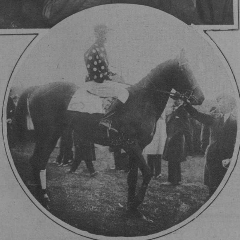
MADRID. — Inauguración de la temporada en el Hipódromo de la Castellana. «Collindres», caballo propiedad del Conde de la Cigera, ganador del Premio Retiro. (Fot. Vidal).