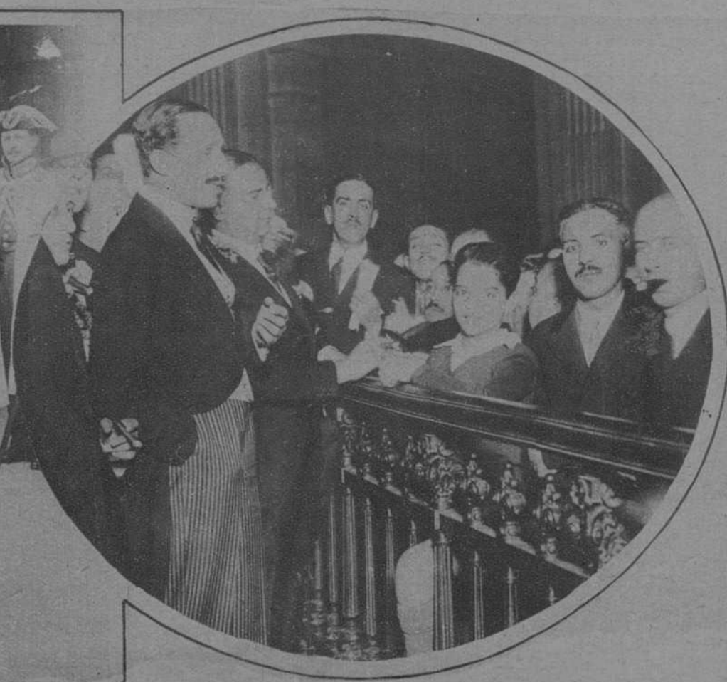
MADRID.—S. M., el Rey en la sala de operaciones de la Bolsa de Comercio, durante su reciente visita a dicha entidad.