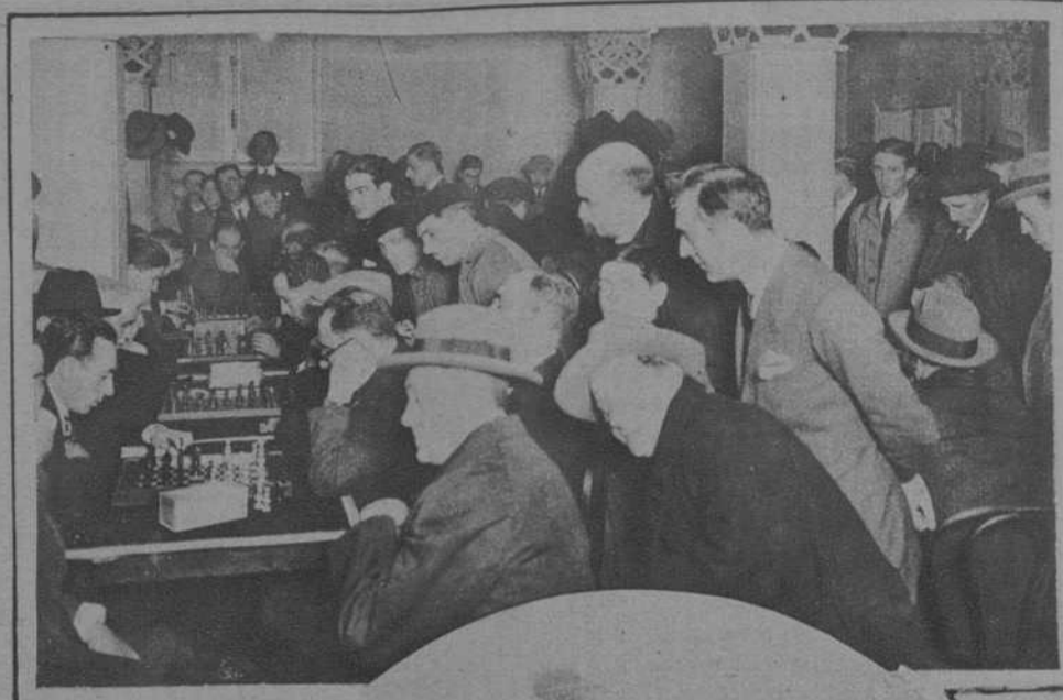
BILBAO. — Grupo de concursantes al campeonato de ajedrez que se celebra actualmente en la capital vizcaína.