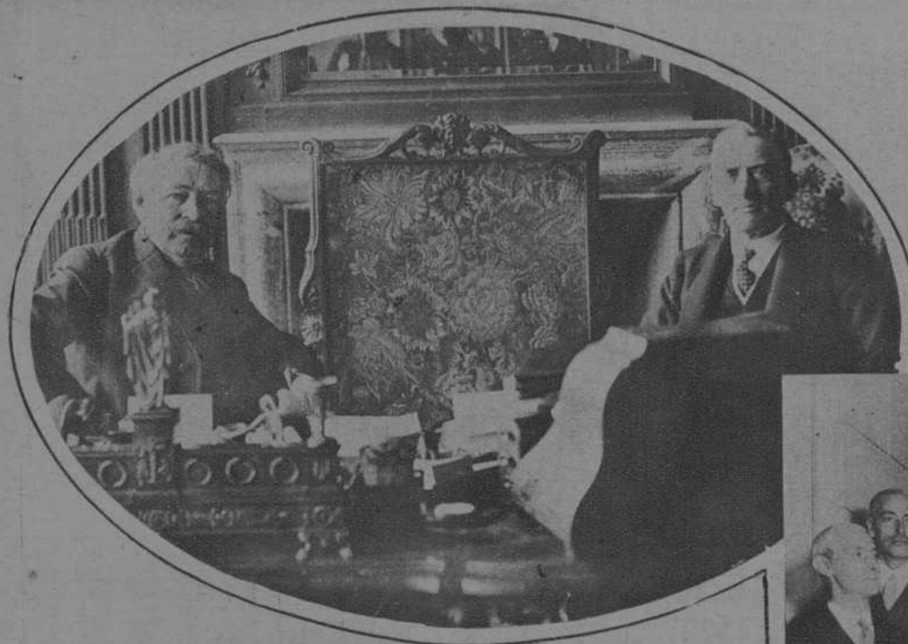
PARIS. — Briand y Chamberlain, los dos ministros de Negocios extranjeros, celebran una entrevista antes de salir juntos para Ginebra, donde se celebra la 44ª sesión de la Sociedad de las Naciones.