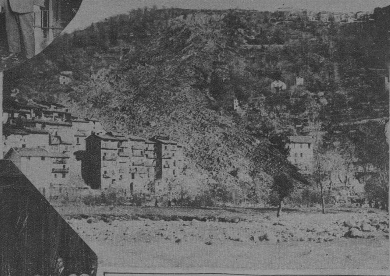
ROQUEBILIERE (Francia).—Este pueblo, que había sufrido meses atrás a consecuencia de desprendimientos de tierra de una montaña inmediata, ha quedado casi sepultado bajo una nueva avalancha. He aquí lo que queda en pie de la edificación