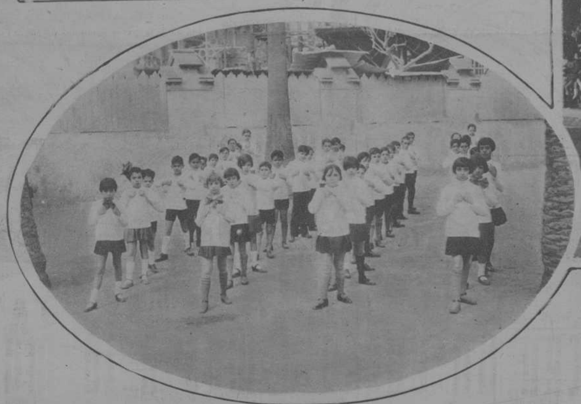
Festival gimnástico en el Liceo Garcigoy (Valencia, 24).