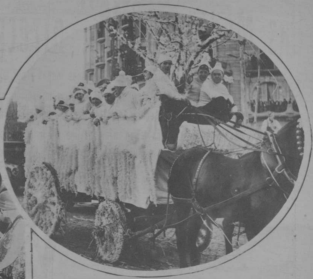
Carroza de los sports de nieve. (Fot. Badosa).