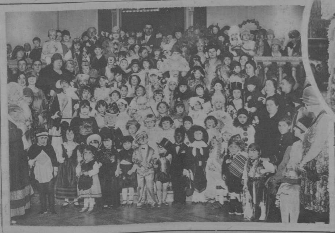
Baile infantil organizado por la Real Asociación del Árbol de Noel.