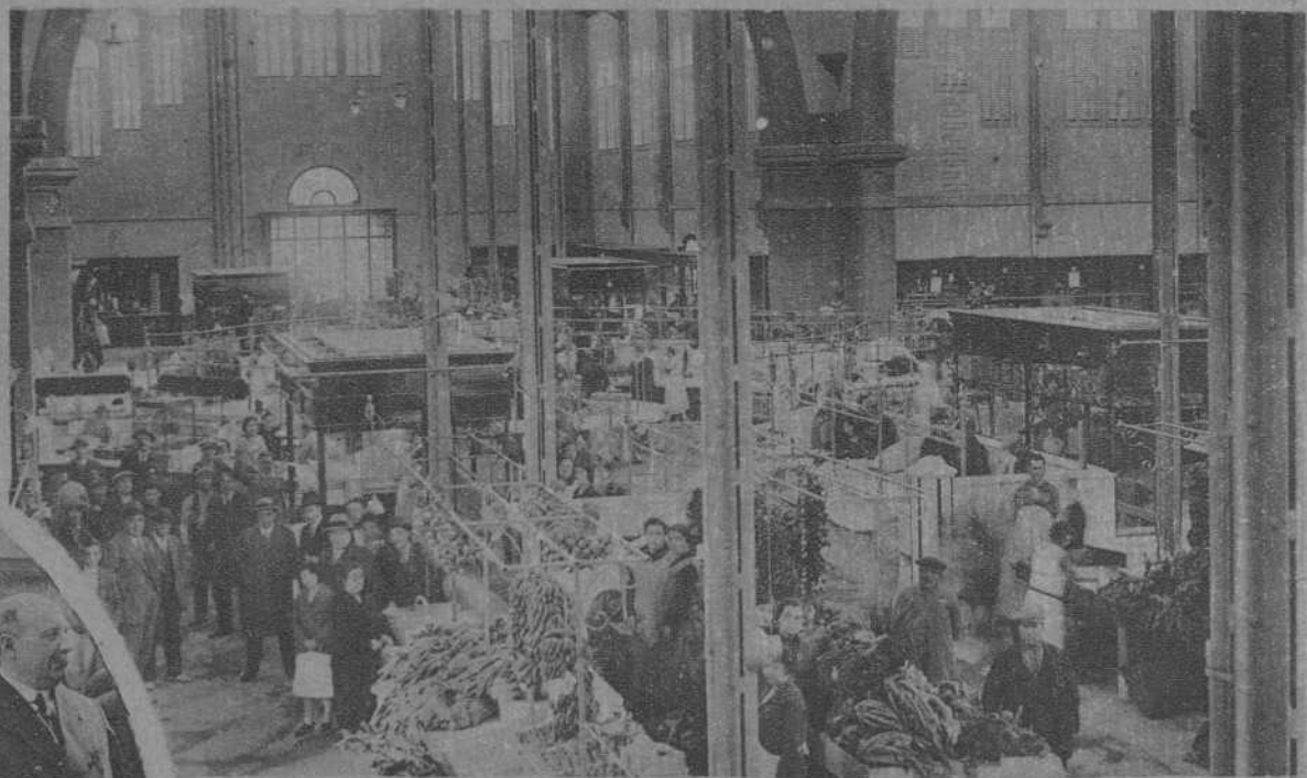
BARCELONA.—LA INAUGURACION DEL MERCADO DE GAL-BANY.—Vista del Interior del Mercado.—Acto de firmar el acta de la Inauguración.