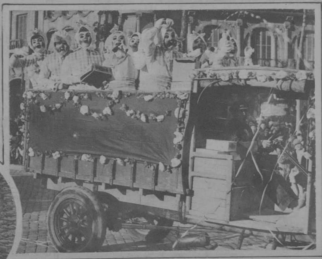
Niños Borones en un camión de transporte.