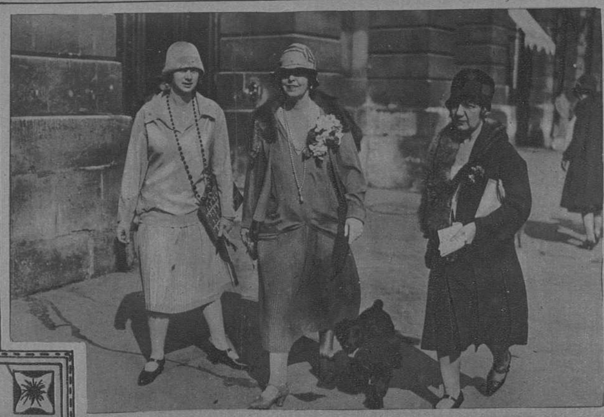
I.- Barcelona. La Fiesta del Libro. Las autoridades durante la visita a la Universidad. II.- Madrid: El regreso de la Familia Real. S.S. M.M. los Reyes al salir de la estación del Norte, a su regreso de San Sebastián. III.- Paris: La Reina de Rumania acompañada de su hija y una de sus damas de honor, pasean por la Plaza Vendôme