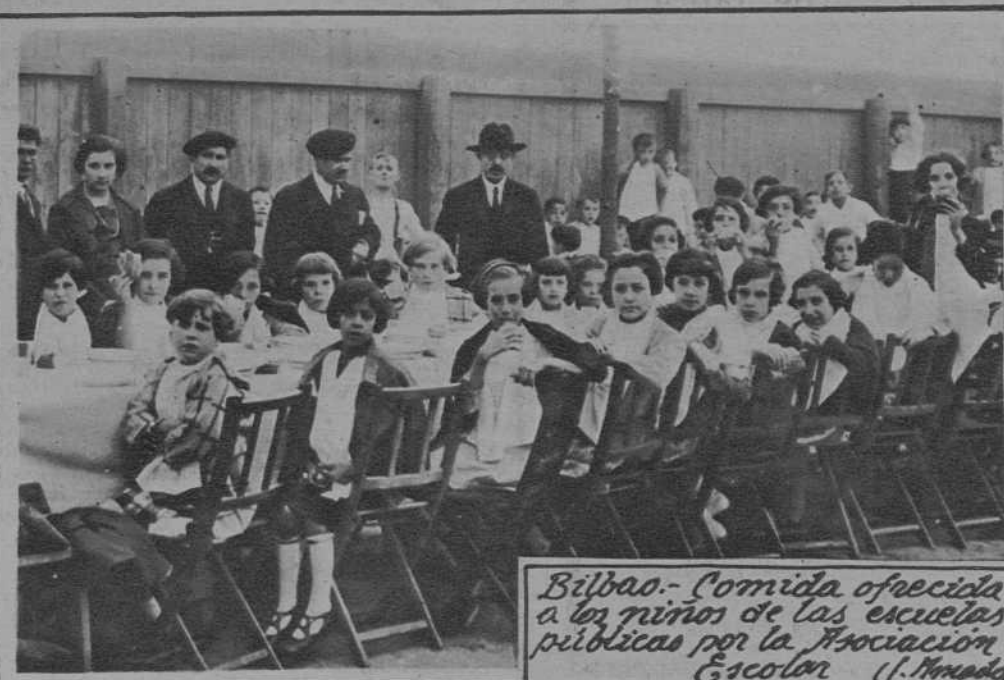
Bilbao.- Comida ofrecida a los niños de las escuelas públicas por la Asociación Escolar. (J. Miranda)