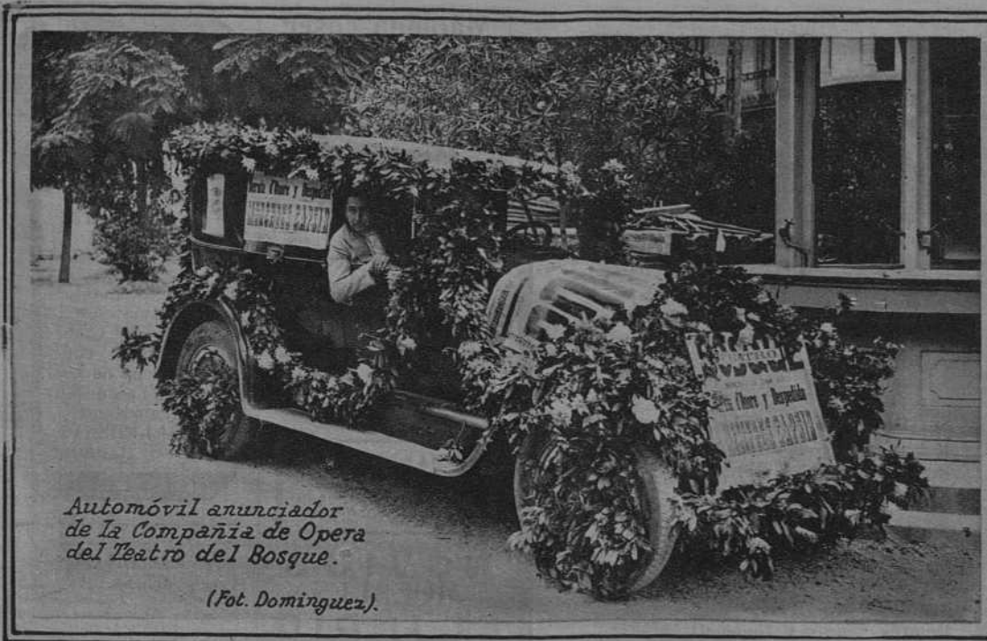
Automóvil anunciador de la Compañía de Opera del Teatro del Bosque.