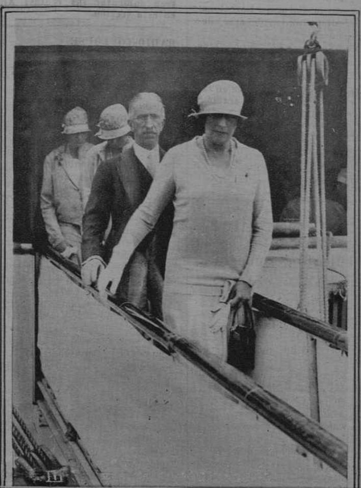
San Sebastián: De la "Fiesta de la flor" a beneficio de los sanatorios antituberculosos.-I.- S.M. el Rey, es asaltado por bellas postulantas a la salida de palacio. II.- Una señorita colocando una flor a S.M. la Reina Victoria, a la que acompañan las Infantitas doña Beatriz y doña Cristina.- III. S.M. la Reina Victoria, saliendo de visitar el trasatlántico "Manuel Arnús".