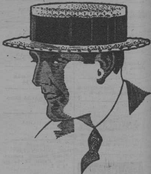
MODELO INGLÉS 1926

Sombreros de paja que regalamos al efectuar compras por valor de 25 pesetas