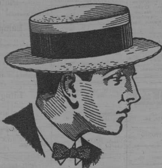
MODELO AMERICANO 1926

PIJAMAS CABALLERO PERCAL, ZEPHIR, POPELIN a ptas. 15'75, 23'50, 37'50 y 45 PIJAMAS NIÑO a ptas. 10'50, 11'75, 13'50 y 14'75