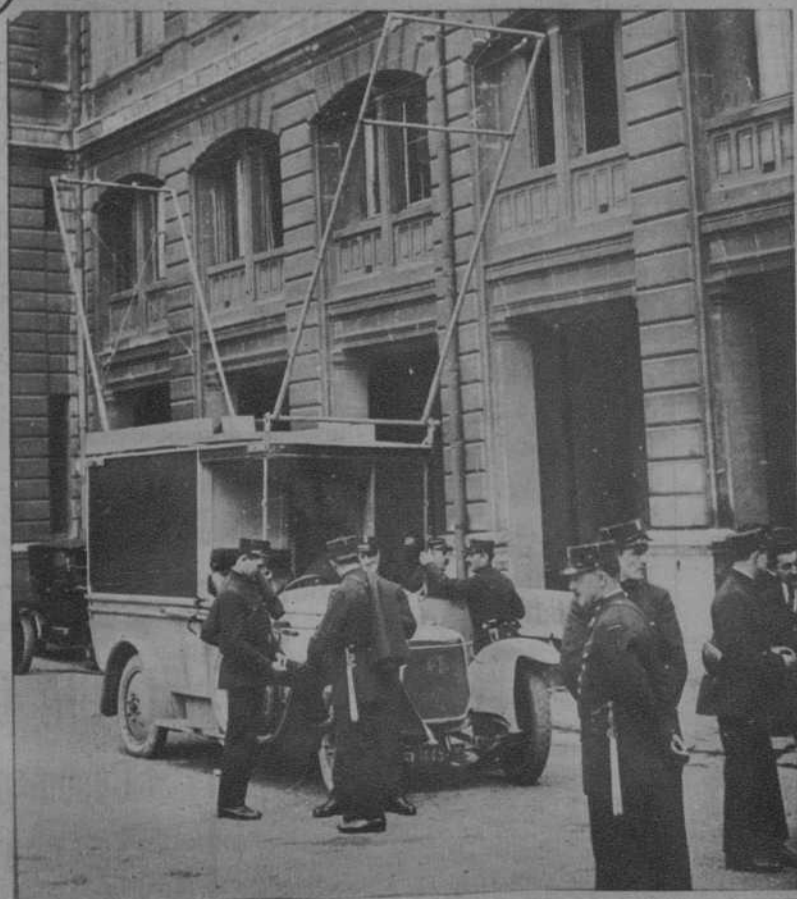
París: Automóvil, con estación receptora de T. S. H. y que, en comunicación con un aeroplano ob- servador, utiliza la policía parisina para los servicios de vigilancia. (J. Fleusine)