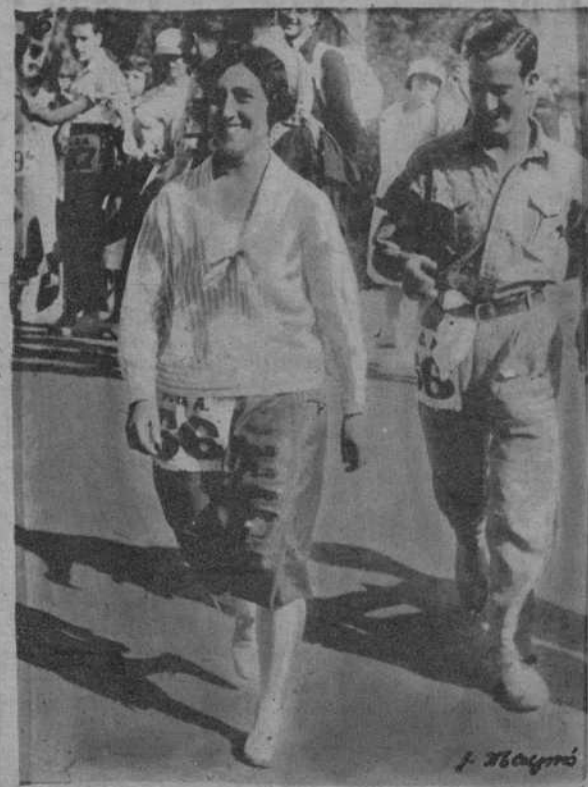
Zaragoza. El match "R. Zaragoza F.C." - "Barcelona F.C." - 1. El equipo del "Barcelona" en el terreno de Zaragoza. - 2. Un buen school de Amau. - 3. Dilatorodona despeja un corner. - Barcelona - "Español" - Iberia. - 4. Un avance españolista, interceptado por la defensa aragonesa. - 5. Un avance individual del "Español", acosado por un equipier del "Iberia". Barcelona. 6. Una de las parejas mixtas que tomaron parte en la "Carrera por Montaña".