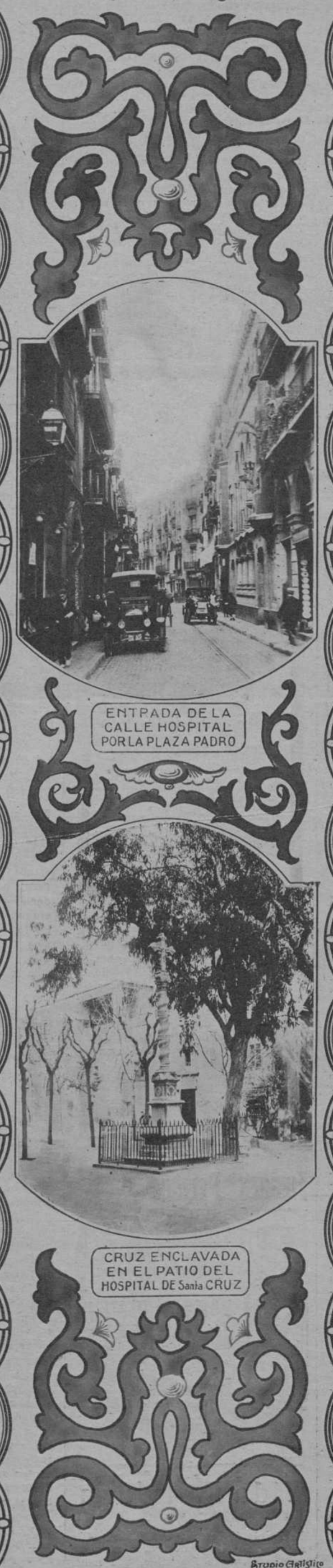
ENTRADA DE LA CALLE HOSPITAL POR LA PLAZA PADRO