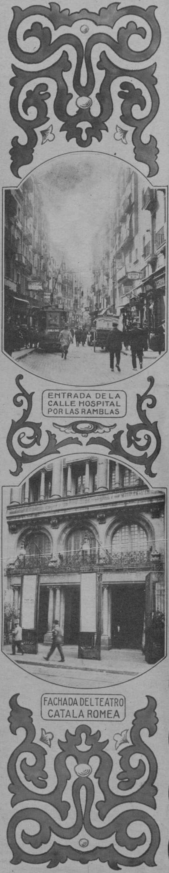
ENTRADA DE LA CALLE HOSPITAL POR LAS RAMBLAS