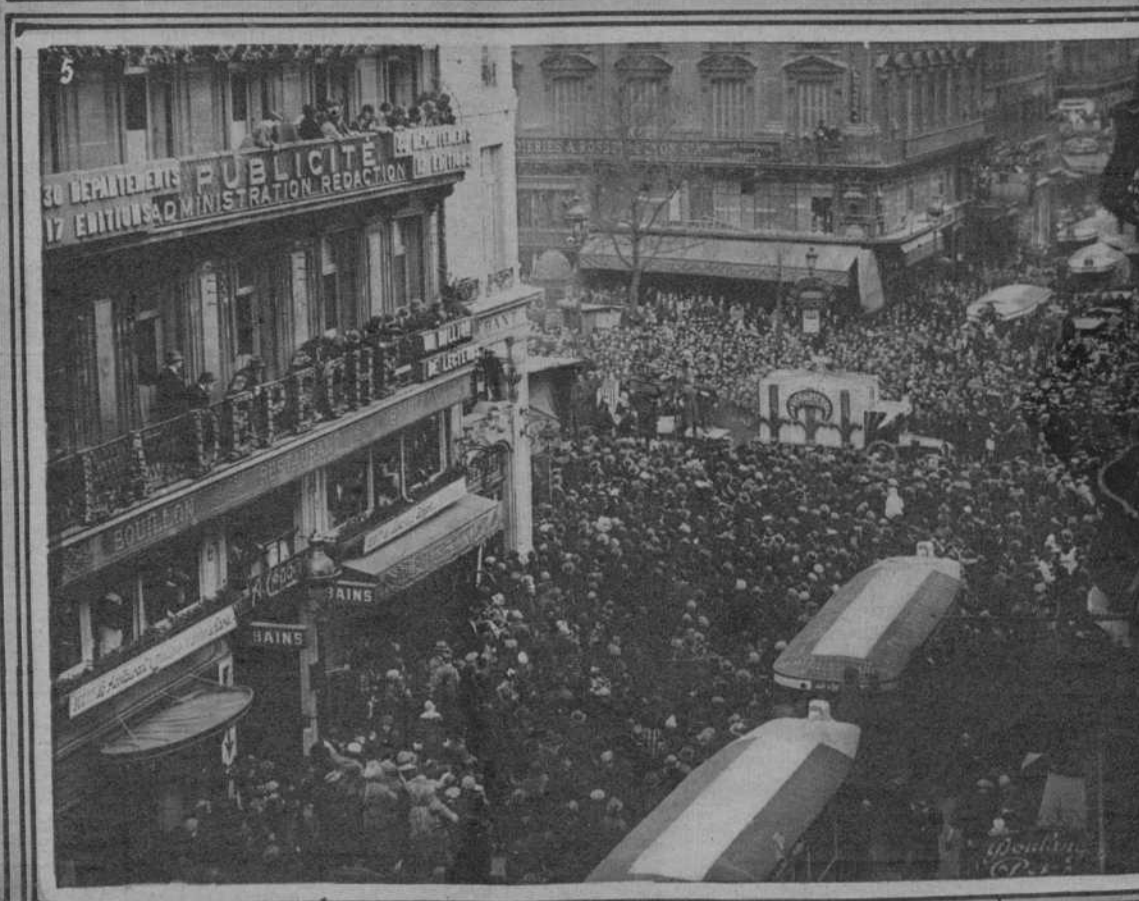
La Asamblea de Ginebra. - 1: Los señores Benes, Husky y su secretario. - 2: El señor Dimitchich. (f. H. Manust). - 3: La fiesta de "Nô Careme" en Paris. - 4: La Reina de las Reinas y sus damas de honor. - 5: Un aspecto del boulevard Montmartre durante el desfile de carrosas (f. Meunier)