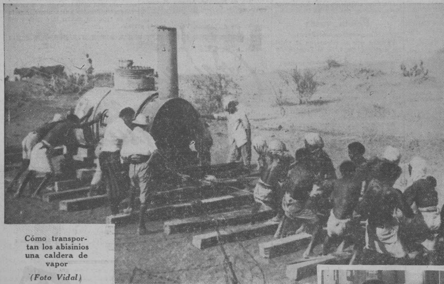
Cómo transportan los abisinios una caldera de vapor