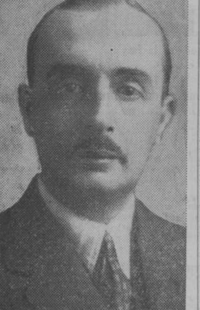
Madrid, ha sido nombrado por el señor Hitler embajador de Alemania en París.