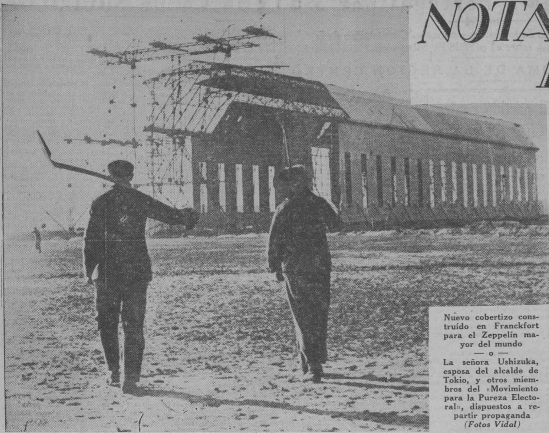
Nuevo cobertizo construido en Franckfort para el Zeppelin mayor del mundo