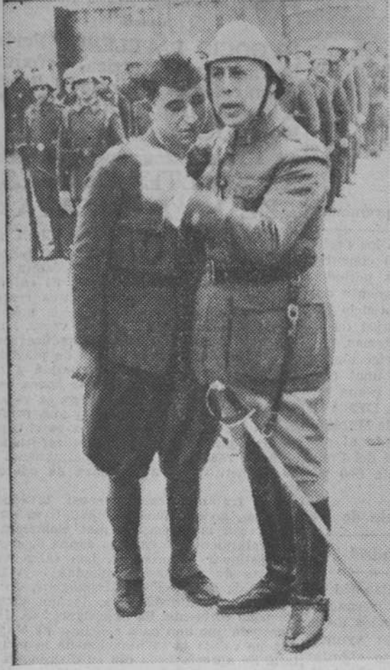
El teniente coronel abraza a un soldado en la fiesta de «Despedida del soldado», celebrada en Salamanca