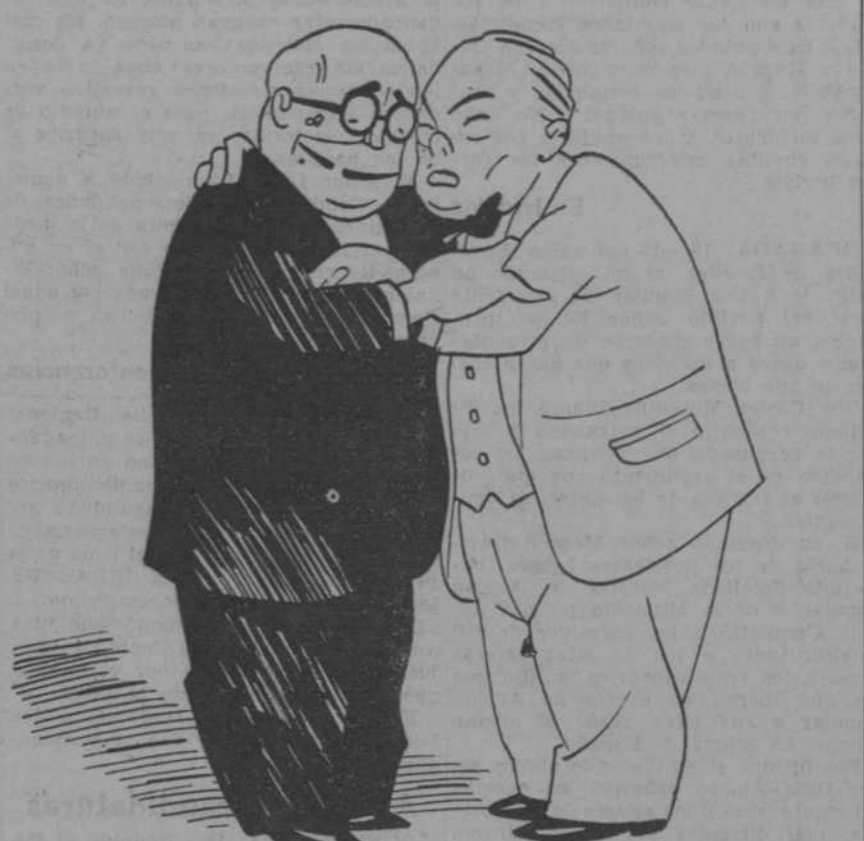
—Ahora, Dieguito, voy a ver si tomo el sudexpreso. —Y yo a ver si pisco el Gran Oriente Expres.