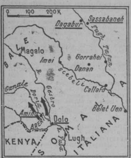
LA OFENSIVA ITALIANA EN EL VALLE DE GANALE DORIA. El ataque de Graziani ha puesto en derrota al ras Desta, causándole mil bajas. La profundidad del avance ha sido de setenta kilómetros

Aunque no sea prolijo, ni mucho menos, el relato que hace el telégrafo de la ofensiva de Graziani, frente al Desta, hay, sin embargo, datos suficientes para poder reconstruir, en sus líneas generales, la operación, que ha tenido, como ayer decíamos, sus jalones iniciales en la exploración del sultán Olo Dinle y en la ocupación de Amino y Areri.