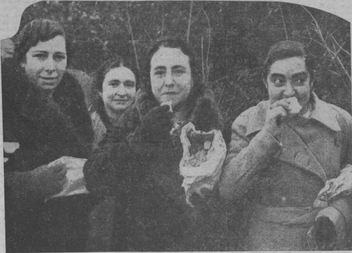
Para poder recoger su documentación, los opositores a Auxiliares de la Dirección de Seguridad que se retiran, forman larguísimas filas. Muchos como se ve—se llevan la comida