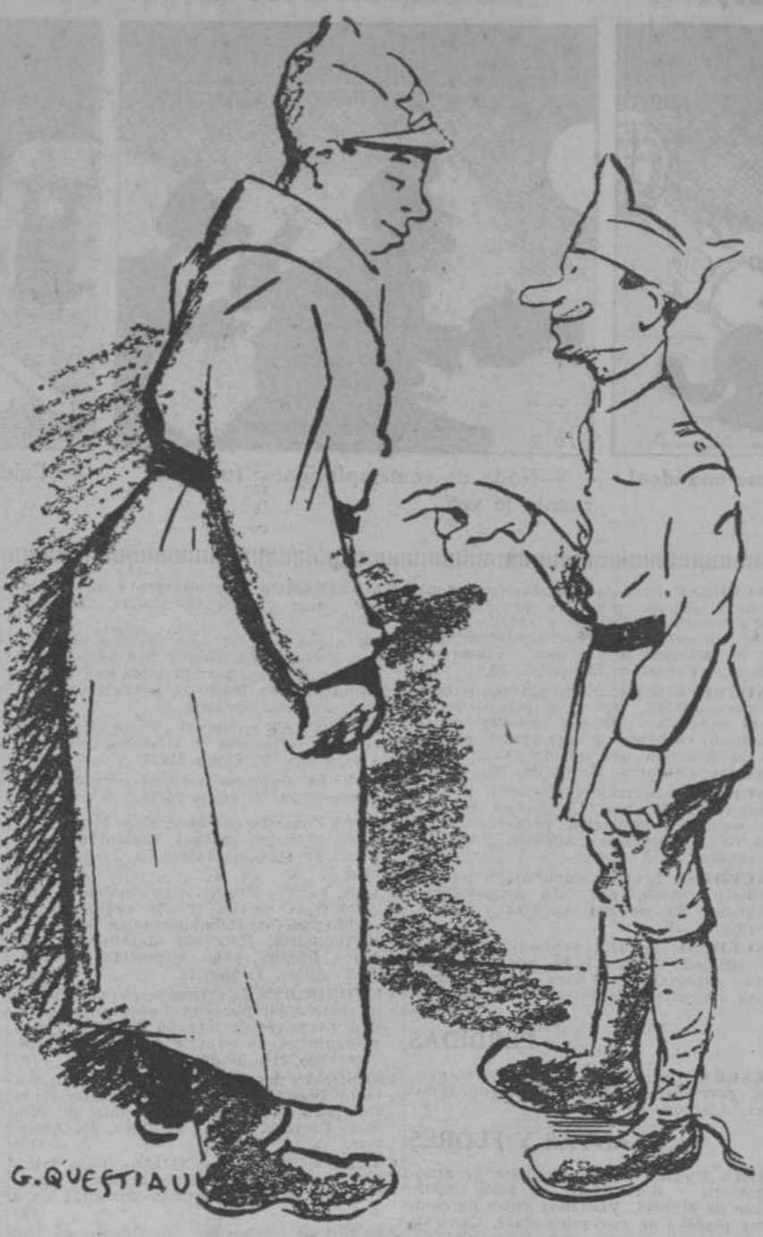
—En Francia no olvidamos a los amigos; todavía se habla de la apisonadora rusa. —En Rusia también se habla del ahorro francés apisonado. ("Le Rire", París.)

El combate se desarrolló en un terreno que presentaba gran dificultad para la acción, sembrado de matorrales. La Aviación persiguió a los soldados etiopes, dirigiendo sobre ellos el tiro de sus ametralladoras y lanza torpedos ligeros.