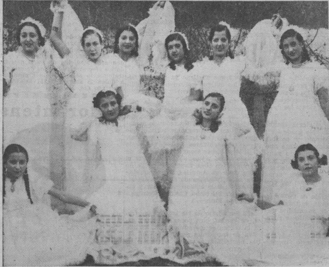
Bellas jóvenes de Calzada de Calatrava que tomaron parte en un festival artístico a beneficio de los niños pobres de la Catequesis de aquella localidad