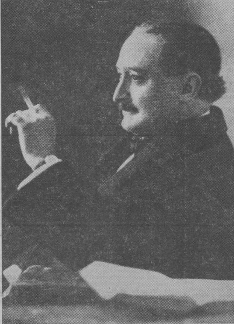
El notable y popular escritor aragonés don Gregorio García Arista, que ha sido nombrado socio de honor del Ateneo de Zaragoza