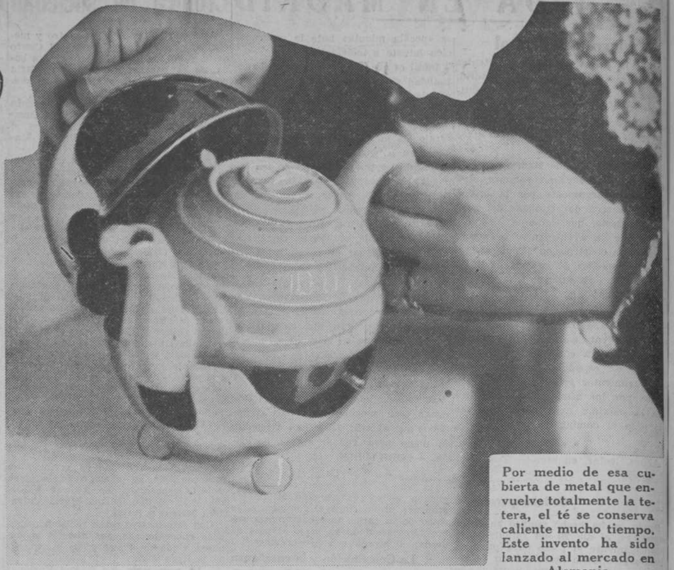
Por medio de esa cubierta de metal que envuelve totalmente la tetera, el té se conserva caliente mucho tiempo. Este invento ha sido lanzado al mercado en Alemania