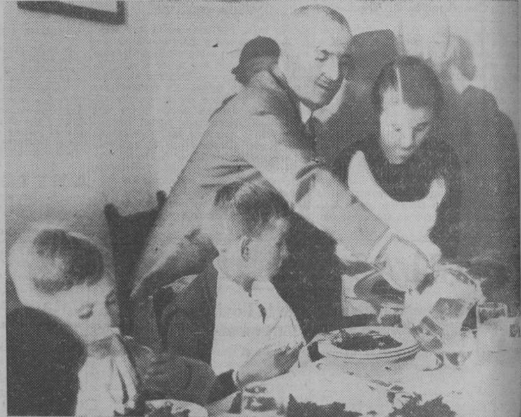
Los huérfanos de la revolución asturiana que inauguraron el colegio Don Gonzalo, durante la comida con que fueron obsequiados ayer en Renovación Española