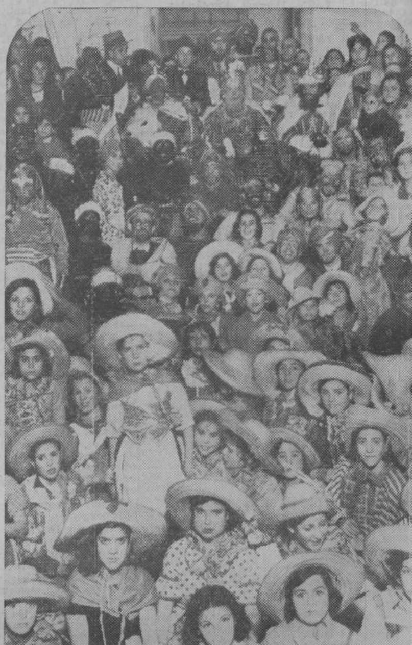
Los Reyes Magos del Centro Artístico de Granada, en el Hospicio Provincial de Armilla