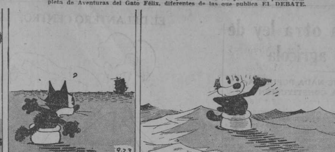
—Me parece que no voy a alcanzar al barco.