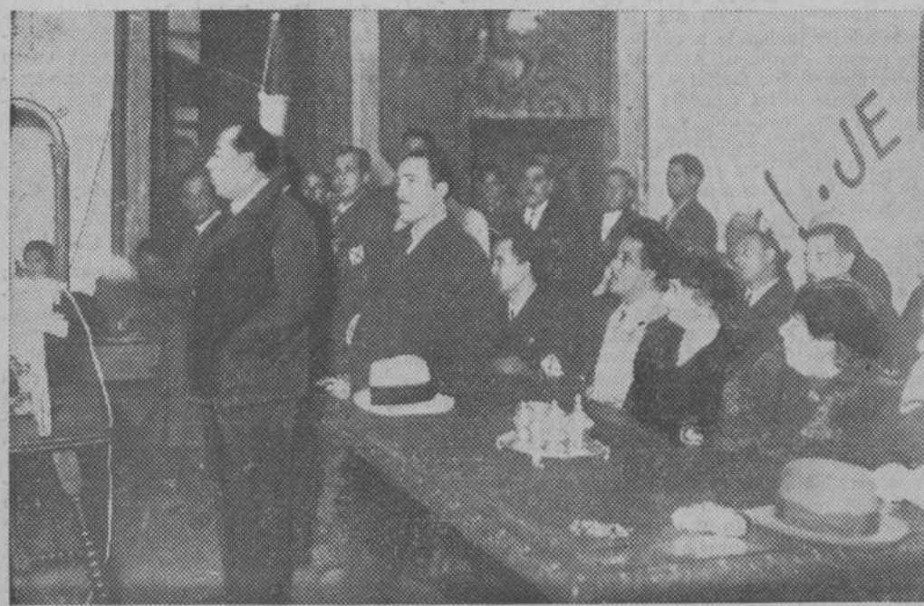
El señor Gil Robles en un momento del discurso que pronunció en medio de gran entusiasmo en el teatro Principal de Orense