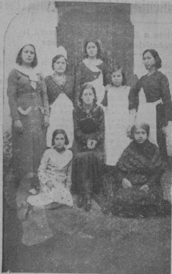
Señoritas de Casas de Fernando Alonso (Cuenca), que tomaron parte en las veladas teatrales a beneficio de la Catequesis