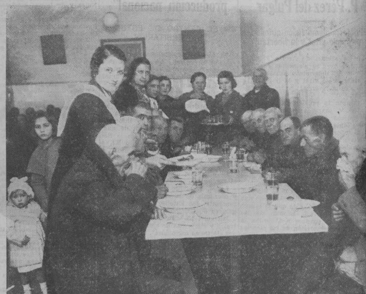
Bellísimas señoritas de Córdoba, sirviendo una comida a las ancianas de la capital durante las últimas fiestas