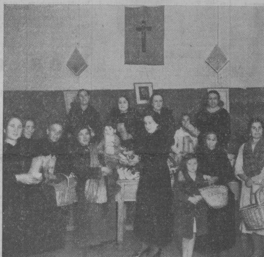
Señoras del Comité Femenino de Acción Popular de Toledo, durante el reparto de comidas a los necesitados