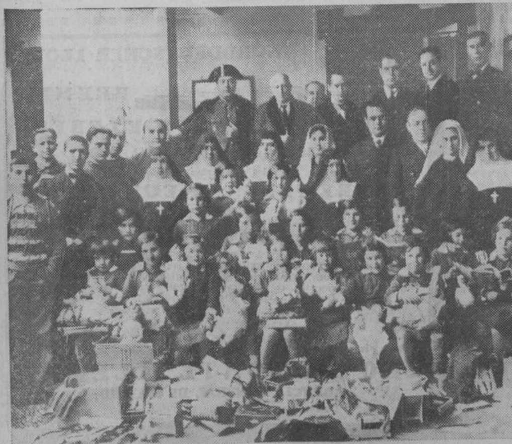
El ex ministro, señor Lucía, en el reparto de juguetes hecho por Derecha Valenciana