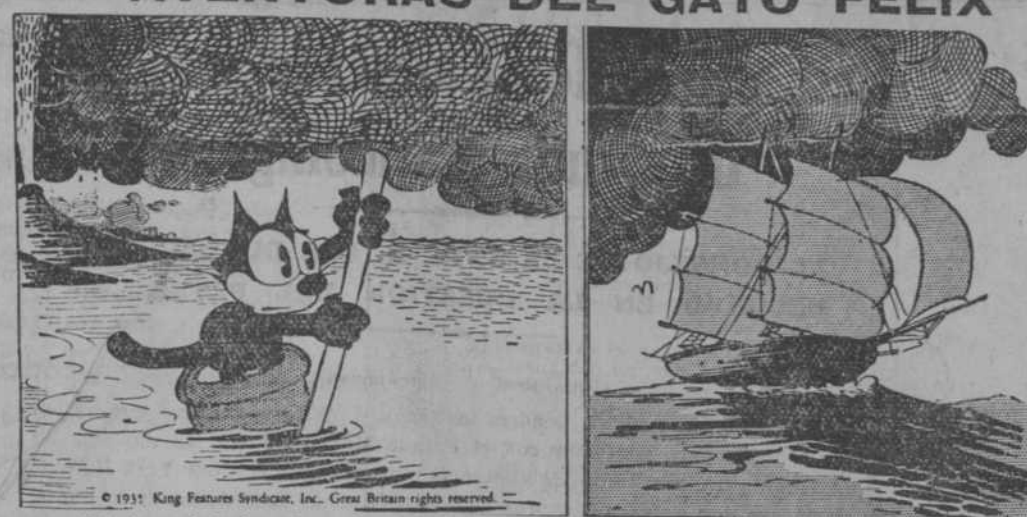
—Me han dejado plantado.