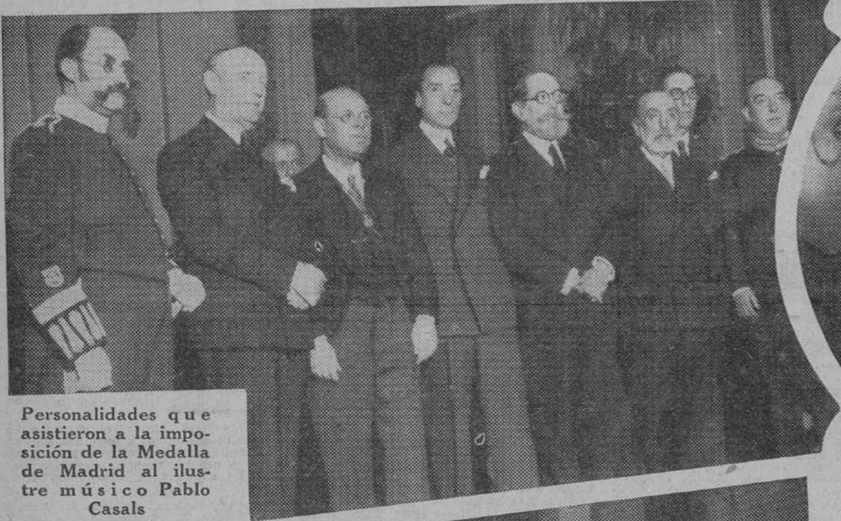
Personalidades que asistieron a la imposición de la Medalla de Madrid al ilustre músico Pablo Casals