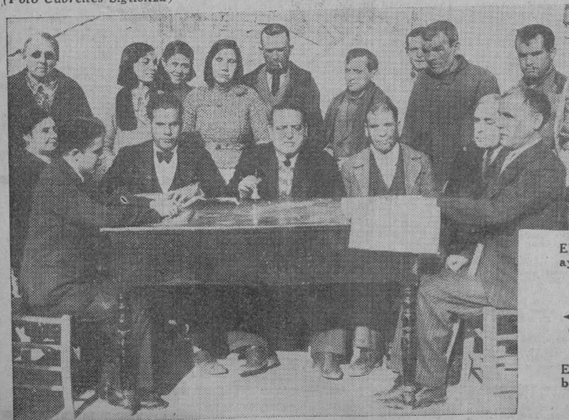
El nuevo ministro de Rumania, señor Floresco, que ayer presentó sus cartas credenciales al Jefe del Estado