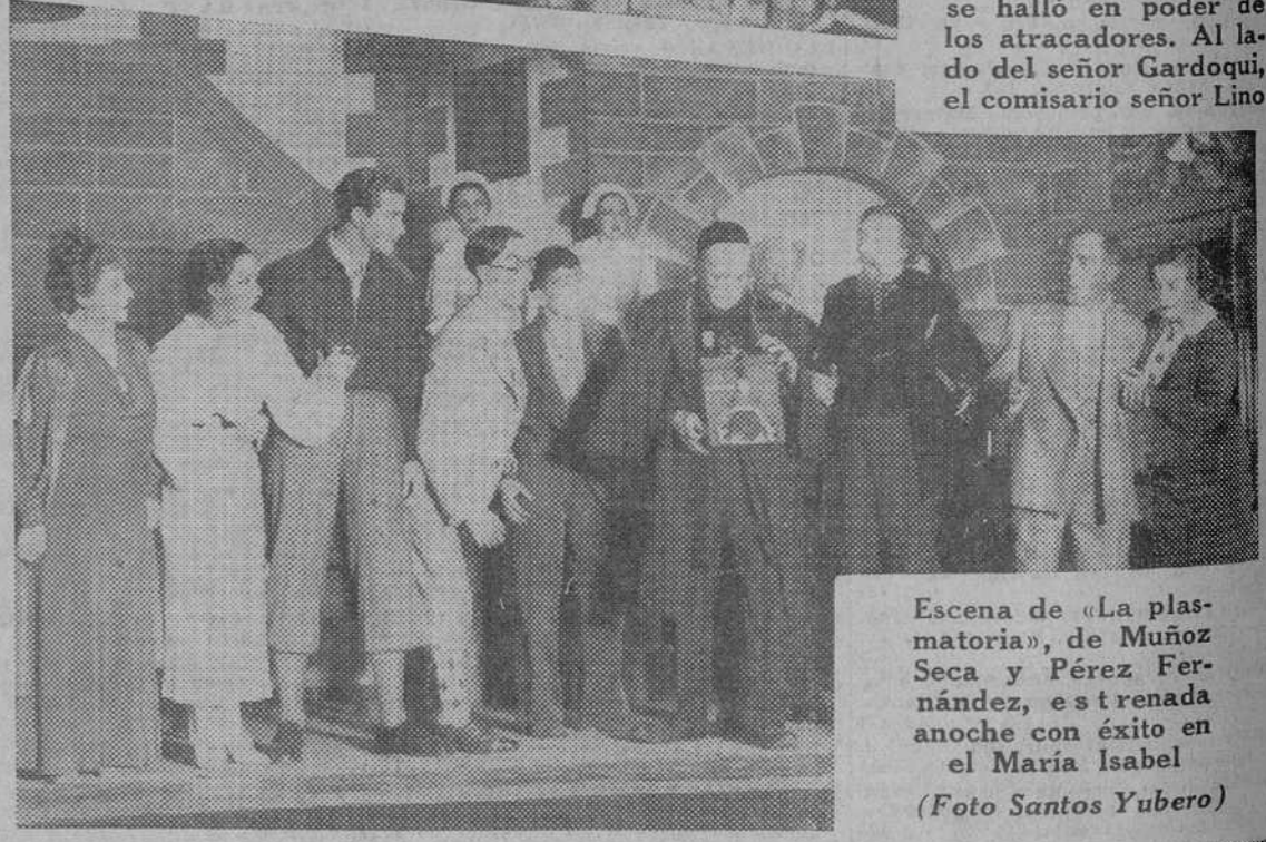
Escena de «La plasmatoria», de Muñoz Seca y Pérez Fernández, estrenada anoche con éxito en el María Isabel