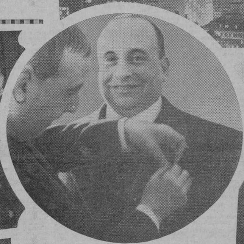
El notable periodista señor Ortega Lison, en el momento de serle impuesta la insignia de Caballero de la Corona de Italia, en la Embajada italiana