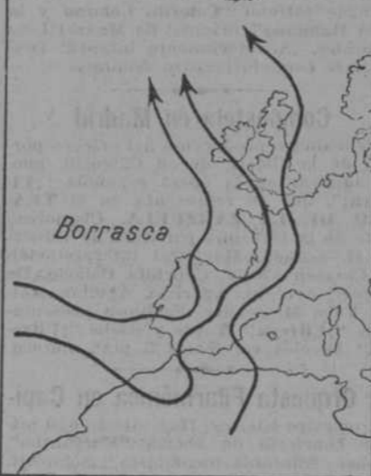
La borrasca del Atlántico se nos metió en casa y nos trae lluvias generales.

Las nubes que nos han entornado el cielo han acabado casi con las heladas en Castilla la Vieja. Sólo bajó la noche pasada el termómetro a menos de cero grados en Soria y Teruel. ¿Dónde