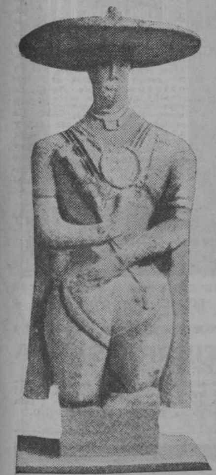
El extraño guerrero de Capestrano, encontrado cerca de Aquila (Italia)

En estos días ha ingresado en el Museo de las Termas de Roma una extraña escultura encontrada recientemente cerca de Capestrano (región de