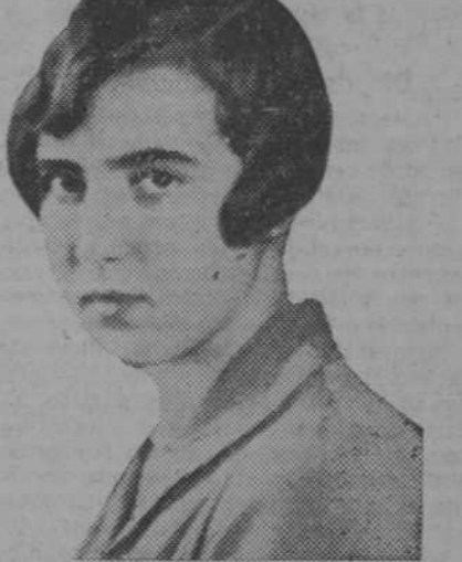
Princesa Ingrid de Suecia

STOCKOLMO, 15.—Tanto en ésta como en Copenhague, hoy se ha anunciado oficialmente el compromiso de matrimonio de la princesa Ingrid con el príncipe Federico, heredero de la corona de Dinamarca. No se ha dicho nada acerca de la fecha en que se celebrará la boda. El príncipe Federico llegó esta ma-