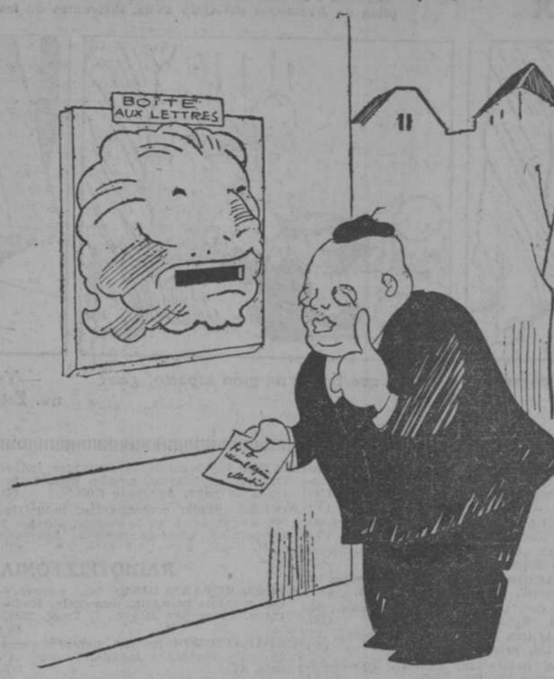
—¡Quiá! Ya cuido yo de no pillarme los dedos.