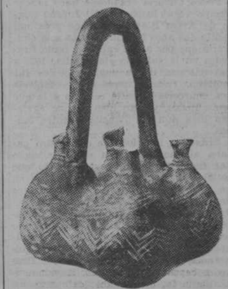
Uno de los objetos votivos hallados en la necrópolis de Vounous

Las excavaciones emprendidas en Vounous—al Norte de la isla de Chipre—bajo la dirección de M. Claude F. A. Schaeffer, representante del Louvre, en