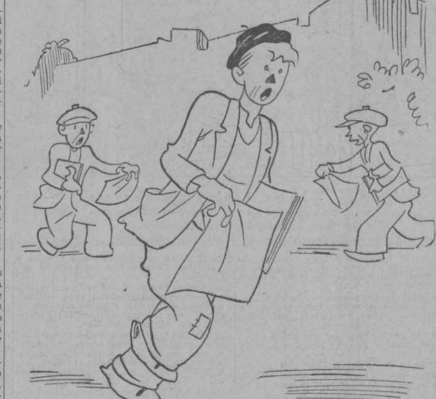
—¡...con el "gordo" en París!