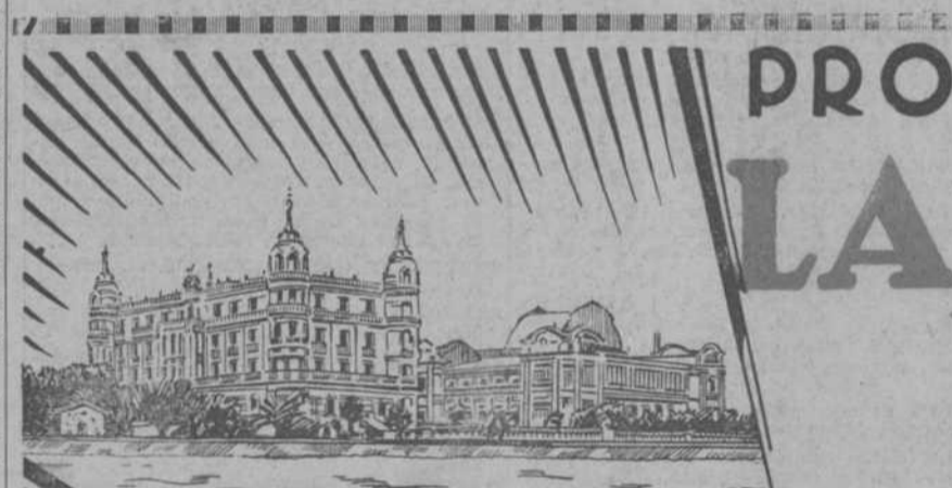
Distribuidores generales para España y Marruecos: BERMUDEZ DE CASTRO Y SANCHEZ, S. L. Apartado 28. La Coruña. Oficinas en Madrid: Carrera de San Jerónimo, 31. Teléfono 23100.

Unos infelices.—(Lugo). Consulta... a nombre de la viuda o de una de las hijas. Es lo más natural. Muy amables, y el pésame.