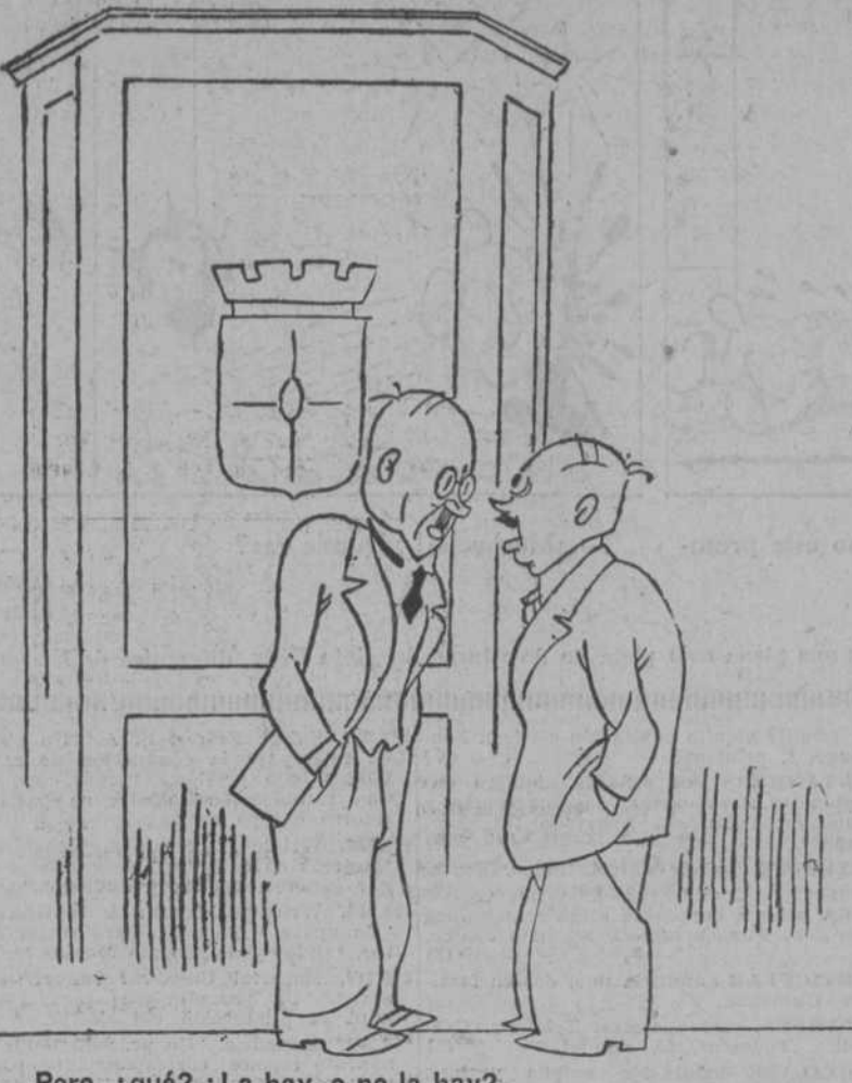
—Pero, ¿qué? ¿La hay, o no la hay? —Sí; se ha encontrado una fórmula para llegar a la fórmula de la fórmula.