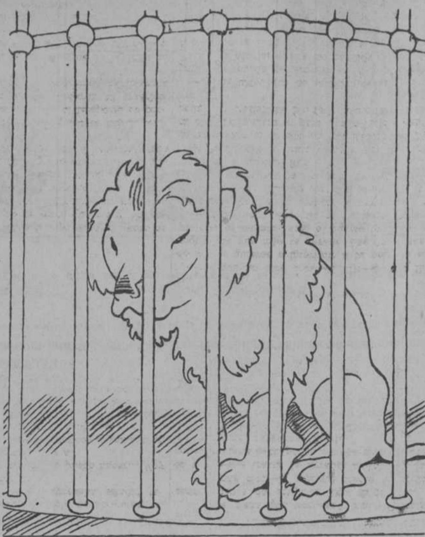
—¡No "semos naide"!