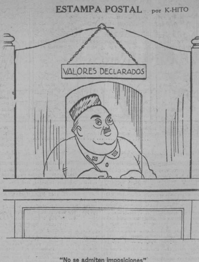
"No se admiten imposiciones"