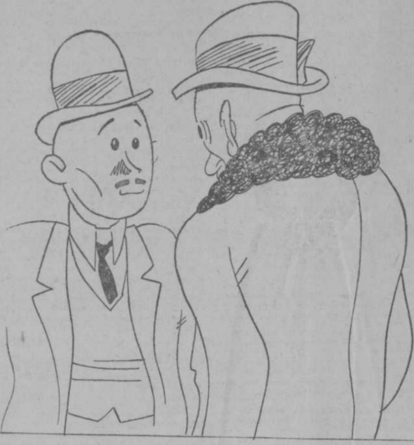
—Bueno: ¿pero qué pasa con Tituleacu y Angelescu? —No sé; algo "novelescu".