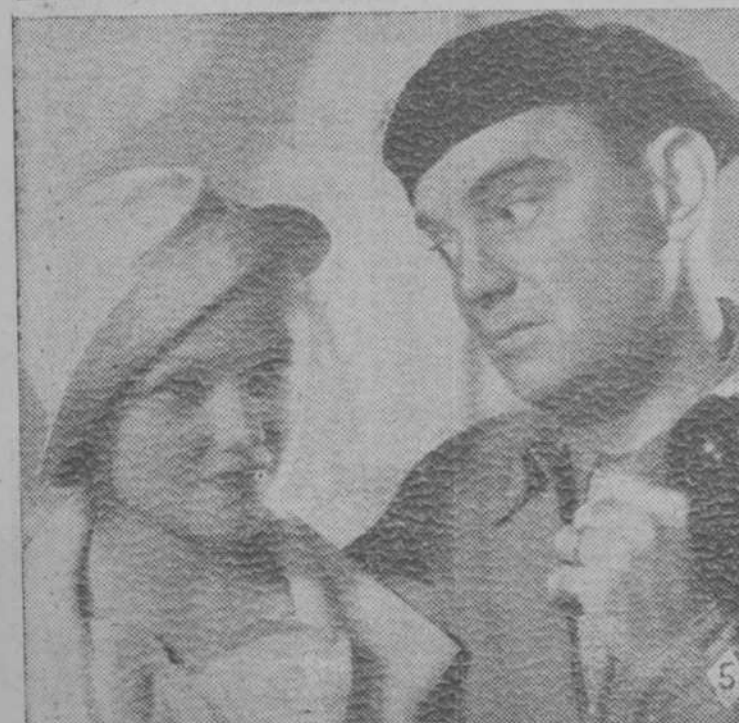
1. El marqués de Portago en la película "Sierra de Ronda", que muy pronto veremos en Madrid.—2. Martha Eggerth, protagonista de "Vuelan mis canciones", que sigue proyectándose con éxito de clamor en la pantalla del Cine San Miguel.—3. Conchita Montenegro y José Crespo en el "film" "Dos noches", cuyo estreno se anuncia próximamente.—4. Una escena de la graciosa película "Chofer con faldas", que muy en breve se estrenará en Madrid.—5. "Aguilas rivales", "film" extraordinario que completa el programa que hoy se estrena en el Cine Avenida.—6. Emocionantes escenas del "film" "El diluvio", que hoy se estrena con su éxito de acontecimiento en el Cine Avenida.