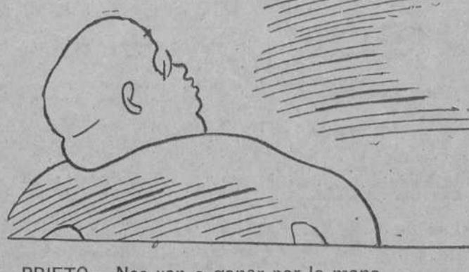
PRIETO.—Nos van a ganar por la mano.