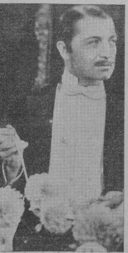
Una escena de "Cabalgata", la superproducción Fox que se estrenará en breve en Madrid

esfuerzo que podía exigirse a la técnica cinematográfica. Para la realización de esta extraordinaria película no se ha escatimado ni medios ni tiempo. Ha sido preciso una labor tenaz y concienzuda, un trabajo en el que se ha intervenido