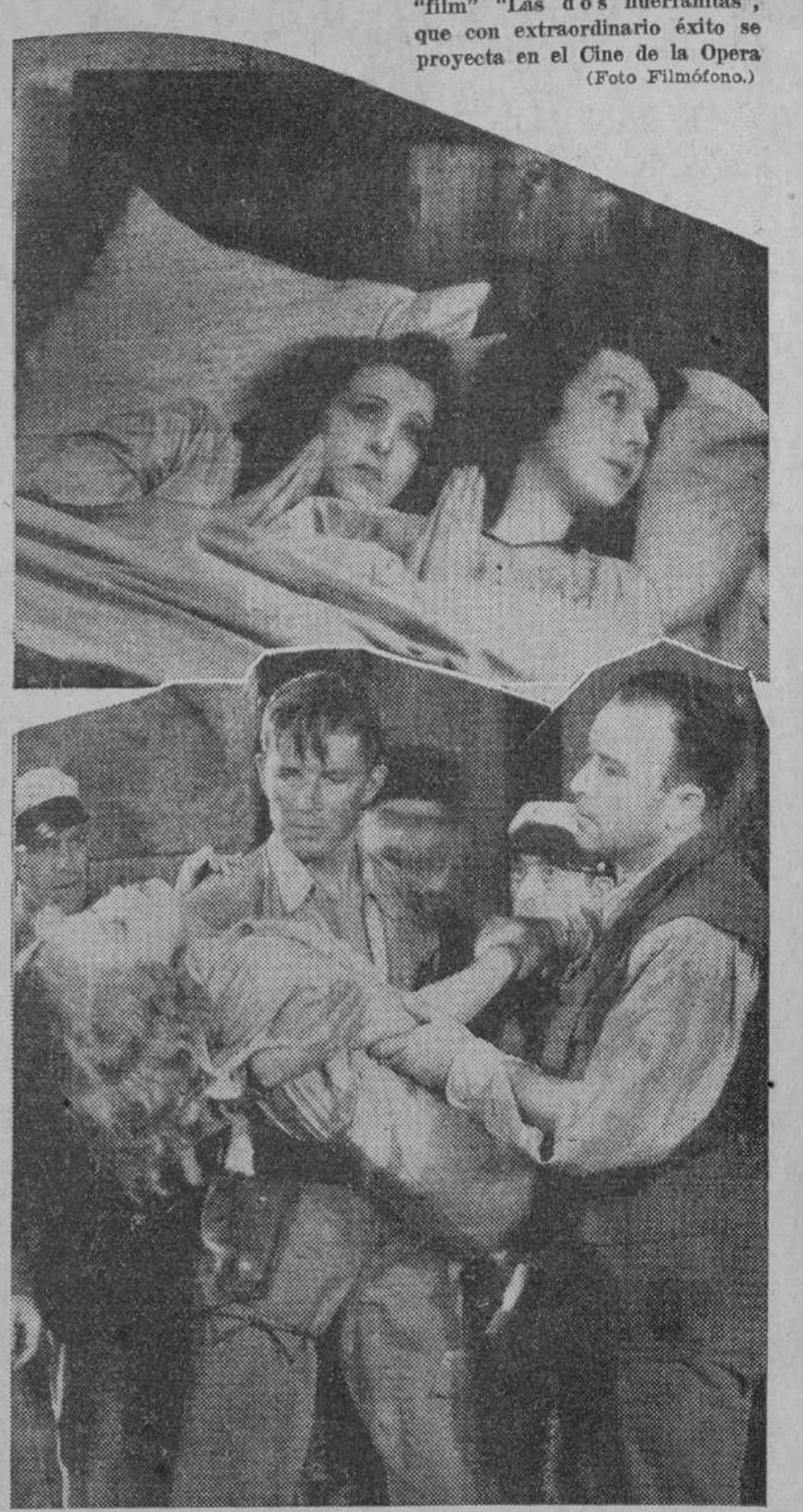
Una escena del emocionante "film" "Las dos huérfanas", que con extraordinario éxito se proyecta en el Cine de la Opera

única que hasta la fecha se mantenía en silencio era la R. K. O. Parecía extraña esta actitud, tratándose de una productora que siempre ha demostrado un afán de superación en sus "films", y este sí-