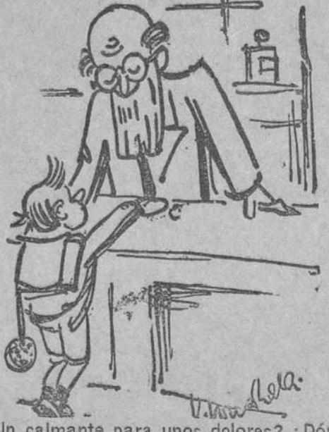
—¿Un calmante para unos dolores? ¿Dónde tiene esos dolores? —Pues todavía no lo sé, porque aún no ha visto mi padre las notas que me han dado en el colegio. ("Lustige Kolner Zeitung", Colonia.)