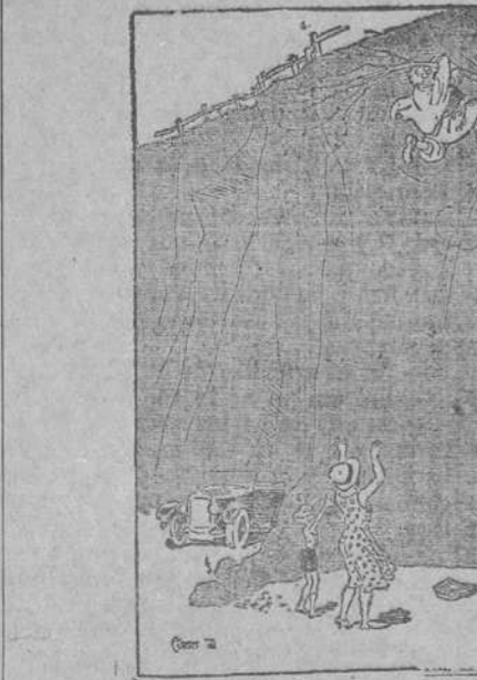
—Ya puedes tirarte. Aquí estamos. ("Everybody's", Londres.)

INGENIEROS DE CAMINOS Hay internado P. de la Lealtad, 2 MADRID