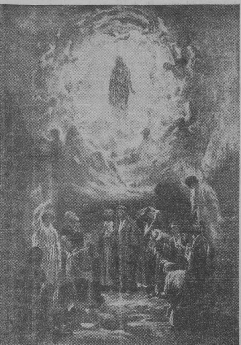
La Ascensión del Señor. Cuadro de W. Hole

No lo entendieron entonces, pero ahora lo entienden. Hablaba el Señor de su breve ausencia por la muerte hasta el momento de su Resurrección; pero hablaba además de esta ausencia, breve también, que nos separa de Él durante nuestro paso por la vida. Una vida que tuvo para los apóstoles, y había de tener para muchos cristianos, la tristeza de la infancia, de los trabajos y de la persecución. "Vosotros padeceréis tristeza y el mundo hablará de gozar." Goza porque sueña que triunfa cuando nos despoja de esa temporal alegría que se fabrica en nosotros con vanos cosas. Pero no importa. Pueden arrebatarnos nuestras manos todo lo que quieran. No nos lo quiten todo. Hay algo eminente y supremo que nadie—oh, nunca nadie!—podrá arrebatarnos. Lo único que los cristianos poseemos realmente; lo único en cuya posesión humde sus raíces lo mejor de nuestro ser; lo que llevamos tan adentro en esperanza que ninguna mano, por rapaz y crispada, pueda hacer botín en ello. Es la divina alegría que Cristo nos brinda desde su Ascensión para el día del encuentro "ad Patrem", "junto al Padre", en el lugar de la cita infinita. Rafael ALCOER, Monje benedictino.