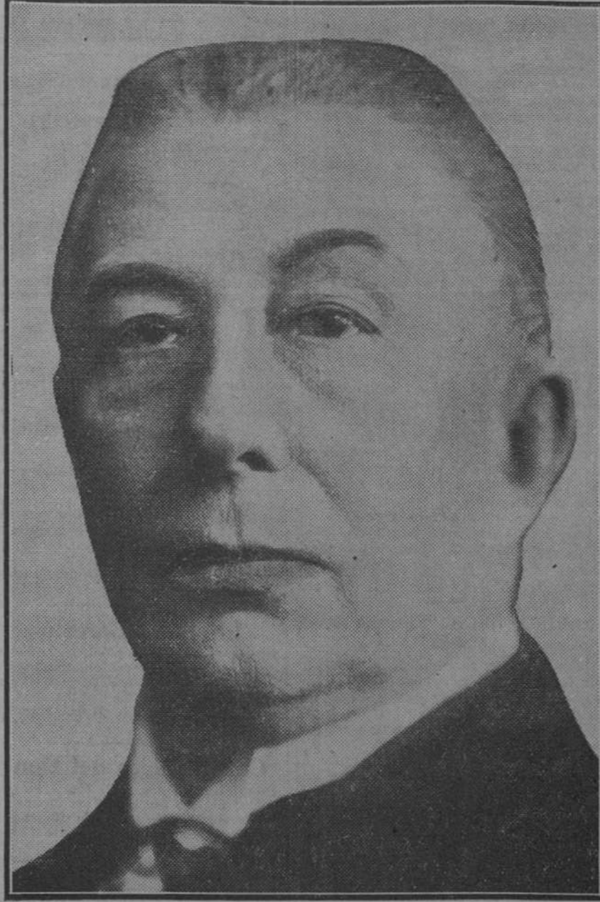
H. Colijn, que ha formado Gobierno en Holanda

Colijn es el jefe del partido antirevolucionario, que, como es sabido, ha ganado puestos y votos en las recientes elecciones. Defensor de la autoridad y técnico financiero de altura, fué por esa razón, además de su triunfo electoral, encargado de formar un Gobierno parlamentario. No pudo lograr su intento, y ha tenido que constituir un Gabinete puramente de negocios, sin carácter parlamentario.