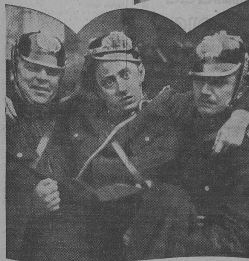
Un gracioso momento del "film" "Burke, el temible", que mañana se estrena en el Cine de la Opera

"Sherlock Holmes" ha sido esta vez confiado el gran actor Clive Brook, cuya sola intervención es ya una garantía del valor de la producción cinematográfica en que toma parte.