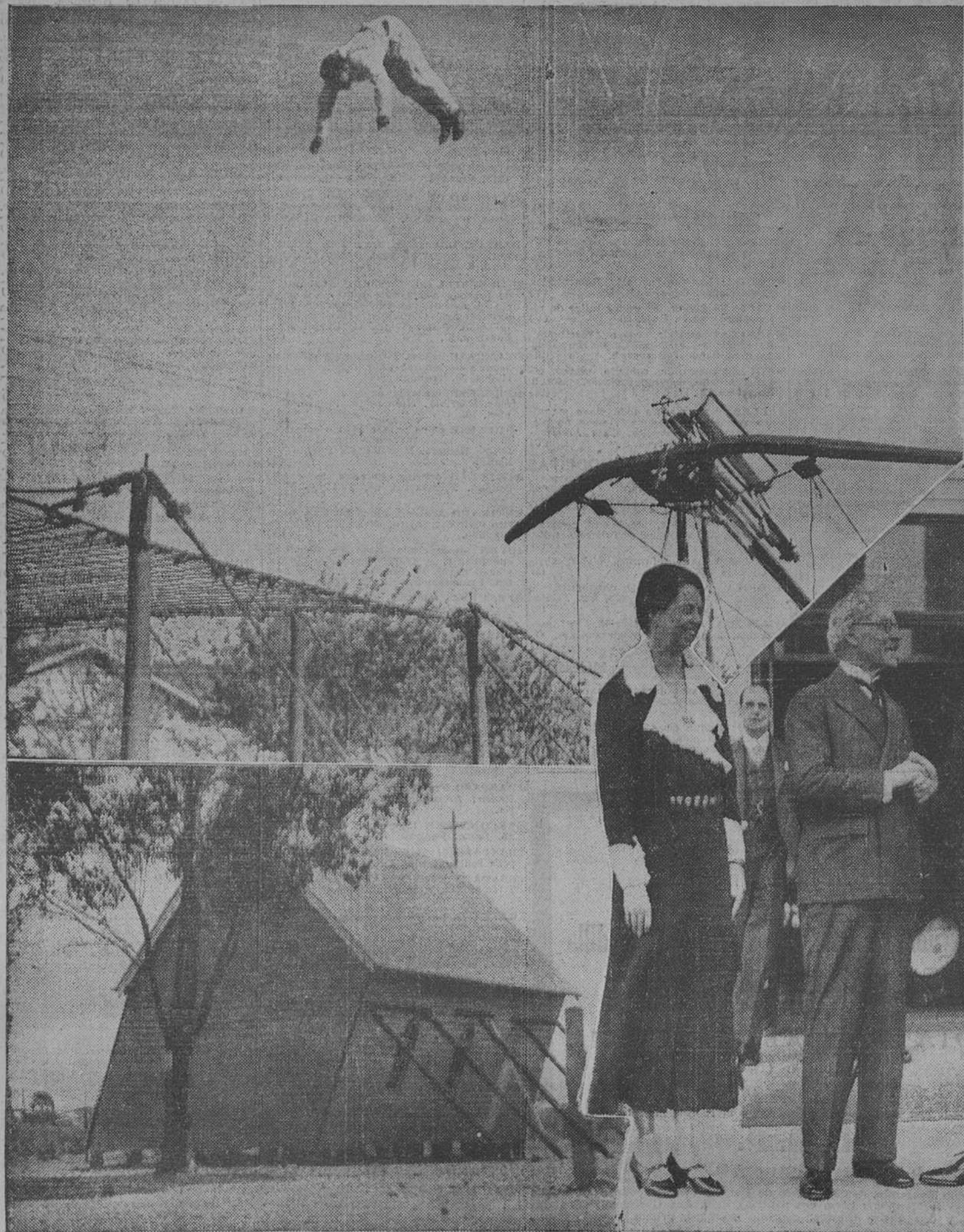
Arriba: La "flecha humana". Un aparato ideado por un italiano mediante el cual se eleva a 50 pies del suelo.—Abajo: La pequeña iglesia de Nueva Gales del Sur (Australia) estuvo a punto de quedar destruida por el huracán. Los feligreses la han apuntalado, y en las condiciones que pueden apreciar en la fotografía el culto continúa.