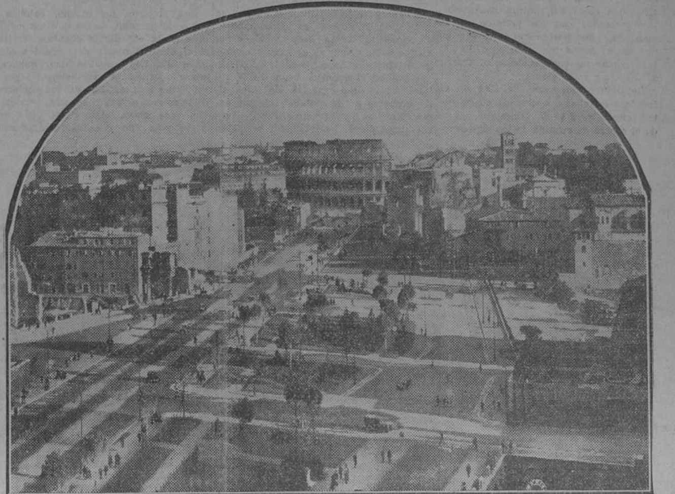
Un aspecto de la nueva vía del Imperio, recientemente abierta, derribando manzanas enteras de casas sin valor artístico ni arqueológico. Verdaderamente imperial, va desde la plaza de Venecia, pasa al pie del Capitolio y llega al Coliseo (al fondo de la "foto"), donde se crea una gran plaza que deja aislado en toda su grandeza el exterior del gran anfiteatro. A ambos lados de la avenida y de sus amplios jardines, restos de la época de mayor esplendor arquitectónico.