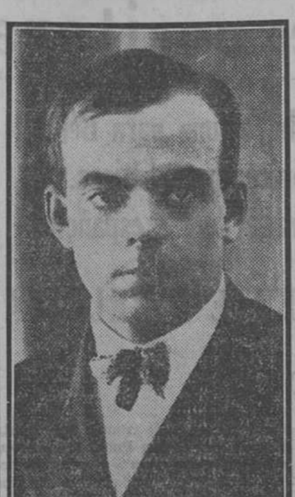
A. DE STE. EXUPERY

En resumen, dos libros interesantes para el público en general, y especialmente para quienes sepan de las sensaciones fuertes e inefables del vuelo.