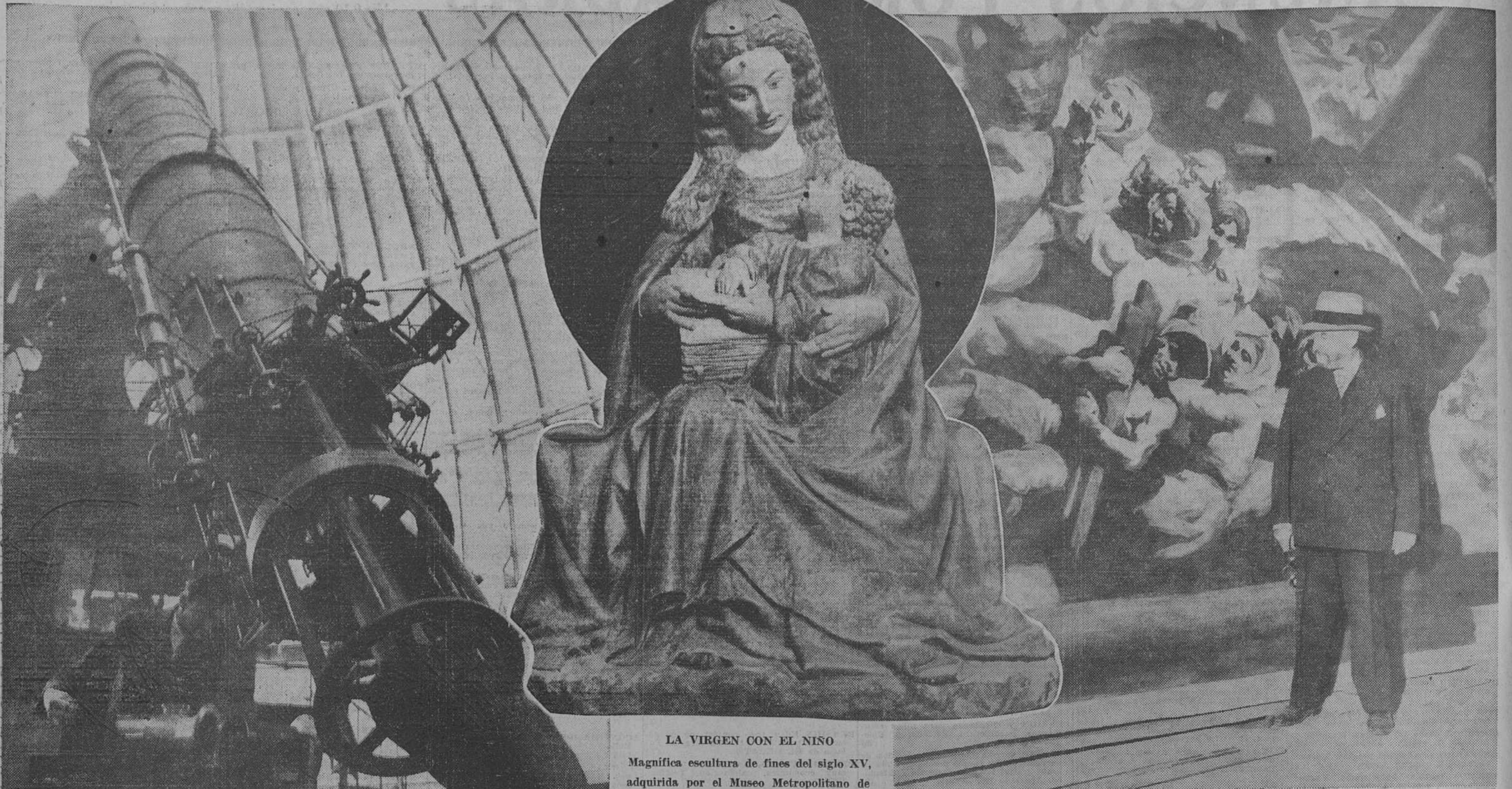
LA VIRGEN CON EL NIÑO Magnífica escultura de fines del siglo XV, adquirida por el Museo Metropolitano de Arte de Nueva York