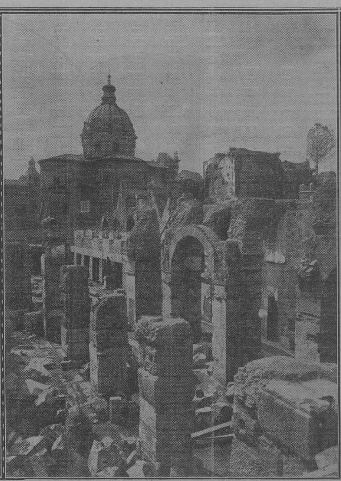
Tres meses después. Restos del pórtico del magnífico foro; se ven por el suelo columnas derribadas (hoy ya levantadas sobre sus pedestales) y una estatua

puerto ha surgido una población nueva. Se han gastado ya dos mil millones de liras, pues Mussolini no ha querido que las expropiaciones constituyan un sacrificio oneroso de los propietarios, y aún queda por realizar una obra inmensa. Últimamente la crisis económica no ha permitido la celeridad que se hubiera deseado; pero aun así, se lleva las obras a ritmo acelerado. El Estado entrega cada año 300 millones. Ocasionalmente ha habido en que trabajaron cinco mil obreros en turnos de día y de noche.