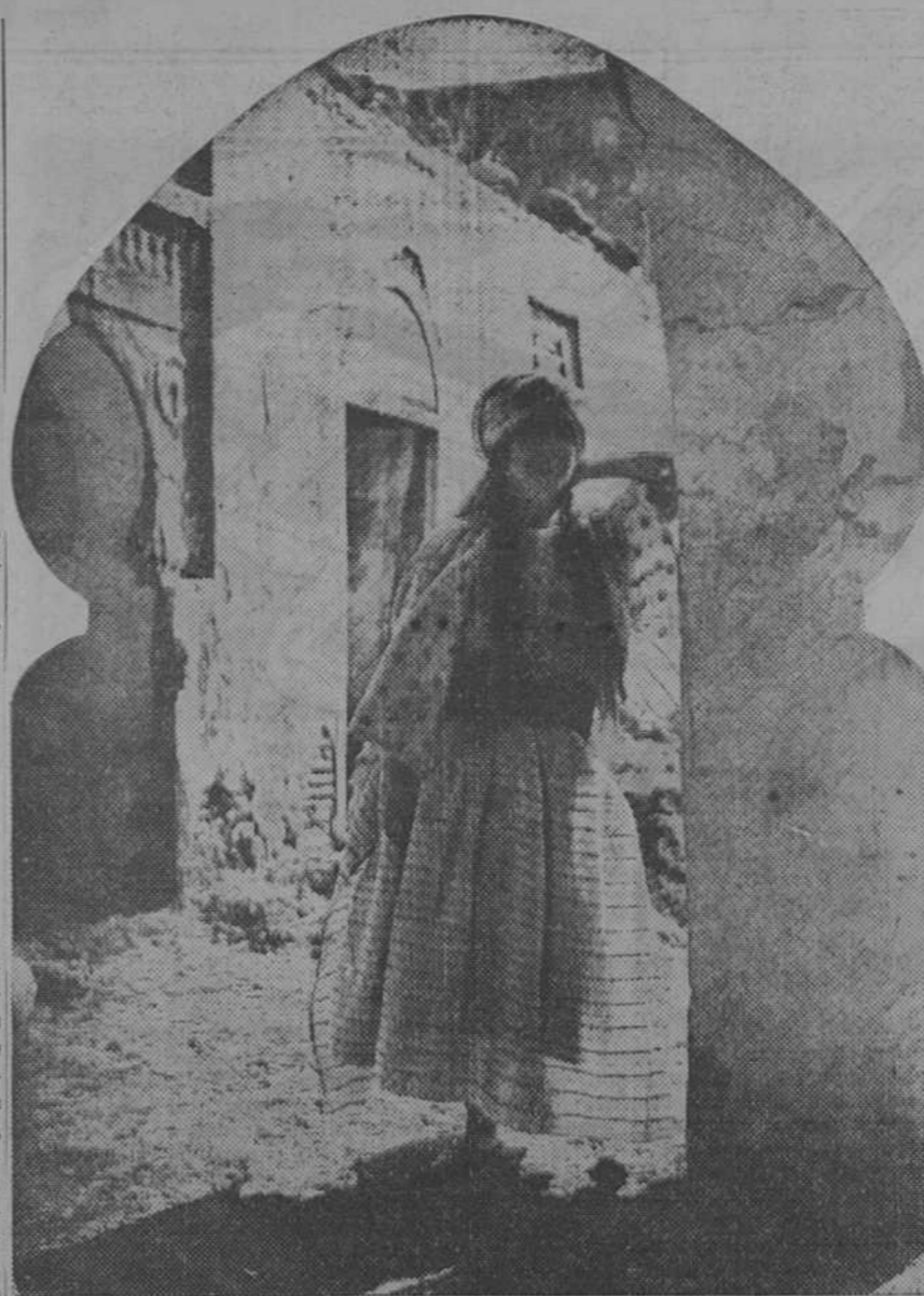
Adosadas a la típica puertecita árabe, muchachas jóvenes, sin velos en el rostro, algunas bellísimas, mostrando sus caras inexpresivas e estáticas de candor, contemplan al extranjero curiosamente

Como muestra de los resultados obtenidos vamos a consignar el total de tu-