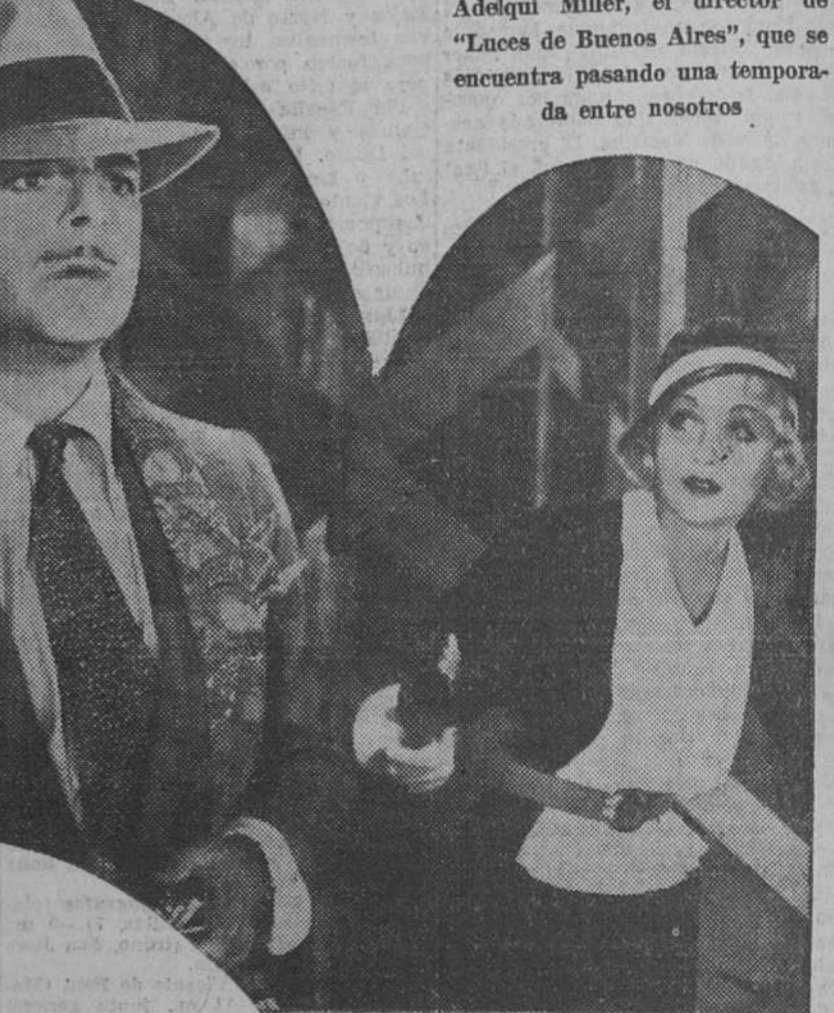
Constance Bennet y Neil Hamilton en la deliciosa película "Hollywood al desnudo", que el Cine Barceló presentará mañana lunes