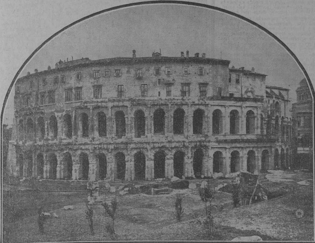
El soberbio teatro Marcello, dedicado al sobrino de Augusto, en el que se han realizado importantes obras de restauración y aislamiento. El nivel del suelo era hasta 1931 más alto, de modo que los arcos bajos estaban en gran parte soterrados y aparecían como puestos de carbonerías y tenduchos. Los arcos altos estaban cegados con muros de ladrillo, en los que se abrían pequeñas ventanas enrejadas. El teatro era capaz de unos 14.000 espectadores

Y ahora se trabajará en el aislamiento del monumento más sagrado, como el Augusteo, tumba de Augusto y de familiares, como Marcelo.