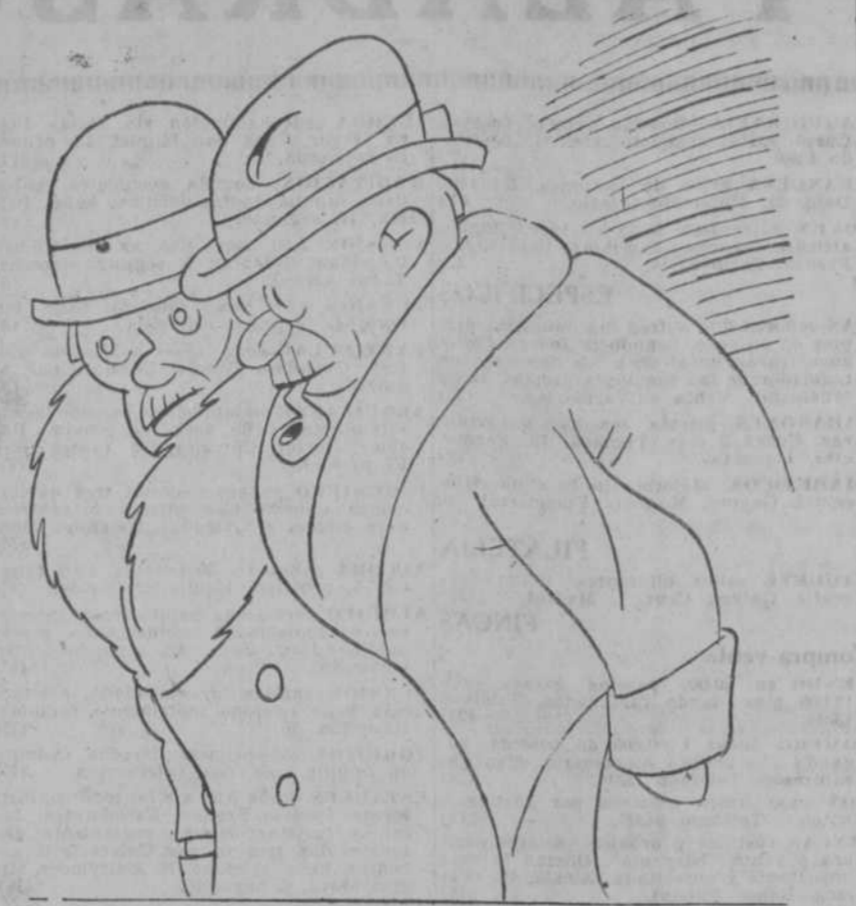
—El caso es que nos pasamos el día de conferencias. —¿Políticas? —Y telefónicas.