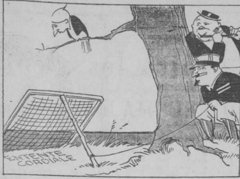
ALEMANIA.—Desconfío de la "Entente Cordiale".