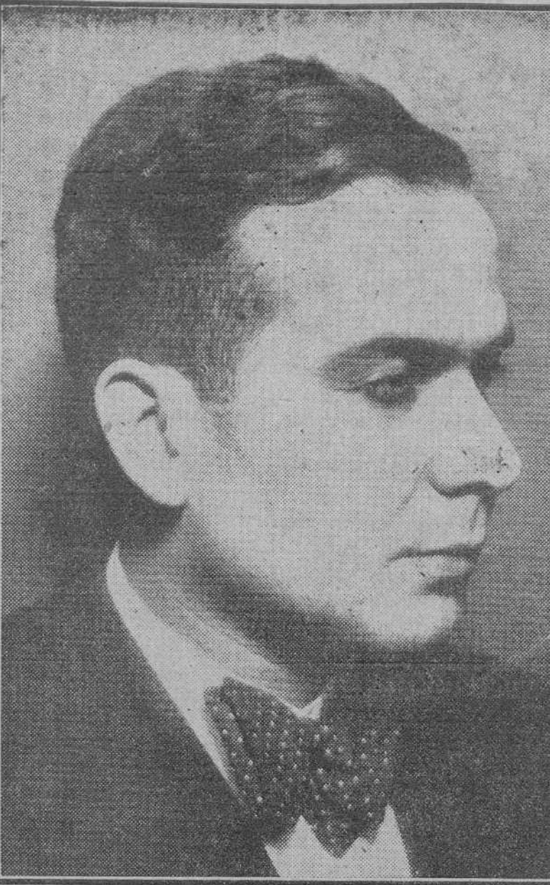
Don Juan J. López Ibor, que ha obtenido por unanimidad la cátedra de Medicina Legal de Santiago de Compostela

El señor López Ibor tiene veintiséis años, y ha pasado toda su vida consagrado al estudio tenaz y fervoroso... El señor López Ibor fue Presidente de la Federación de Estudiantes Católicos de Valencia.