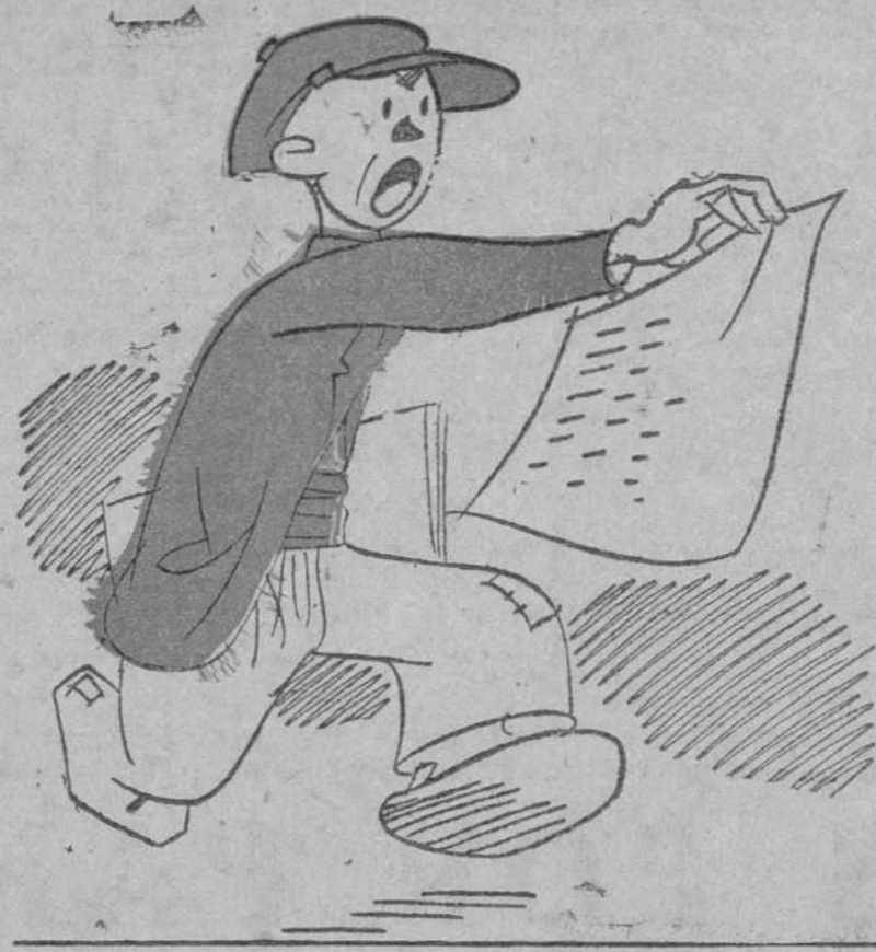
—¡La verdadera Iberia... confederada! ¡Con el gordo en Barcelona!