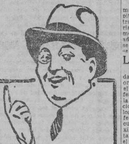
Portrait of a man in a suit, likely the author or a notable figure mentioned in the text.

¿Qué llevas en ese envoltorio tan grande? —Un sombrero de señora. —¿Qué enormidad! No podrás verle la cara cuando vayas con ella. —Para eso lo hago. Se trata de mi suegra. ("Gezatti Illustrato", Venecia.)