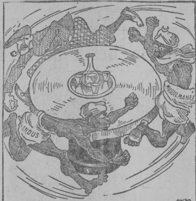
VUELTAS SIN FIN A LA MESA REDONDA

las órdenes oportunas suspendiendo en su curso de varias conferencias en una de nuestras universidades.