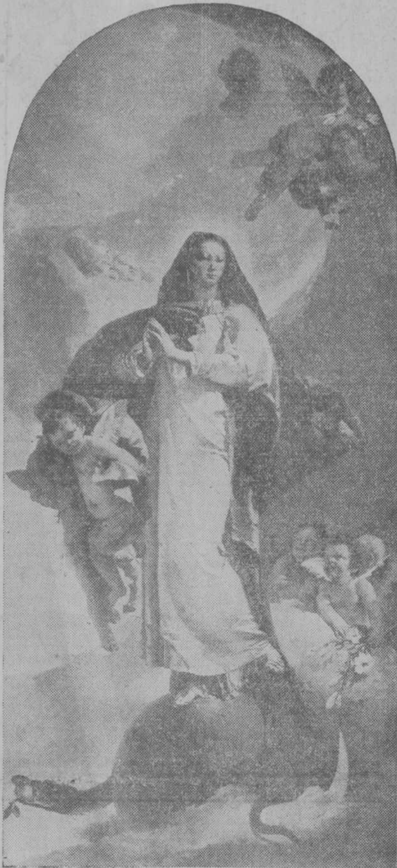
He aquí una reproducción de la famosa Purísima de Tiziano. Colocando el hermoso cuadro al frente de este número vestimos nuestro periódico con la gala de este día, que tantas cosas hondas dice al corazón de los españoles. La Iglesia lo celebrará con la solemnidad acostumbrada. Los fieles podrán añadir a la celebración de siempre el homenaje de una donación generosa para contribuir a los gastos del culto y clero. En todos los templos de Madrid se verificará una colecta. Los católicos deben responder, y estamos seguros de que lo harán, de un modo espléndido. Con amor. Con sacrificio. Ya hay nombrada una Junta, que preside el señor Obispo, y de la que forman parte sacerdotes y seglares, para organizar en la diócesis la distribución de lo colectado. En muchas provincias se celebrarán también colectas con el mismo fin. Sea la gloriosa fiesta de hoy ocasión de que muestren los fieles, al par que la devoción a la Virgen Santísima, su adhesión eficaz a la Iglesia católica

El arrendatario de estos elementos es contrario al del ministro de Trabajo. En efecto, hace unos días una Comisión de la Confederación Nacional Católico-Agraria visitó al ministro y le pidió que los arrendatarios asociados en los Sindicatos mixtos tuvieran voto como tales en las elecciones para Jurados de la Propiedad Rústica. El señor Largo Caballero contestó que eso ya estaba