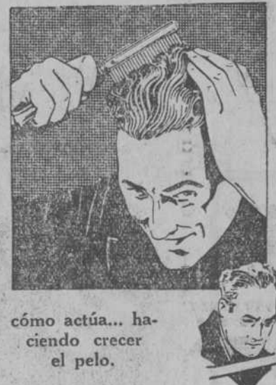
cómo actúa... haciendo crecer el pelo.