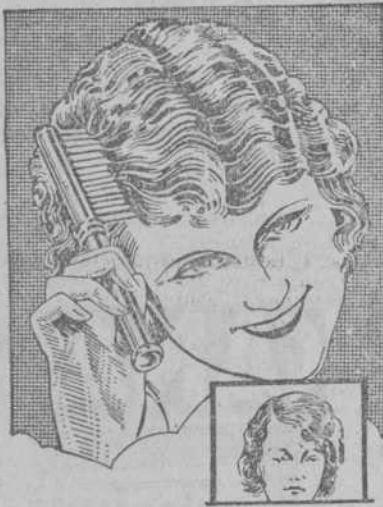
Se riza a medida que se peina. También crece más pronto