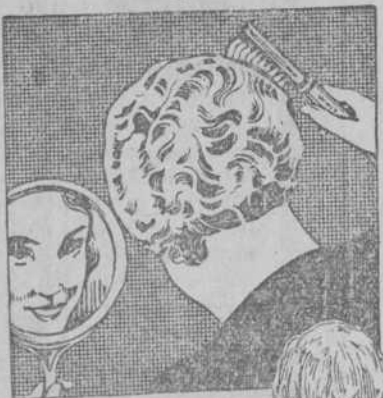
Así lo decían... ¡y tenían razón!

No es un secreto la acción e influencia que ejerce la electricidad sobre el cuero cabelludo, que más que cualquiera otra parte del cuerpo necesita de su intervención activa.