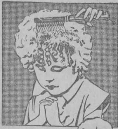
¡¡hacerse crecer el cabello!!