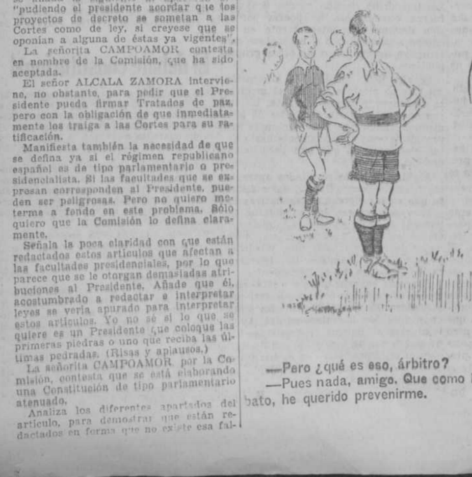
—Pero ¿qué es eso, árbitro? —Pues nada, amigo. Que como la otra vez que jugasteis no oíais el silbato, he querido prevenirme. ("Humorist", Londres)