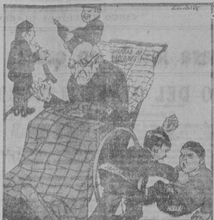
—Yo dando voces y la abuelita sin oírme. ("Kladderadatsch").

Sesiones nocturnas para discutir los proyectos de ley anunciados. El primer proyecto de ley que se pondrá a discusión es el del Jurado