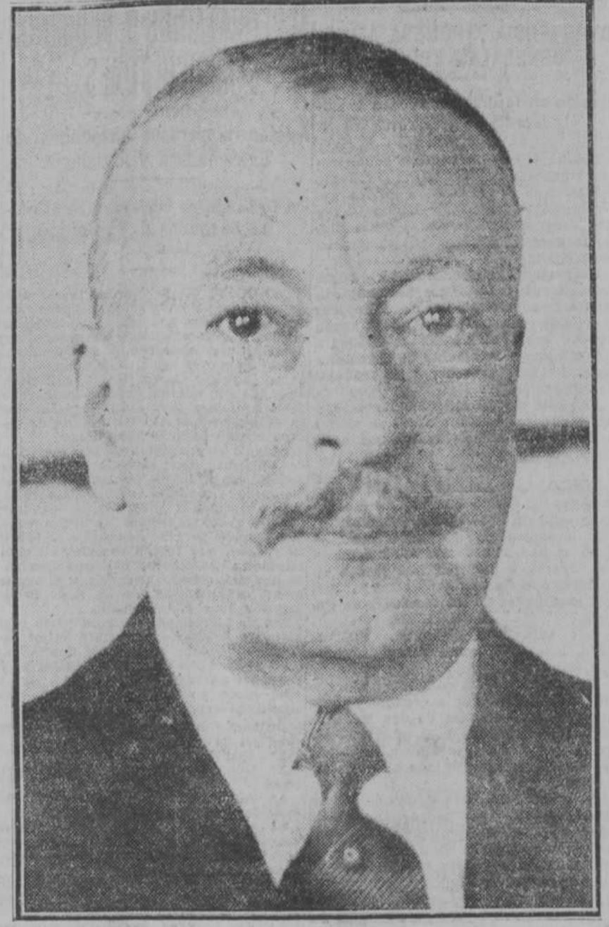
Mr. Lucien Saint, residente general de Francia en Marruecos, que se encuentra actualmente en Madrid