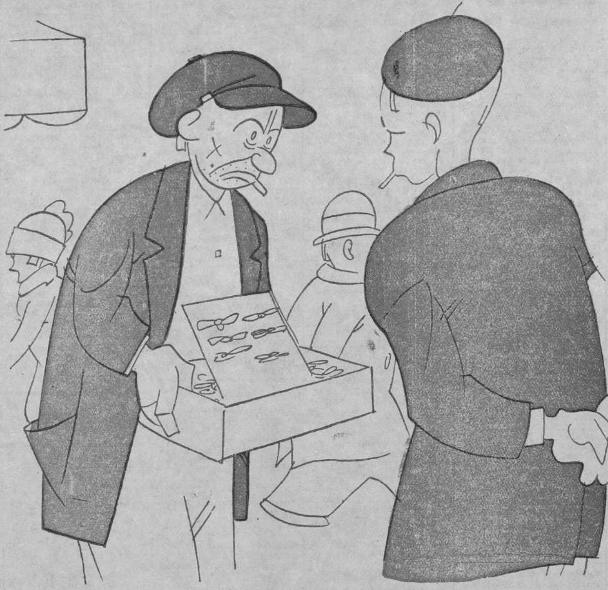
—Pues te advierto que hemos vendido 30.000 metros de cinta. —¿A cuánto el metro? —¡Hombre! A 0,60, sin propina.