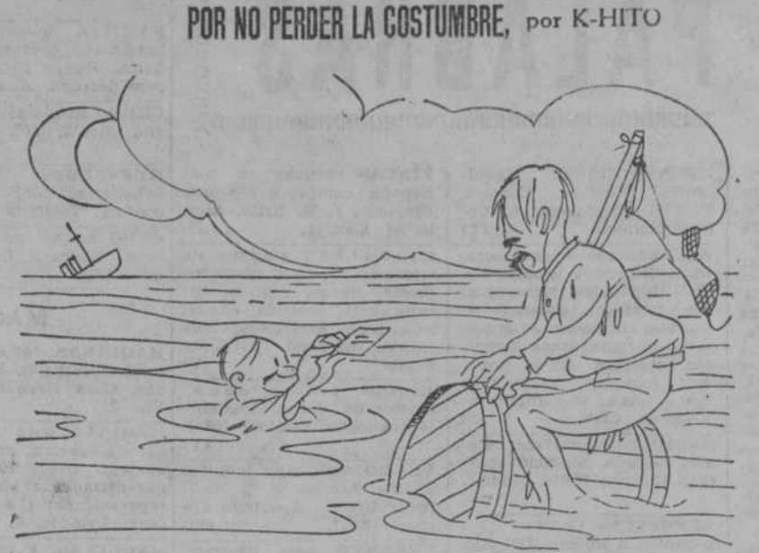
—El sobrecargo del "Almirante Pérez" felicita a usted las Pascuas.