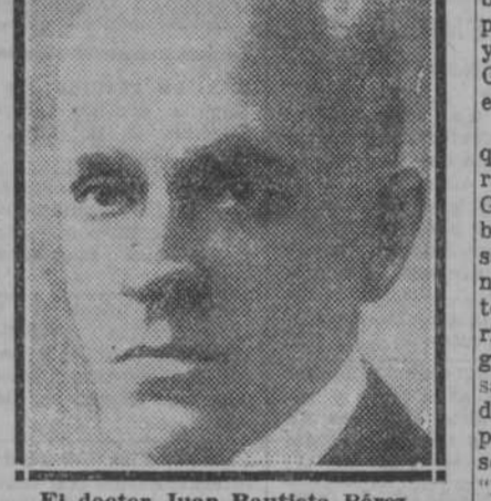
El doctor Juan Bautista Pérez, presidente de Venezuela

El general Juan Vicente Gómez, ex presidente de Venezuela. 362.475.000 bolívares en obras públicas de todas clases. Téngase en cuenta que la extensión del país se acerca al millón de kilómetros cuadrados y sus habitantes son 3.000.000. Pero la nación tiene una balanza comercial favorable: en 1928 con 192 millones de bolívares en 1929 con 129 millones de bolívares a 1.026 millones. El general Gómez no está ya en la presidencia de la República. Terminado su período presidencial se retiró, y es ahora el comandante del Ejército venezolano. Le ha sustituido en la presidencia un magistrado, el doctor Juan Bautista Pérez, que preside el Tribunal Supremo de Venezuela.