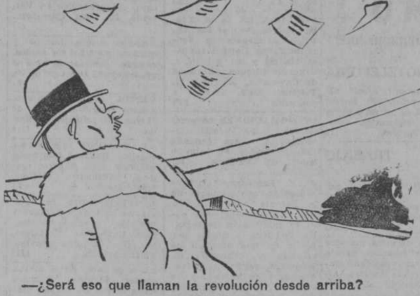
—¿Será eso que llaman la revolución desde arriba?