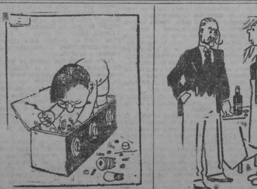
EN EL APARATO DE RADIO

—¡Es desgracia! ¡El paraguas se me ha vuelto y el mango está partido! (London Opinion, Londres)