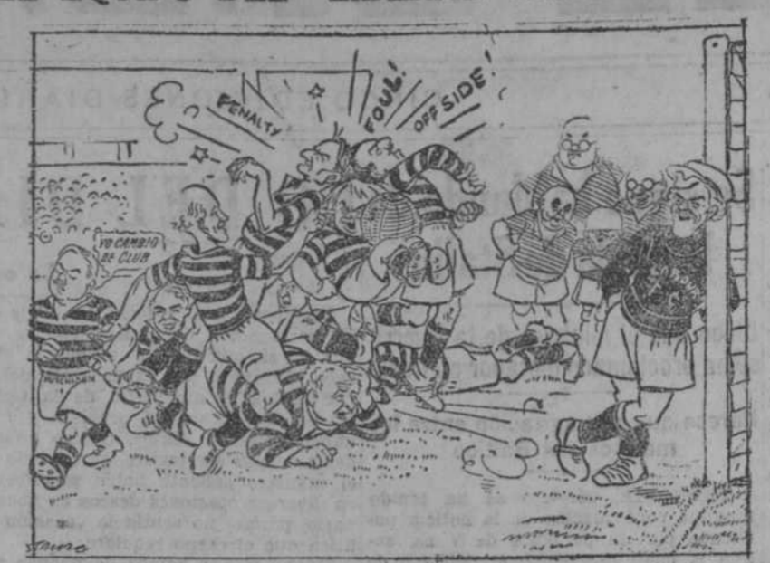
Los liberales ingleses suelen votar divididos en tres fracciones: con el Gobierno, contra el Gobierno y en blanco. En el extremo se ve a Hutchinson “whip” (encargado de vigilar la disciplina) del partido que dimitió hace días.