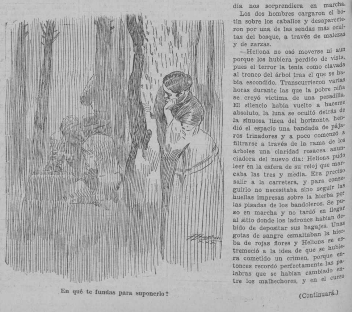
En qué te fundas para suponerlo? (Continuará.)