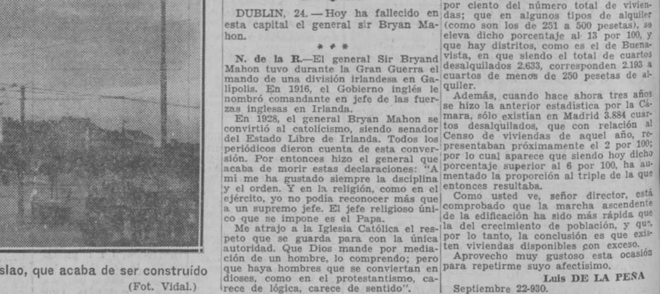
Curiosísimo tipo de iglesia moderna en Praga. El templo de S. Wenceslao, que acaba de ser construido