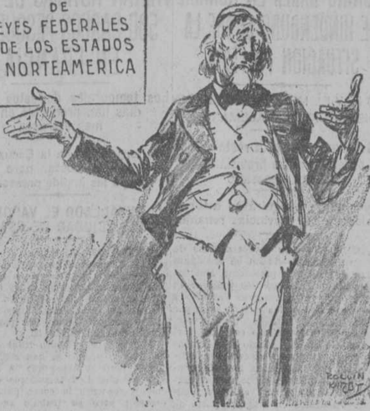
EL AÑO QUE VIENE HABRÁ MAS ("New York World.")

HAY 3.500 VOLUMENES DE LEYES FEDERALES Y DE LOS ESTADOS EN NORTEAMERICA