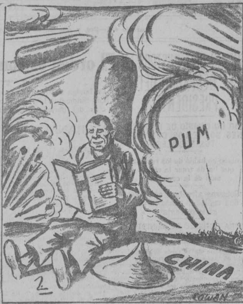
COMO LA HAN ADQUIRIDO