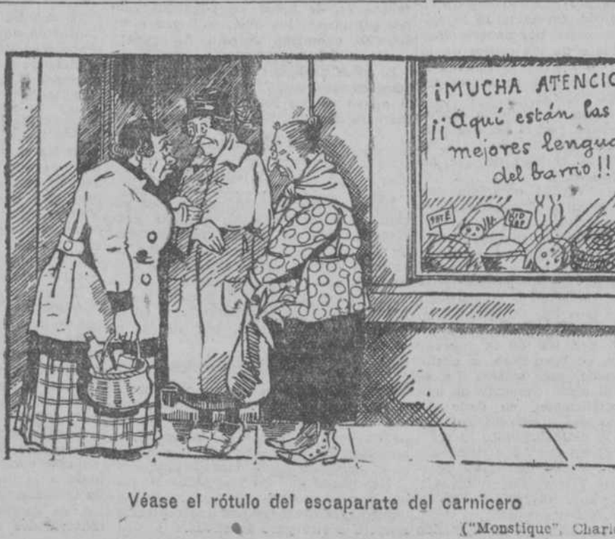
Véase el rótulo del escaparate del carnicero

EL EMPLEADO DEL MANICOMIO.—Oiga usted; si viene aquí un individuo pidiendo dinero es un loco.