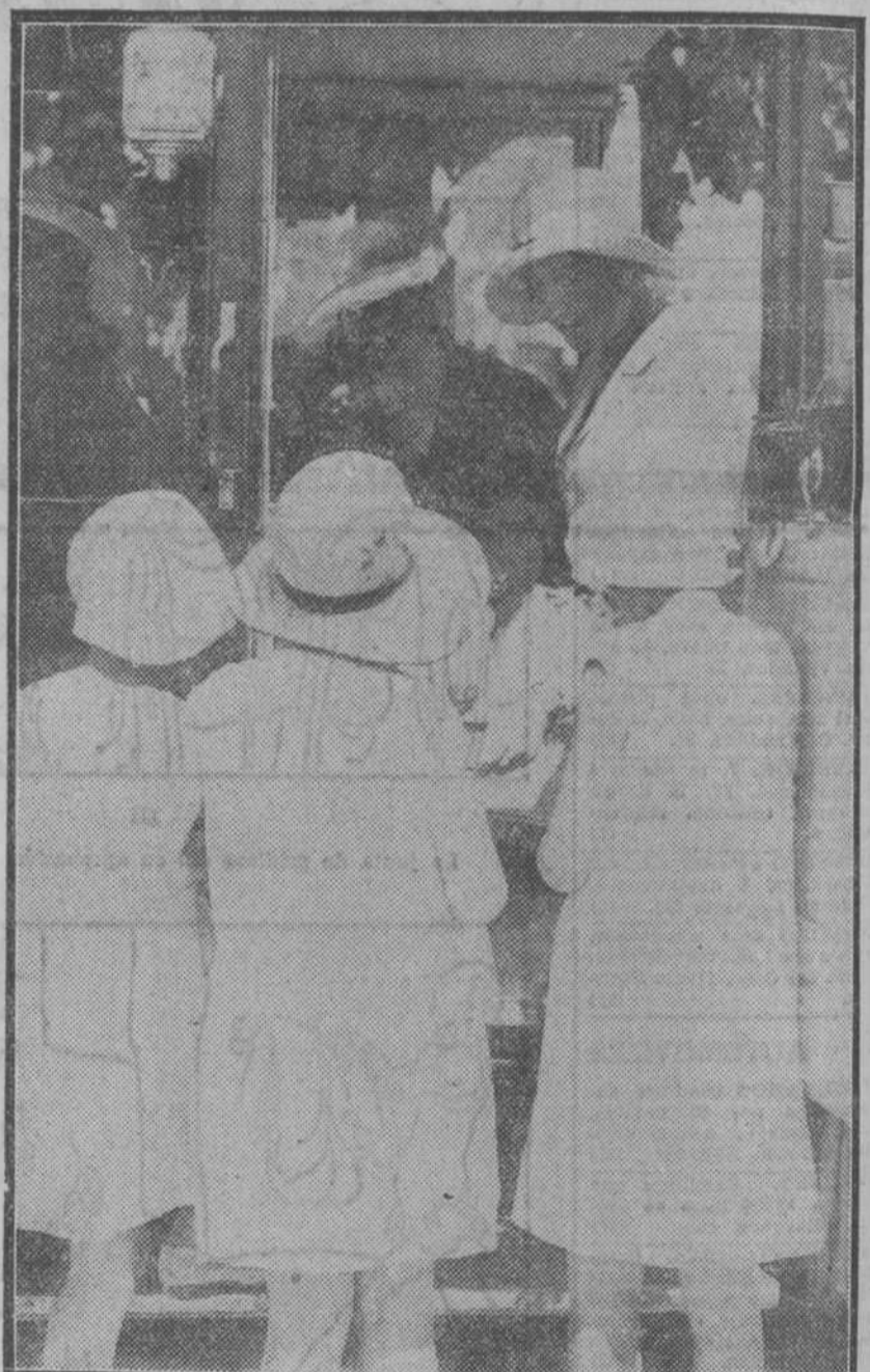
El coche en que va la infanta Beatriz rodeado de peticionarias, deseosas de aumentar la recaudación todo lo posible