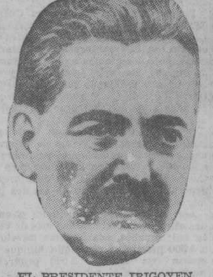
EL PRESIDENTE IRIGOYEN

BUENOS AIRES, 11.—Coincidiendo con un manifiesto firmado por cuarenta y cuatro diputados y senadores de oposición, en el que se acusa al Gobierno presidido por el señor Irigoyen de usurpación de poderes y en el que se hace un llamamiento al pueblo para que se apreste a defender las instituciones de la república.