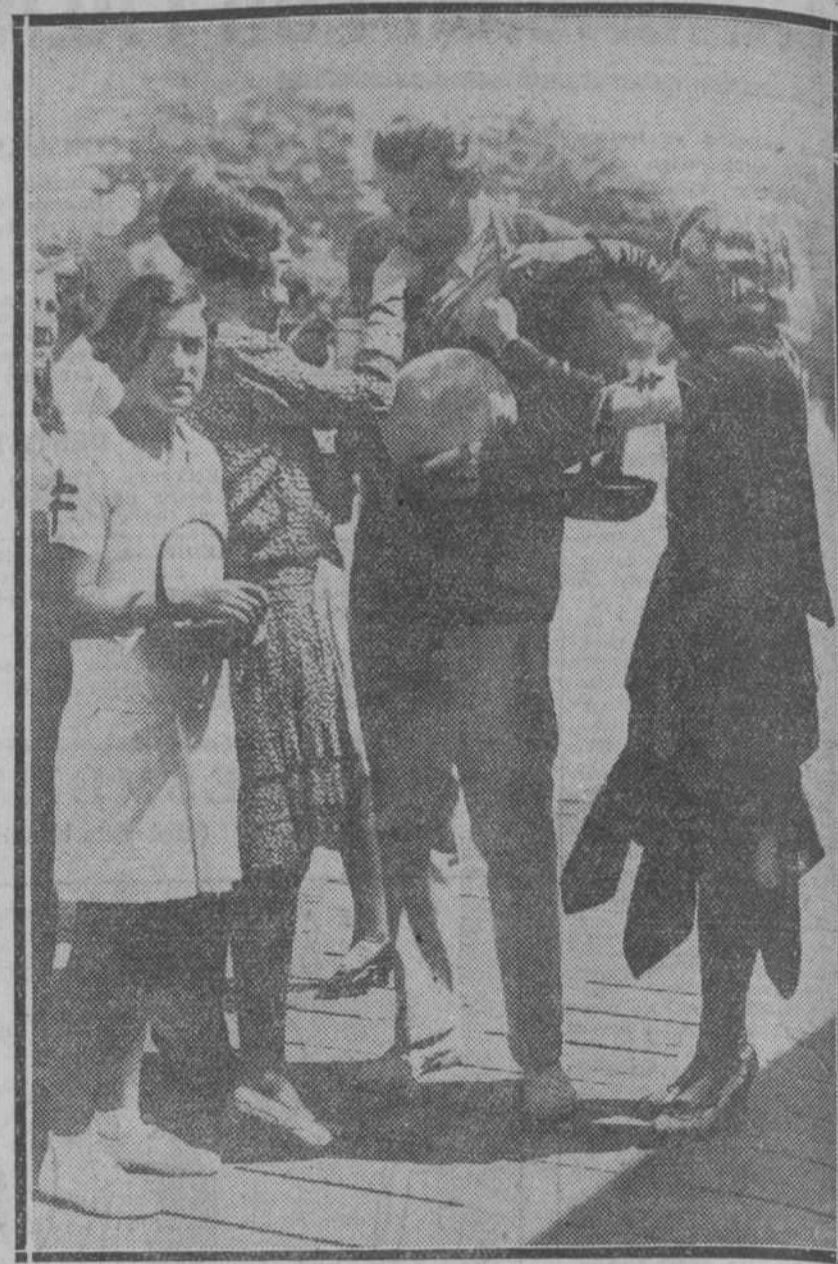
Varias postulantales asaltan al infante don Jaime que, mientras sonríe y se deja engalanar las solapas, busca en el portamonedas el donativo que ha de depositar en la hucha