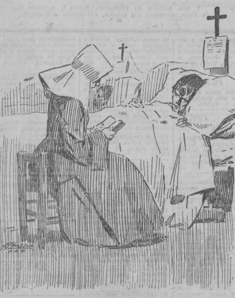
rezaban conmigo las oraciones que me enseñó mi pobre madre...

dedicados a endulzar los dolores y las miserias humanas, donde los enfermos, débiles e incapaces de bastarse a sí propios, se convierten en niños, yo fui un niño más y como a un niño me trataban las Hermanas de la Caridad, esas santas mujeres que no añelaban sino sacriarse en beneficio de los menesterosos, de los enfermos, de los que sufrían.