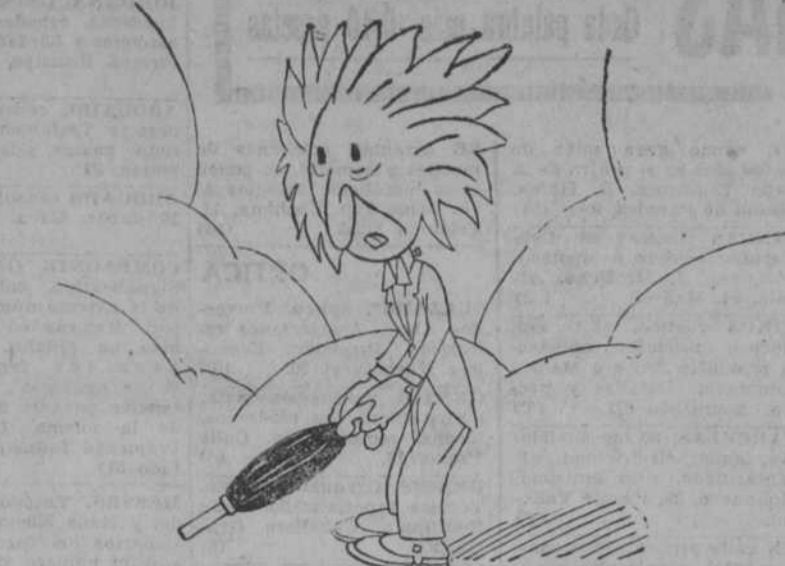
—¡Ea! Voy a salir un ratito; pero... ¡venga el paraguas!