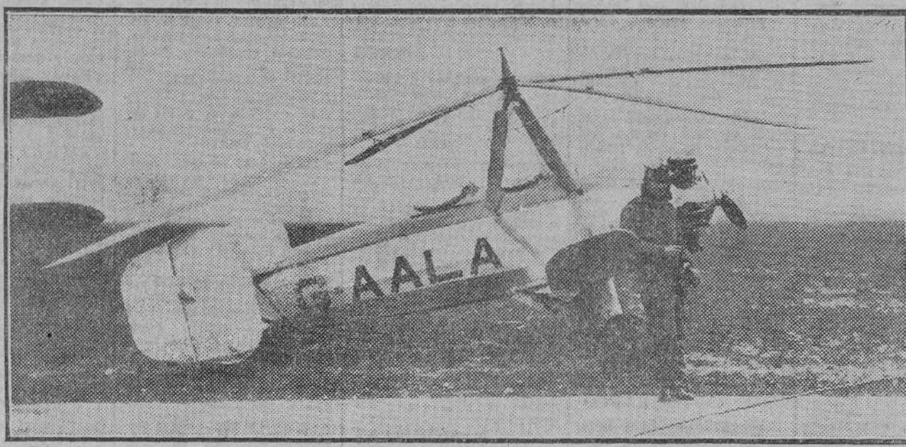
El capitán Rawson, junto a un autogiro Cierva, en el que ha efectuado un vuelo de prueba sir Sefton Brancker.