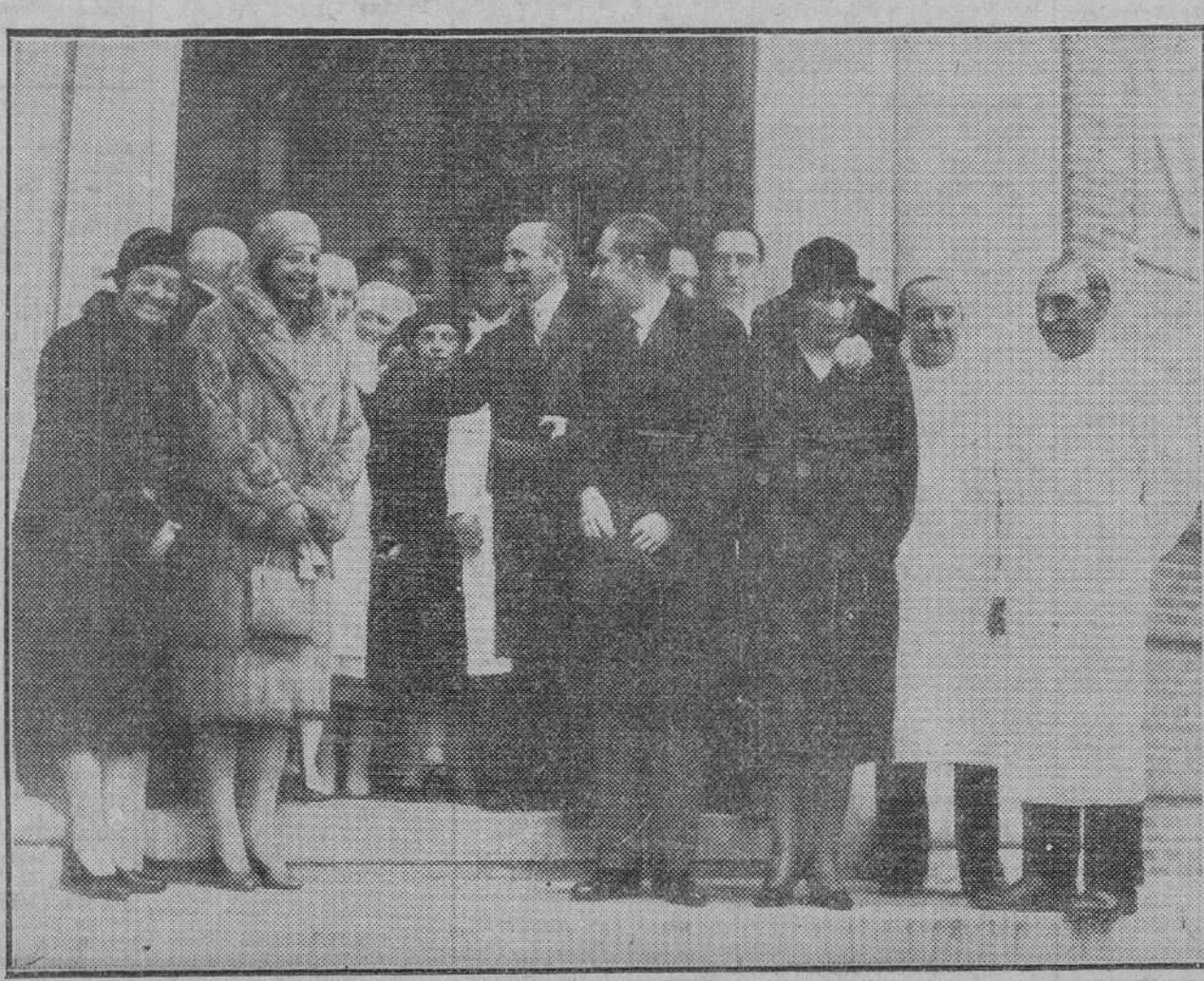
El Príncipe de Asturias al salir del Hospital de San José y Santa Adela, donde presidió una sesión clínica. En la fotografía se ve también a su majestad la Reina y a la infanta doña Beatriz.