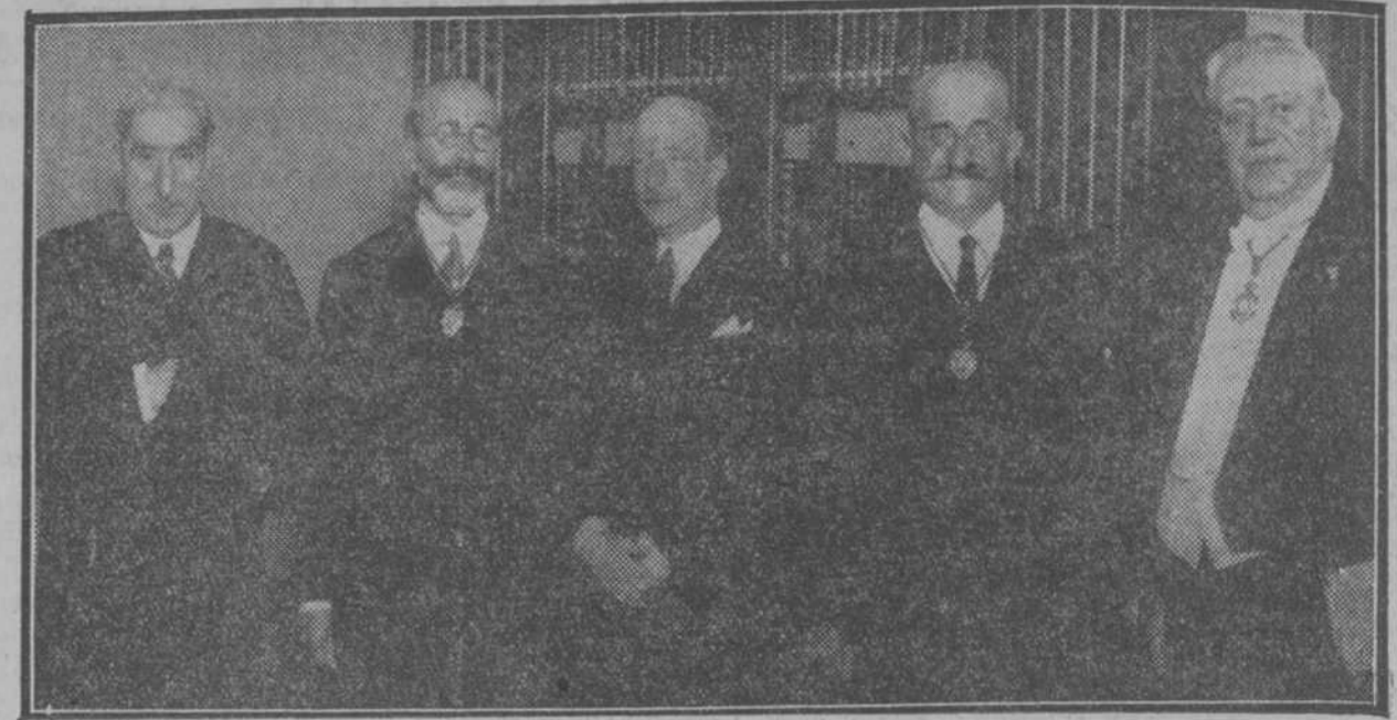
El ministro de Instrucción pública, señor Callejo, que ha presidido la sesión celebrada en la Real Academia Española con motivo de la Fiesta del Libro, acompañado de los presidentes de las Reales Academias Española, de Ciencias Morales y Políticas, y de Bellas Artes, señores Menéndez Pidal, Sánchez de Toca y conde de Romanones, y el señor Ureña, que ha leído el discurso en la sesión.

en Murcia, próxima al mar, de gran producción y recreo, vendese, con 1.325 fanegas de tierra de cultivo y excelente arbolado, compuesto de 10.000 almendros, 2.000 olivos, 2.500 algarrobos, muchas higueras, naranjos, limoneros, granados y pinar. Casa-palacio y seis casas más, con grandes dependencias agrícolas; atravesada por carretera y a cuatro kilómetros de estación f. c., con trenes expresos; 10 metros altura sobre nivel del mar. Precio: 375.000 pesetas. Abstenerse corredores. Para detalles, dirigirse al Apartado de Correos núm. 7.059, Madrid.