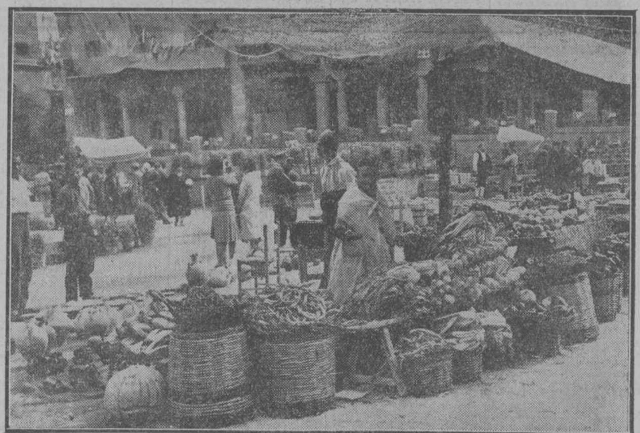
Una de las típicas tiendas del Pueblo Español, de la Exposición de Barcelona, durante la celebración de la Semana Aragonesa.