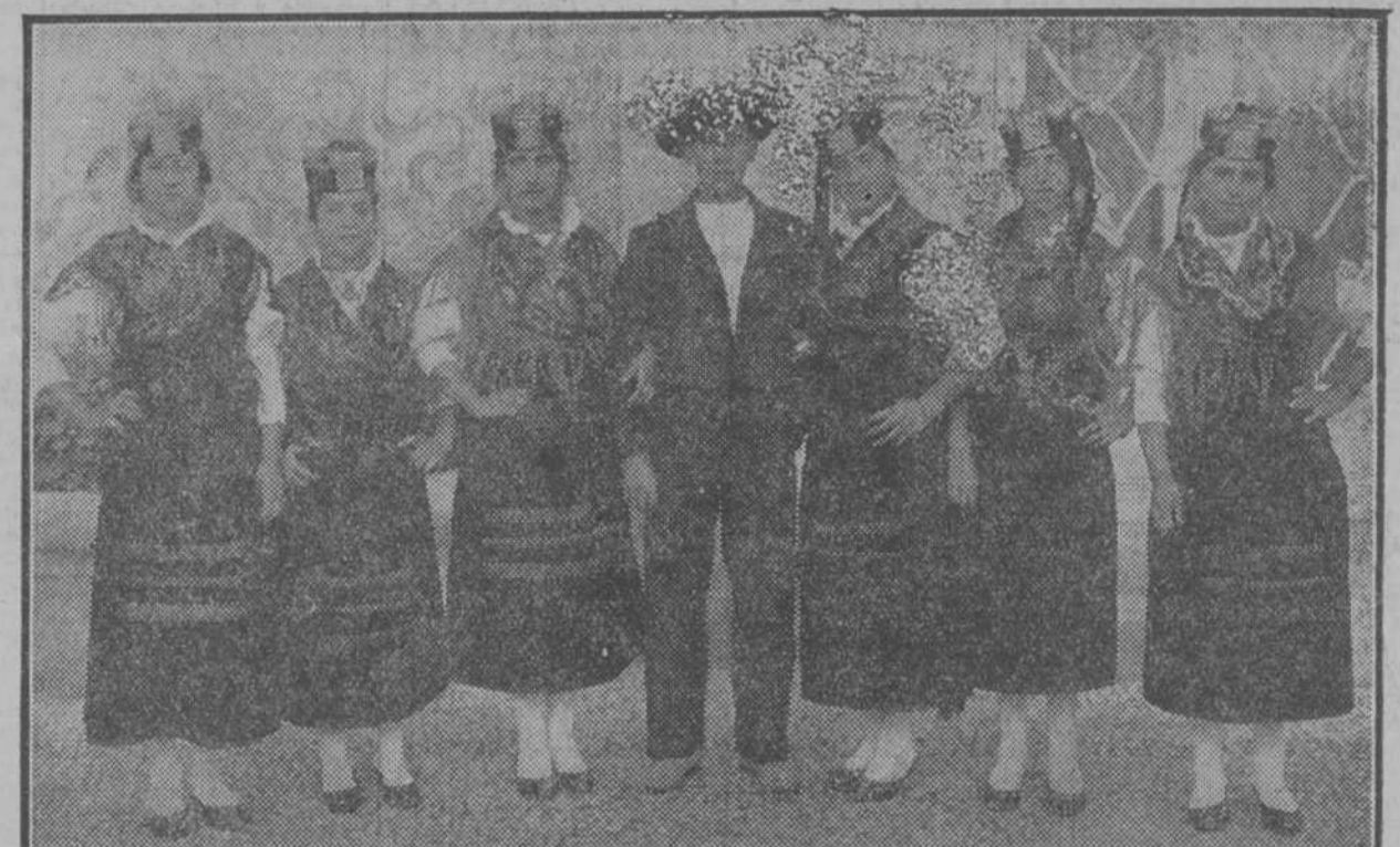
Aldeanos portugueses que han ido a Sevilla con motivo de la celebración de la Semana de Portugal, y que con sus trajes típicos tomarán parte en varios de los festejos organizados.