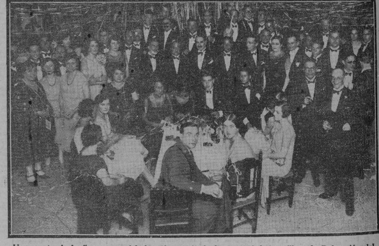
Un aspecto de la fiesta que celebró en honor de la buena sociedad sevillana la Delegación del Pabellón Argentino.