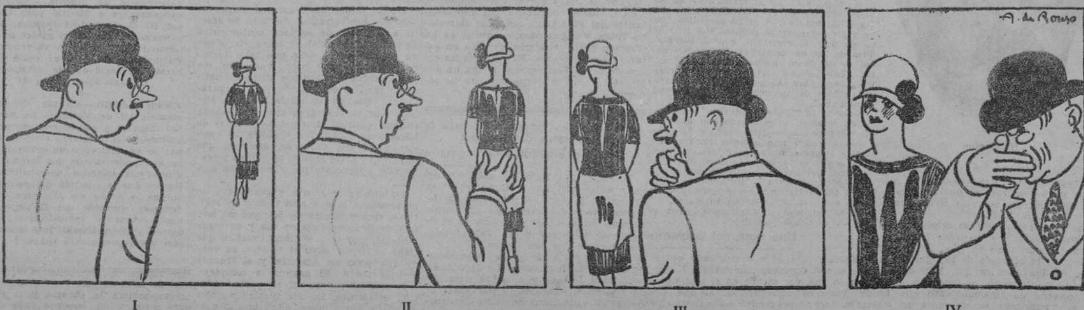
—Esa mujer no me es desconocida; esos zapatos... —Ese sombrero lo conozco y no sé de qué. —Y ese traje es de mi mujer. —¡Anda! Es mi criada.

(Historieta de Roux en "Dimanche Illustré", Paris.)