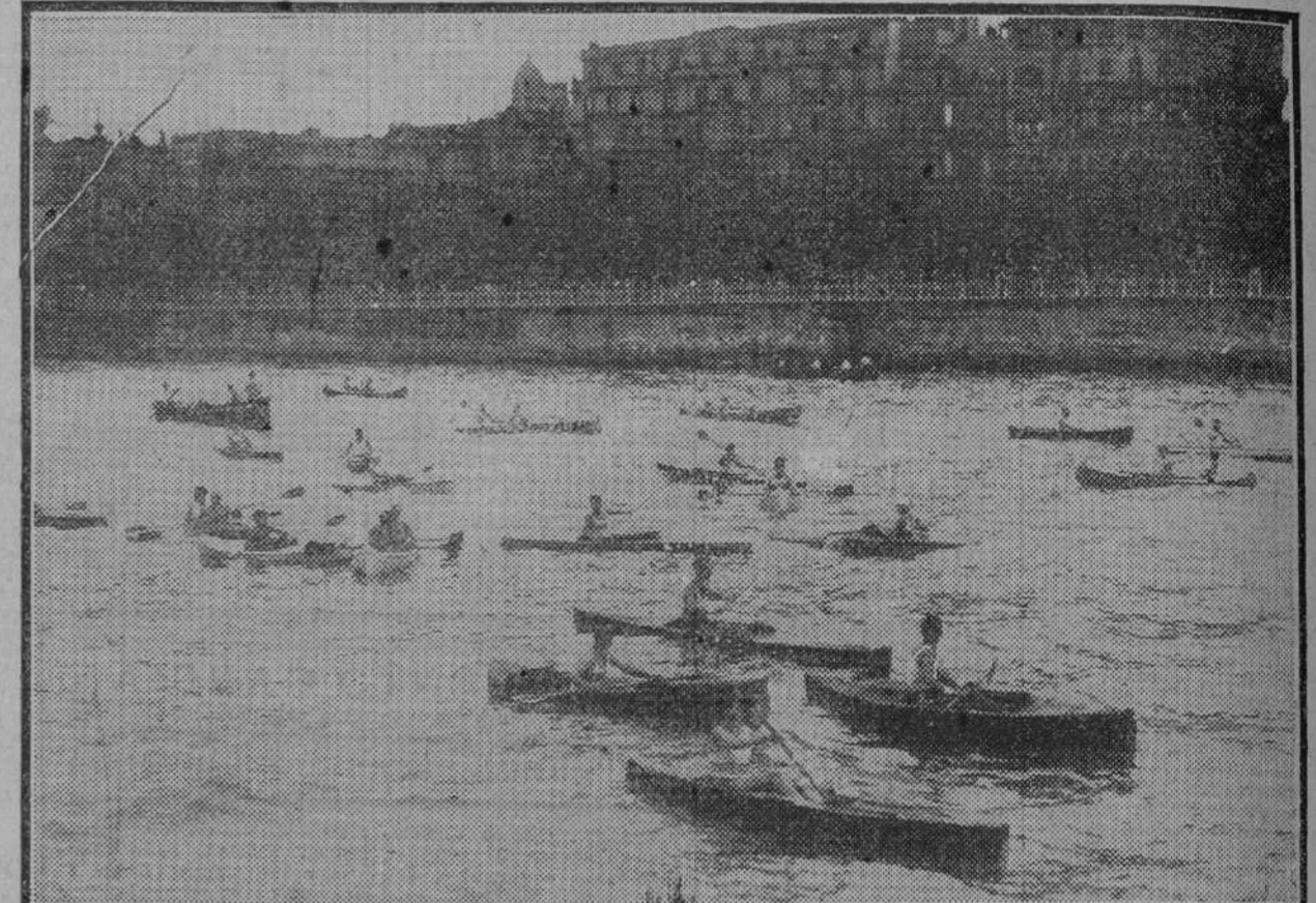
Un interesante momento del campeonato guipuzcoano de piraguas.