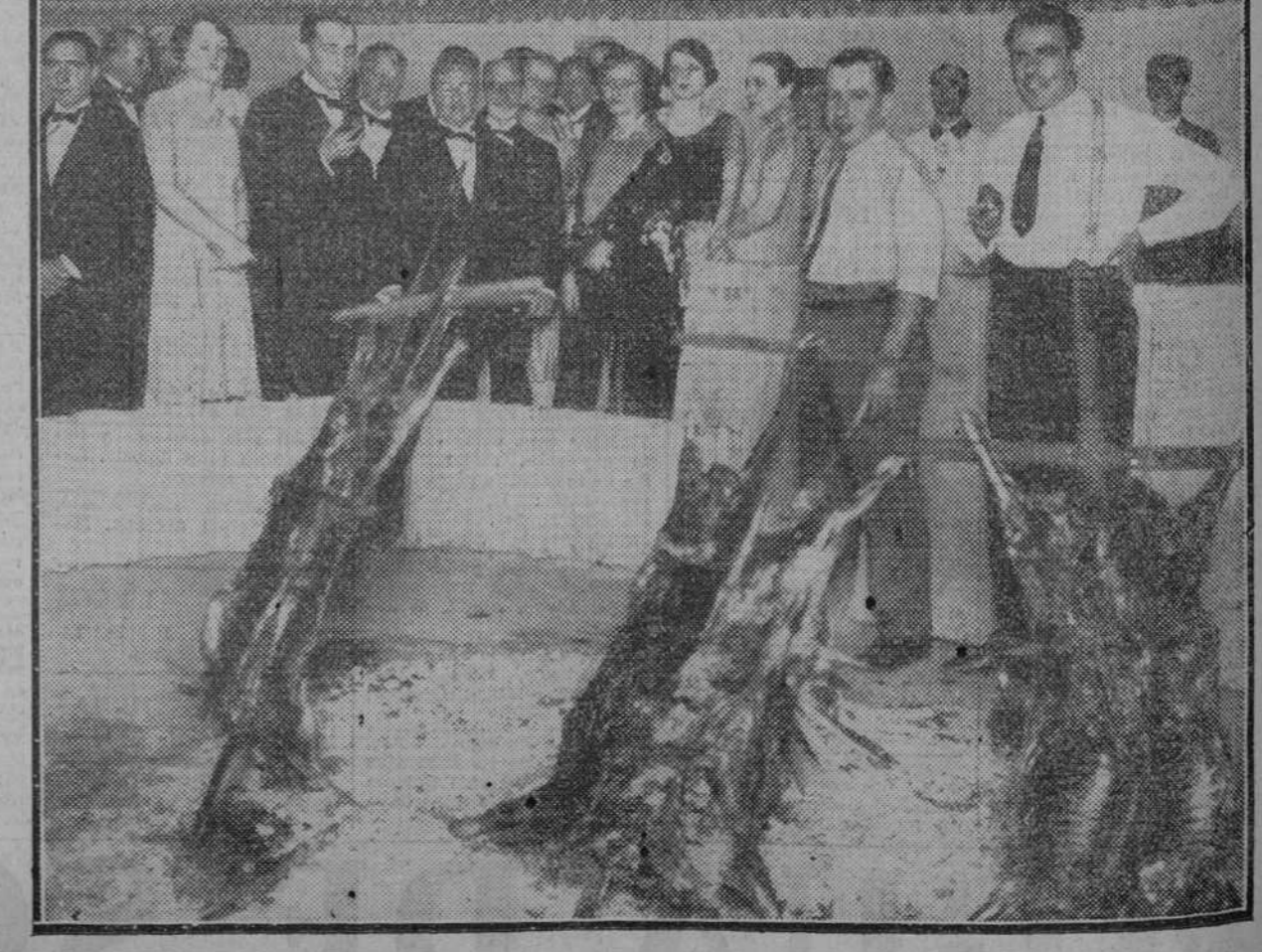
Las autoridades y los invitados presenciando el asado a la criolla en el Pabellón Argentino de la Exposición de Sevilla.