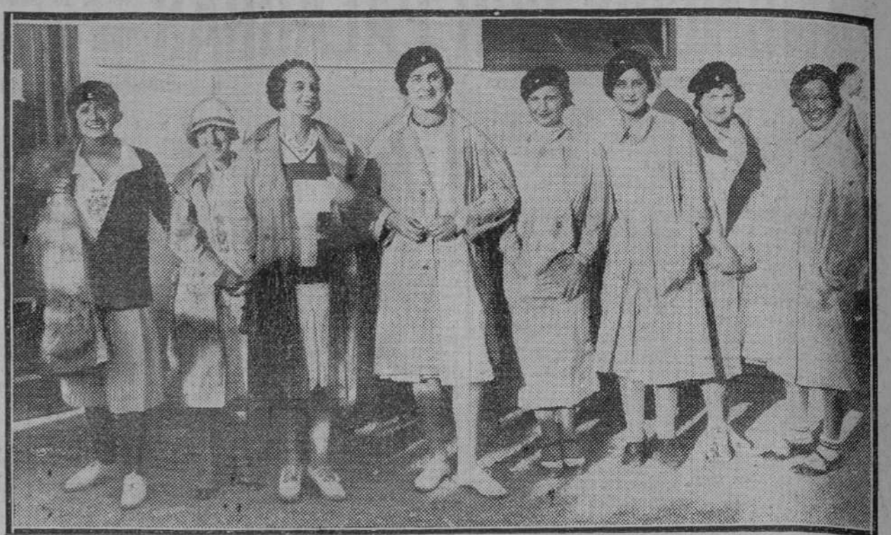
Algunas de las señoritas de Vigo, Villagarcía y La Coruña que participaron en la regata de balmores patroneados por el bello sexo.

El interior de la iglesia, entre el portal y el coro, se divide en tres naves que descansan sobre ocho pilares de dimensiones gigantescas y de 3.30 metros de diámetro, los cuales se juntan cerca de la bóveda formando arcos de oro y frescos de vivos colores. La división en tres naves, que arranca de la parte inferior del coro, queda interrumpida a unos 24 metros de la puerta principal de la iglesia, donde ésta forma un gran espacio octogonal, en cuyo centro se alzan dos pilares aislados imitando un arco de triunfo por encima de la Santa Capilla. A derecha e izquierda de la nave central hay siete altares separados de ésta última por artísticas rejas de hierro labrado. Cada uno de estos altares, adornados con estatuas y lienzos de gran valor, encierra reliquias de santos. En el centro de la nave principal cuelga un candelabro colosal de cobre dorado, re-